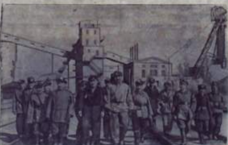
Шахтеры Монгольской Народной Республики увеличивают добычу угля.

На снимке: горняки шахты «Намайх-напитальная».