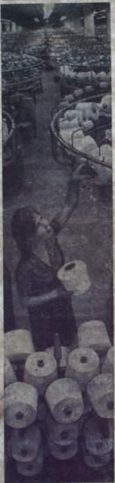
Изделия таллинской трикотажной фабрики «Марат» пользуются большим спросом. В этом году благодаря реконструкции она будет выпускать почти в полтора раза больше продукции, чем прежде.

Всю борьбу прогрессивных сил за улучшение условий жизни трудящихся, за расширение их прав и свобод капиталисты с помощью законов, полиции, суда жестоко подавляют. Особенно много репрессий обрушивается на коммунистические и рабочие партии. В США, например, много лет пытаются повлиять на Коммунистическую партию вне закона, а