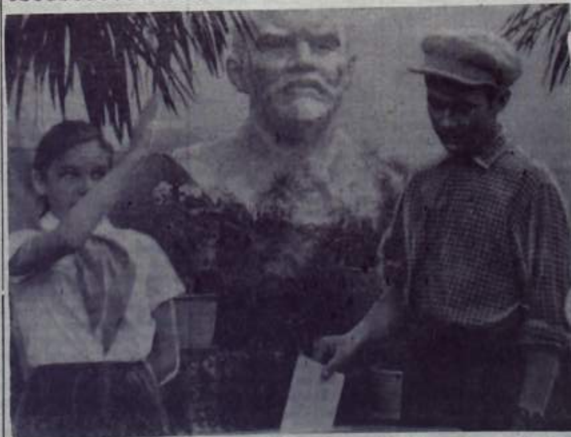
На снимке: голосование на Ленинском избирательном участке г. Кумертау.

К 12 часам дня почти половина избирателей Пушкинского избирательного участка Кумертау выполнили свой гражданский долг.