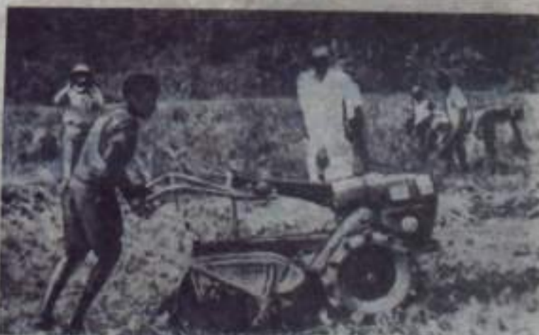
В Либерец за последние годы начинает развиваться сельское хозяйство. Создаются крупные фермы. Получает применение современная сельскохозяйственная техника. Под различные культуры расчищаются участки леса.

На снимке: на расчищенном поле одной из ферм.