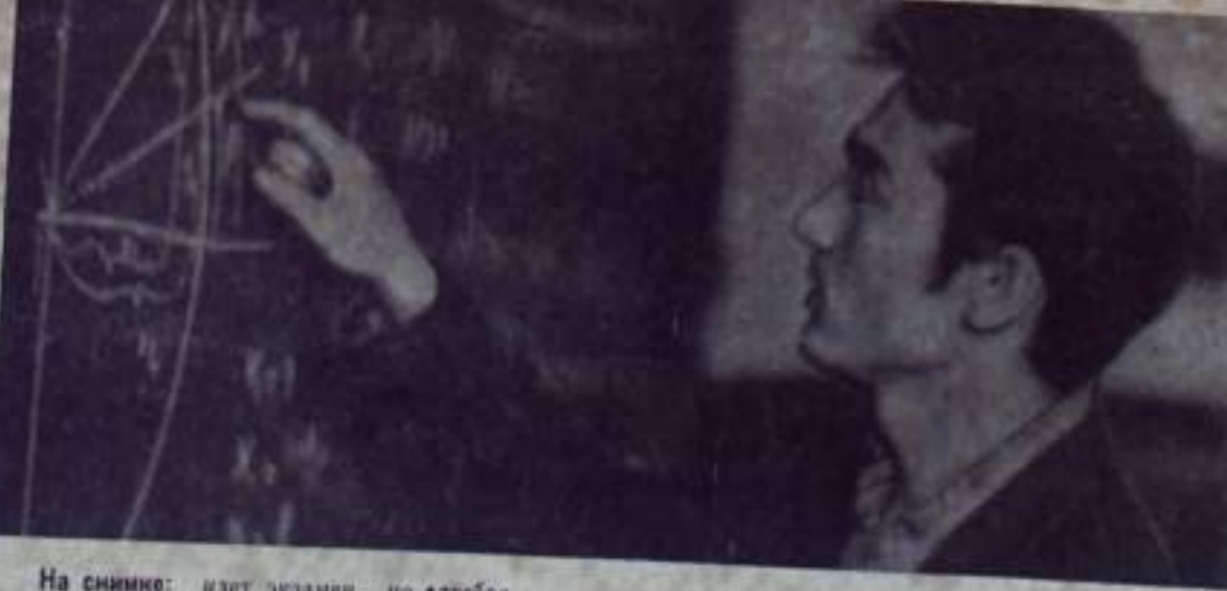
На снимке: идет экзамен по алгебре.