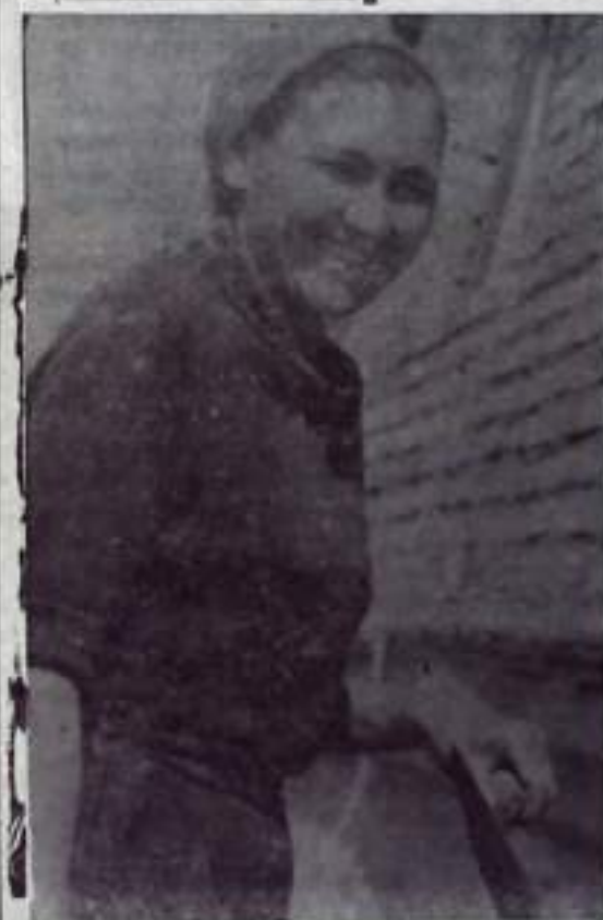
Растут новые корпуса домов в Кумертау. Меняется облик нашего города, и в этих переменах большая доля труда заложена штукатуром из РСУ ком-