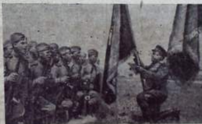
На снимке: воины у боевого знамени дают клятву бороться с врагом до полной победы.