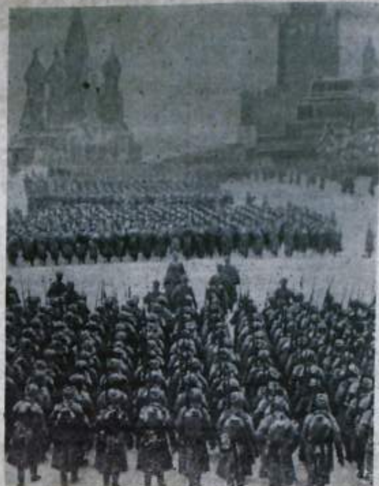
На снимке: 1941 год. С парада на Красной площади воинские подразделения направляются на фронт.

Наш народ отстоял свободу и независимость своей Родины, защитил великие завоевания социализма, спас человечество от угрозы фашистского порабощения.