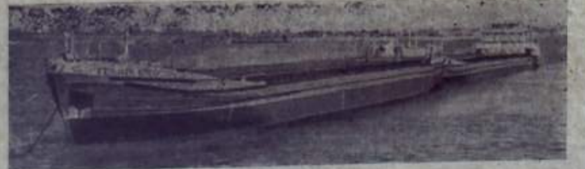
На Новосибирском судостроительном заводе построен самый крупный в мире речной теплоход. Его грузоподъемность — 10 тысяч тонн — в два раза больше теплохода типа «Волго-Дон». Судно имеет два корпуса, специальные устройства. Обслуживает корабль команда из 21 человека. Новому теплоходу присвоено имя XXIII съезда КПСС. На снимке: самый крупный в мире речной теплоход «XXIII съезд КПСС».