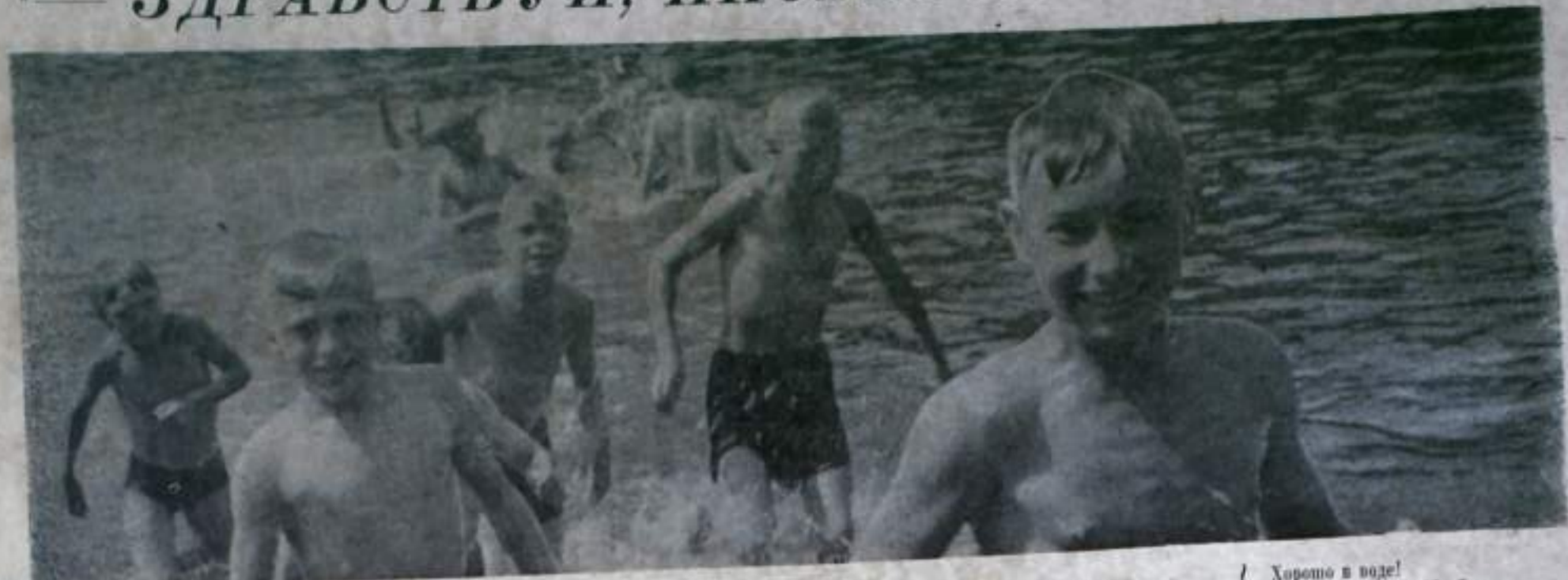
Хорошо в воде!