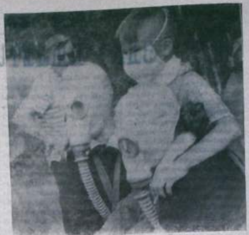
На снимке: момент соревнований — переноска «пострадавшего».