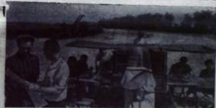
РОСТОВСКАЯ ОБЛАСТЬ. В Азовском районе проявляют большую заботу о культурно-бытовом обслуживании хлеборобов во время полевых работ.

Техник-механик, окончивший техникум и защитивший дипломный проект, может работать на должностях: механика колхоза и отделения совхоза, бригадира тракторных и комплексных механизированных бригад, лугомелиоративных станций и отрядов, ремонтных мастерских автогаражей, механика и инспектора «Сельхозтехники», мастера и инструктора производственного обучения в училищах механизации, лаборанта машинноспидометра льняных станций, научно-исследовательских институтов и других экспериментальных баз и мастерских. Учащиеся-заочники получают необходимые методические указания, контрольные работы, пособия и консультации для самостоятельной учебы. На лабора-