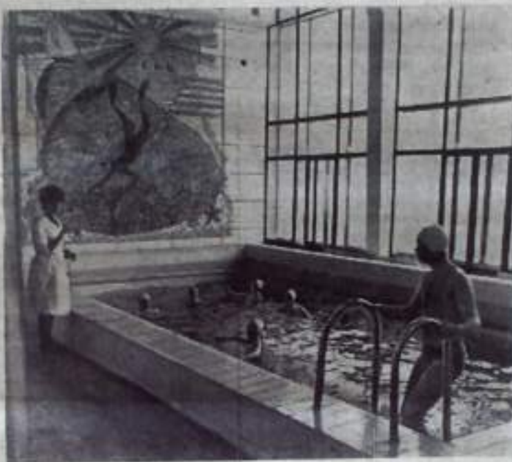
Ессентуки, в санатории «Советский шахтер» построен спортивный комплекс. Теперь отдыхающие в любое время года могут пользоваться спортивным залом, бассейном, душем, сауной.