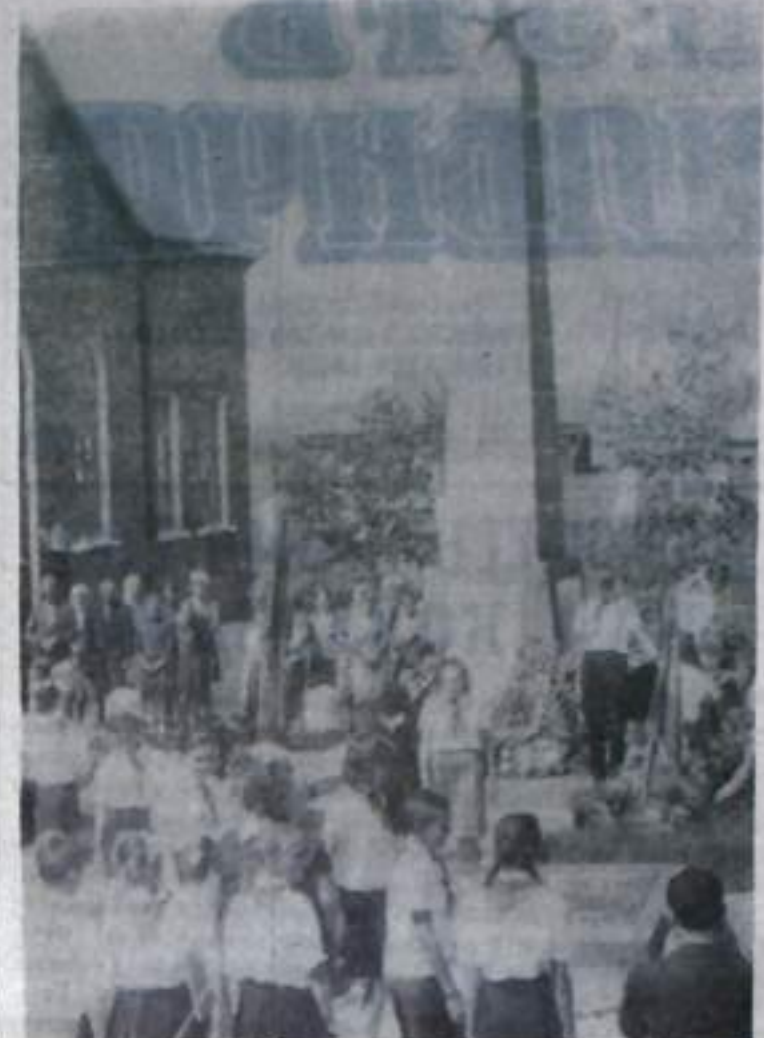
НА СНИМКЕ: пионеры у обелиска-памятника в колхозе «Дружба».

Занавес закрылся. А в зале тишина. Слово каждому хочется как бы не спугнуть и услышать только что услышанное и услышанное, побыть подольше наедине с образом великого вождя.