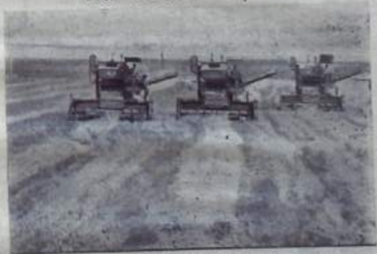
В Дагестанской АССР идет уборка зерновых. НА СНИМКЕ: подборка и обмолот валков в совхозе «Новогерозменский».