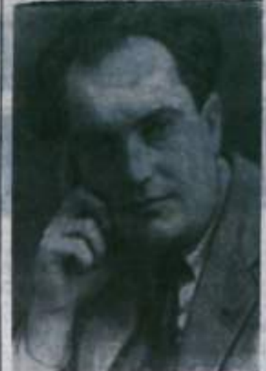
6 июня исполняется 80 лет со дня рождения выдающегося деятеля Коммунистической партии и Советского государства Валерия Владимировича Куйбышева (1888—1935). Он участник революции 1905—1907 гг., комиссар на фронтах гражданской войны. Был председателем ВСНХ (1926), затем председателем Госплана СССР и заместителем председателя Совнаркома СССР, возглавлял Комиссию советского контроля. Фотохроника ТАСС