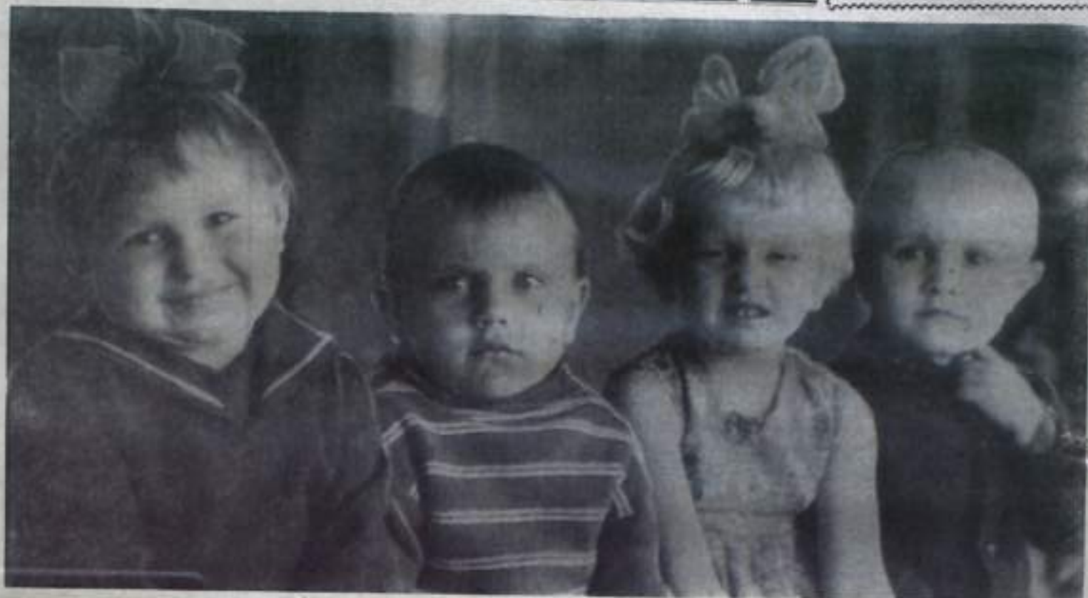
Маленькие наследники Великого Октября.

* В мире насчитывается более миллиарда детей. Из них 600 миллионов страдают от голода и болезней. Вследствие систематического недоедания каждый день умирают 20 тысяч детей. Самый высокий процент смертности падает на страны Азии, Африки и Латинской Америки.