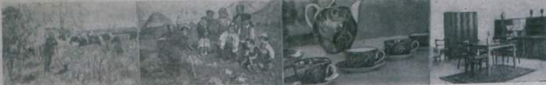
«Художники — народу» галерея выставка открыта в Москве. Демонстрируются выигрыши третьей Всесоюзной художественной лотереи.