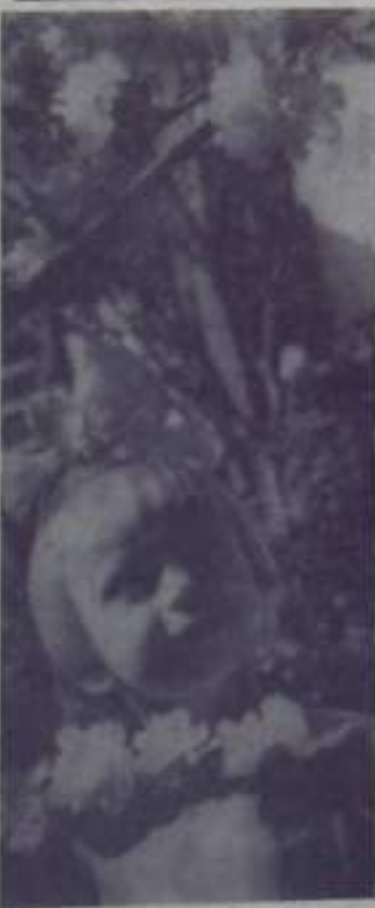
В весеннем саду.

В связи с выходом в свет Указа Президиума Верховного Совета СССР городской комитет народного контроля проводит семинары с нештатными инспекторами народного контроля, на которых намечаются конкретные мероприятия по превращению в жизнь положений Указа.