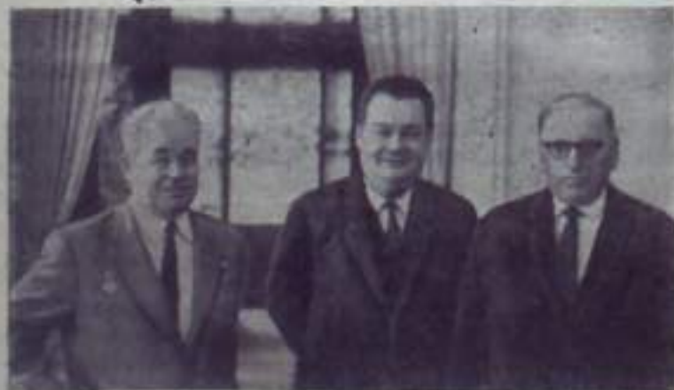
Москва. Правительство Чехословацкой Социалистической Республики за выдающиеся результаты по внедрению в сельскохозяйственное производство ЧССР высокоурожайных сортов озимой пшеницы и повышению урожайности наградило советских ученых П. П. Лукьяненко и В. И. Ремесло орденами Труда.