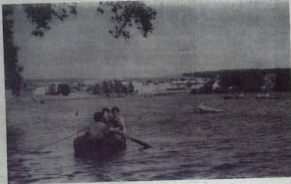
Легкий отдых на пруду.