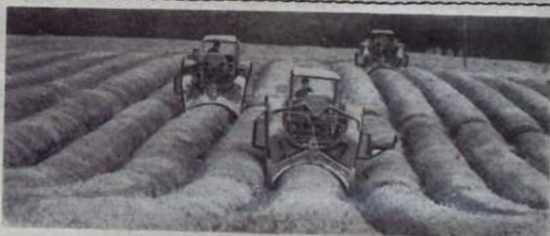
В Аджарии идет сбор чайного листа. Иные хозяйства республики обзавелись собрать его 34000 тонн, значительно больше планового задания.

Е. БЫКОВА, зав. пунктом сигнализации по защите растений.