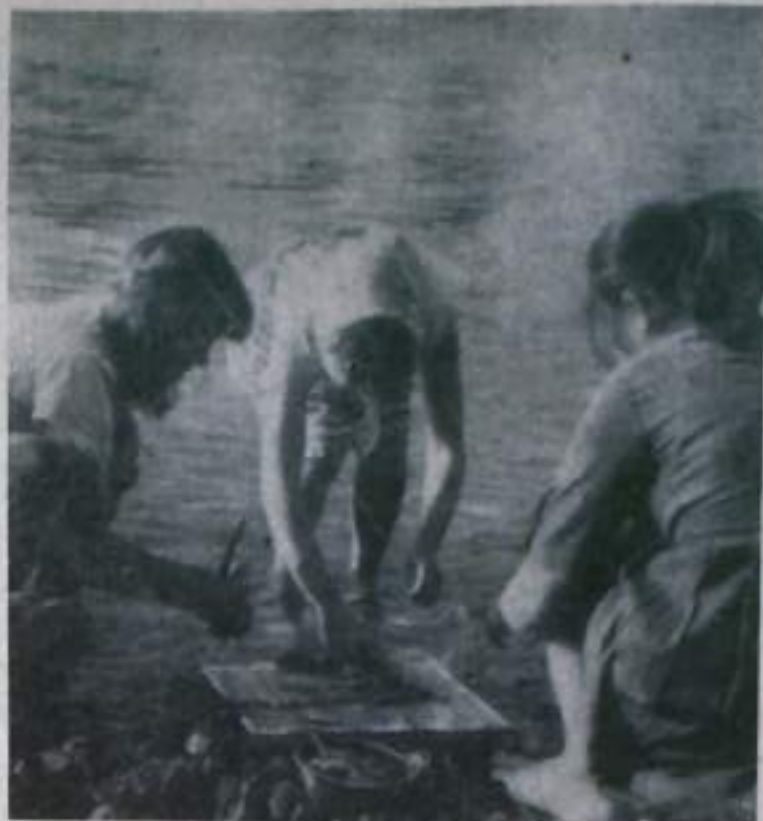
Туристы Кумертауской школы-интерната № 2 имени Ю. А. Гагарина на берегу Нугушского водохранилища.