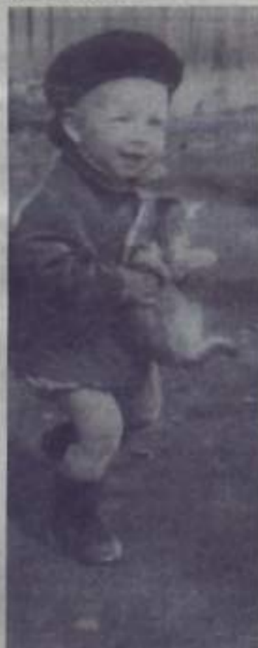
Маленький озорник.