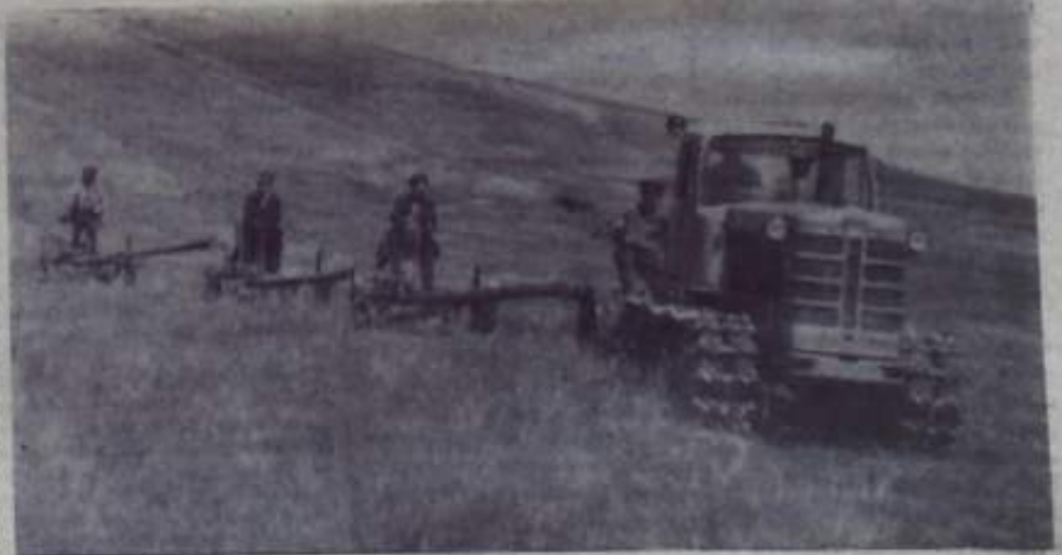
НА СНИМКЕ: На сенокосных угодьях Кузургазинского совхоза.