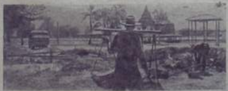
Тяжел труд бедняков Тасланды. На этом сломанном рабочем порыве мусор в небольшие карманы. Из работы оплачивается так мало, что предпринимателям нет выгоды выводить механизмы.