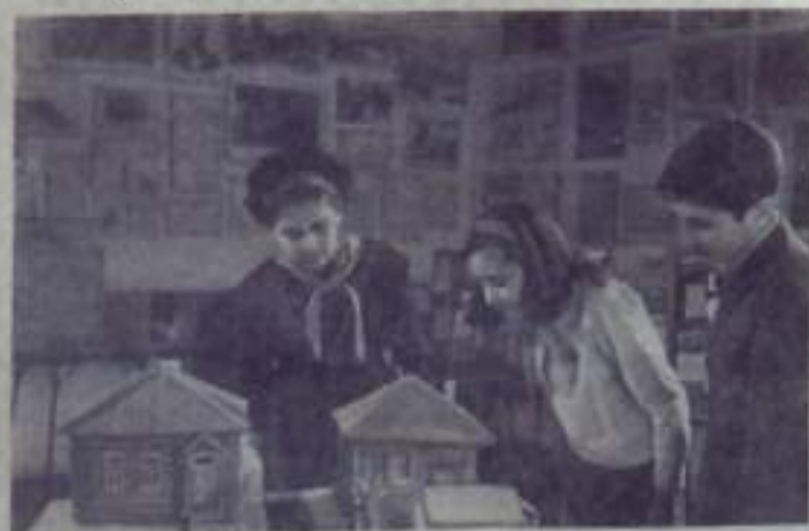
Музей В. И. Ленина в школе № 160 города Баку стал самостоятельным штабом политико-воспитательной работы. При нем созда-

на эстетическая группа, в состав которой 30 старшеклассников.