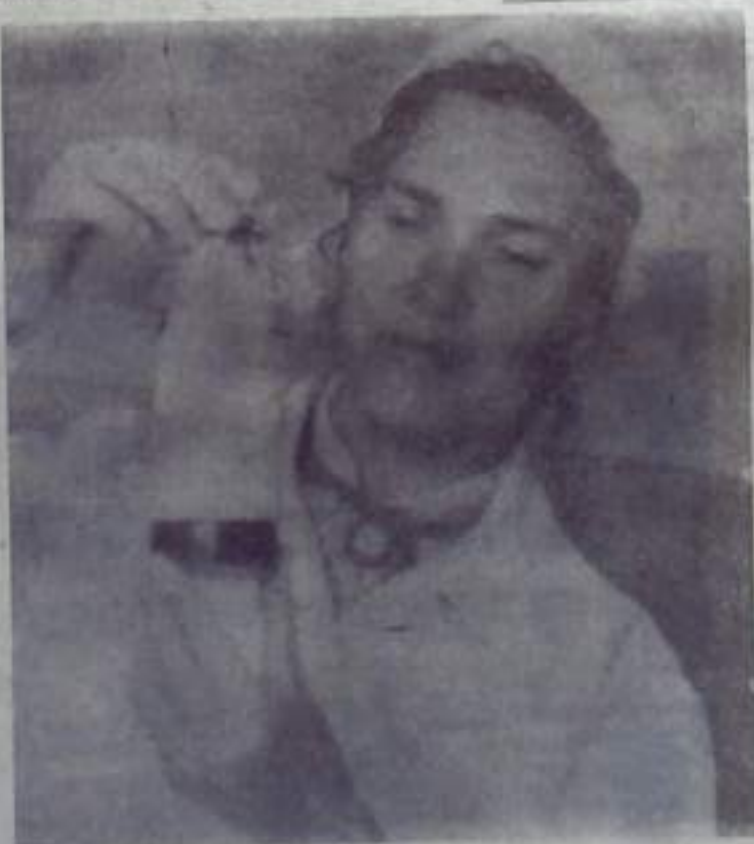
из ответственной и почетной работе.

В связи с 50-летием Советского здравоохранения коллектив больницы горячо желает работникам отделения новых успехов в