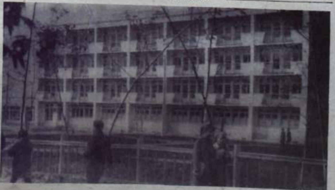
НА СНИМКЕ: ночной профилакторий комбината «Башкируголь».