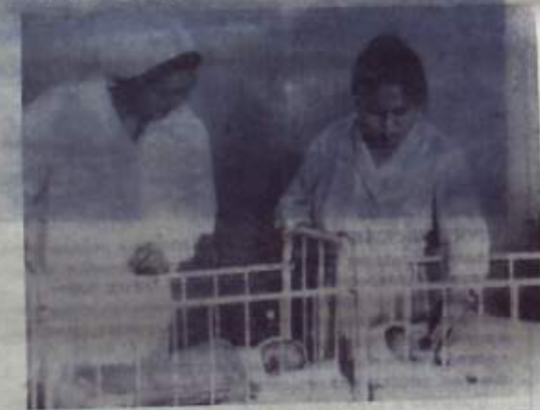
НА СНИМКЕ: врач и молодая мать у кроватки новорожденного.

З. САЙФУЛЛИНА, А. АБДРАШИТОВА, Т. ВОЛКОВА.