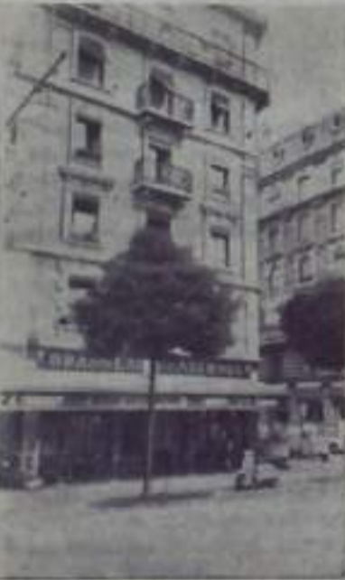
На снимке: Женева. Улица Дюбуа-Мелли, 6. В начале XX века в кафе «Казерн» находился Народный дом, где собирались политэмигранты. Здесь неоднократно выступал В. И. Ленин.

только выступавшая против империалистической войны, была арестована и сослана в Сибирь. Исключительно тяжелыми были материальные условия жизни Владимира Ильича. Никогда он так сильно не нуждался, как во время войны. И в этих труднейших условиях Ленин ни на минуту не прерывал партийной работы, настойчиво собирав и сплачивая большевистские силы. Он объединял группы большевиков, находившихся за границей, выступал в ряде городов Швейцарии с рефератами об отношении большевиков к империалистической войне. Преодолевая огромные трудности, организовывал печатание и распространение большевистских изданий. Почти после годичного перерыва 1 ноября 1914 года вышла в