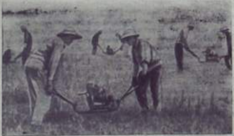
ДЕМОКРАТИЧЕСКАЯ РЕСПУБЛИКА ВЬЕТНАМ. В прошлом году жители провинции Лангсон совместно с рабочими центра по посадке лесов посадили столько молодых саженцев, сколько было посажено за период с 1957 по 1967 год.