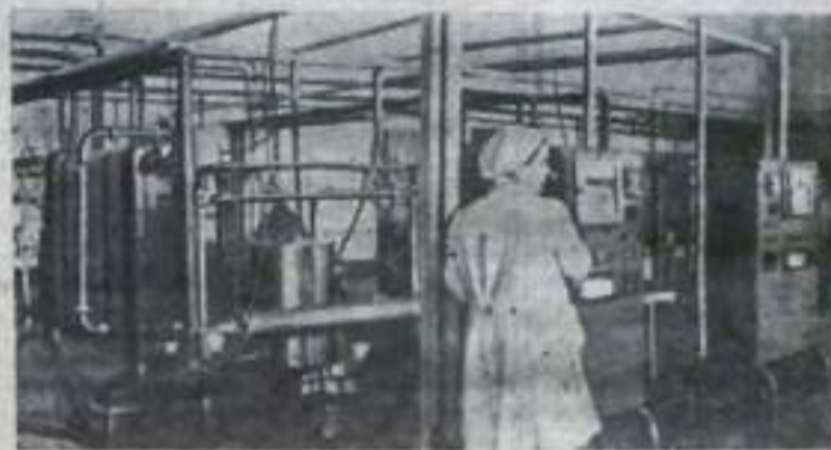
Колхоз «Россия» Пермского района построил молочный завод, который каждое утро отправляет свежее молоко и сливки в магазины города Перми. Экономисты колхоза