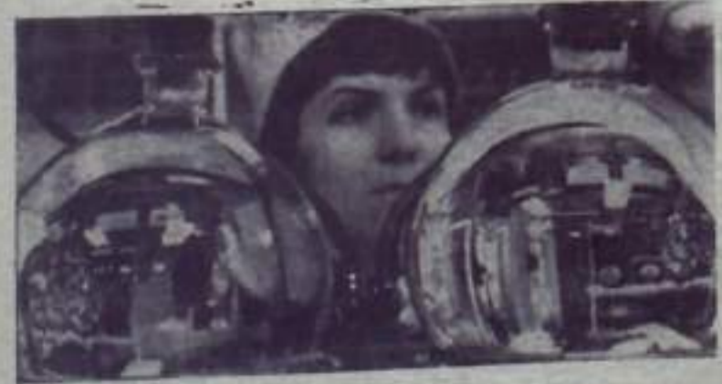
Ленинград. В научно-исследовательском институте имени Пастера создаются различные сыворотки и препараты, предупреждающие инфекционные заболевания.

В соответствии с поручением ЦК КПСС, Совета Министров СССР и ВЦСПС Государственный комитет труда, Госстрой СССР и ВЦСПС определили размер и порядок выдачи доплат за руковод-