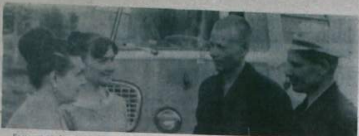
Возврат профилактическую работу по выявлению ранних форм заболевания легких и сердечно-сосудистой системы среди населения нашего города и района ведет бригада передвижного флюорографа (рентгеновской установки) Кумертаурского тубдиспансера.

Меняется отдельная двухкомнатная квартира со всеми коммунальными удобствами в г. Кумертау на равноценную в г. Кумертау. За справками обращаться в отдел кадров машзавода.