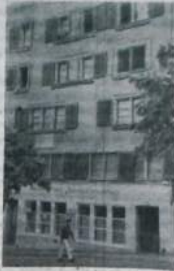
На снимках: дом по улице Шпигельгассе в Цюрихе (Швейцария). Здесь с 21 февраля 1916 года до отъезда в Россию жили В. И. Ленин и Н. К. Крупская. В. И. Ленин. Цюрих (Швейцария), 1917 год.

Владимир Ильич заключил именуемой II Интернационала делу пролетариата, объявив беспощадную борьбу с шовинизмом. Вместо обанкротившегося II Интернационала Ленин призвал создать новый, Третий, подлинно пролетарский Интернационал.