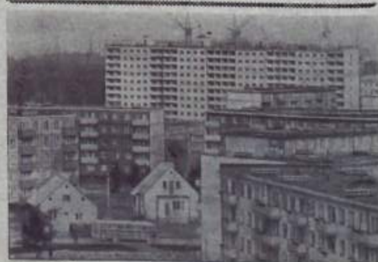
ТАШКЕНТ. До 150 тысяч квадратных метров жилой площади ежегодно сдают в эксплуатацию строители столицы Советский Эстонии. Основным районом новостроек является Мустажк, в котором уже проживает около 60 тысяч таллинцев. На снимке: Мустажк сегодня.

К. КАЗАКБАЕВ, уполномоченный Башкирского управления «Вторчермет» по Кумертаускому району.