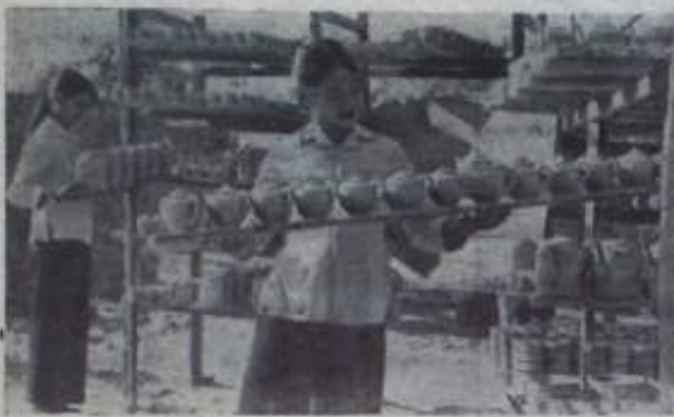
ДЕМОКРАТИЧЕСКАЯ РЕСПУБЛИКА ВЬЕТНАМ. Готовая продукция керамического завода Жиа Труонг в провинции Ниньбинь.