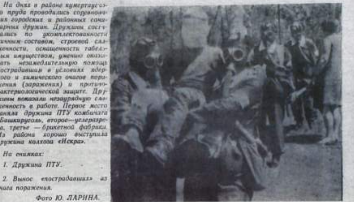
На днях в районе кумертауского пруда проводились соревнования городских и районных спортивных дружин. Дружинами составлены по укрупненности личным составом, строевой слаженности, оснащенности габаритными имуществом, умения оказывать немедленную помощь пострадавшим в условиях взорванного и химического очагов поражения (заражения) и протичерно бактериологической защите. Дружина показала незаурядную слаженность в работе. Первое место заняла дружина ПТУ комбичата «Башкирэнерго», второе — уездареза, третье — брикетной фабрики. Из района хорошо выступила дружина колхоза «Искра».