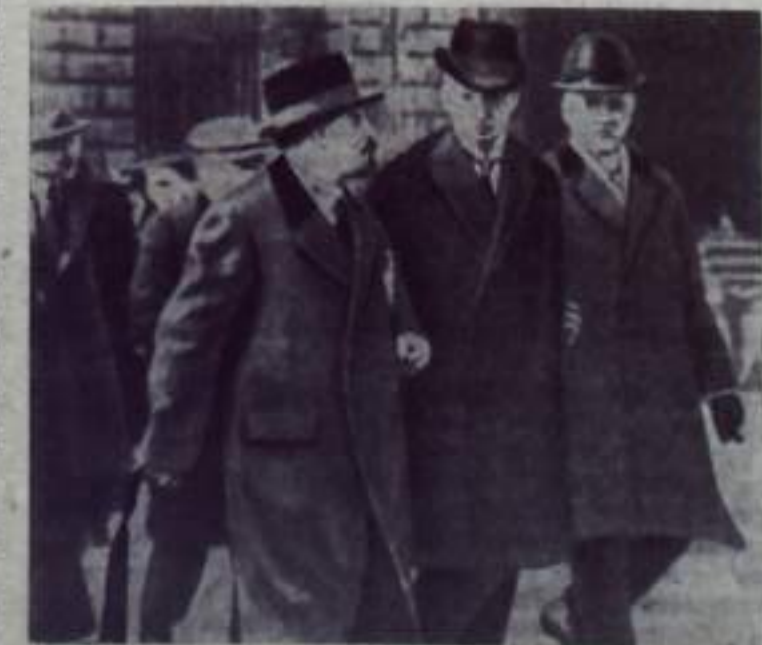
На снимке: В. И. Ленин в Стокгольме проездом при возвращении из Швейцарии в Россию. Апрель 1917 года.

Проводя огромную практическую деятельность по организации и сплочению сил революционной пролетариата России и других стран, Ленин одновременно усиленно занимался разработкой теоретических вопросов. В этот период он много работает над вопросами философии, вновь изучает произведения Гегеля, Аристотеля, Фейербаха. Многочисленные заметки с комментариями, замечаниями Ленина и другие материалы его исследования были изданы впоследствии под названием «Философские тетради», которые служат замечательным образцом научной работы Ленина. Они представляют собой новый шаг в творческом развитии философии мар-