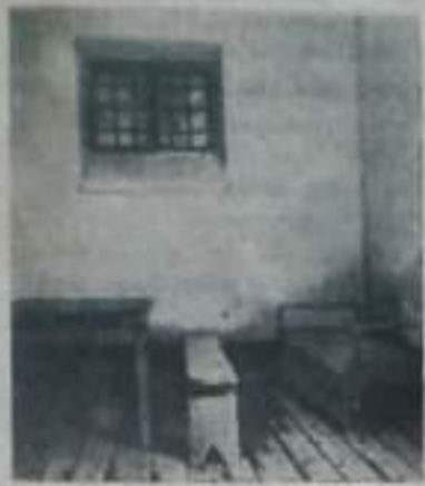
На снимке: Новый Тарг, Камера № 7 в здании бывшей тюрьмы. Здесь находился в заключении В. И. Ленин, арестованный австрийскими властями (август 1914 г.).

летом 1914 года началась первая мировая война, в которой противоборствовали две группы империалистических государств: Германия и Австро-Венгрия — с одной стороны, Англия, Франция, Россия — с другой. Потом в них