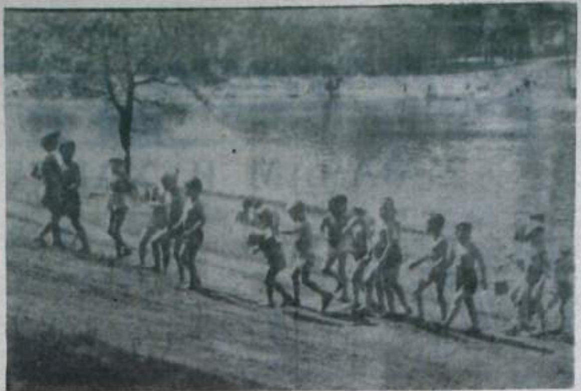
ЗДРАВСТВУЯ, СОЛНЕЧНОЕ ЛЕТО!