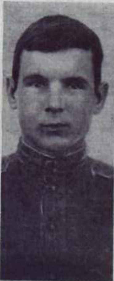
«ПУТЬ ИЛЬИЧА» 3 стр. 6 июня 1970 года.