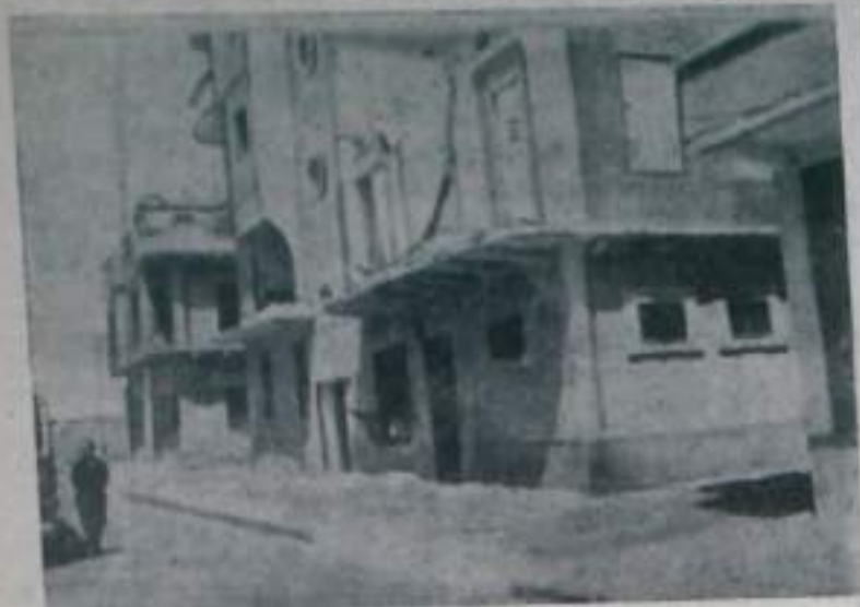
Исмаильская военщина не прекращает агрессивных действий против ОАР. В результате многочисленных артиллерийских обстрелов и бомбардировок разрушена или повреждена значительная часть Исмаильи. Гражданское население города почти целиком эвакуировано.

НА СНИМКЕ: разрушенные дома в одном из районов Исмаильи.