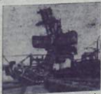
Мощные многоковшовые экскаваторы работают в горном цехе Бривского фосфоритного завода. Из добытой руды предприятие изготавливает в этом году 460 тысяч тонн фосфоритной муки для нужд сельского хозяйства.

НА СНИМКЕ: многоковшовый экскаватор на добыче руды.