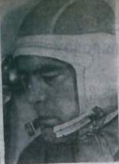
Командир космического корабля «Союз-9» А. Г. Николаев.