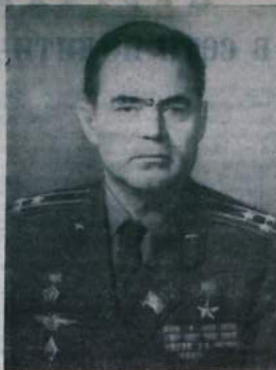
Командир космического корабля «Союз-9» Андриян Григорьевич Николаев.

В 13 часов 40 минут московского времени 7 июня начат первый сеанс радиосвязи седьмого дня полета. Командир корабля Андриян Григорьевич Николаев сообщил, что экипаж чув-