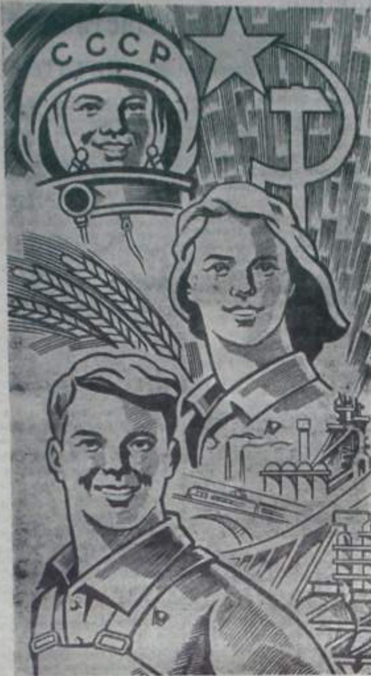
Рисунок художника С. Гришко.