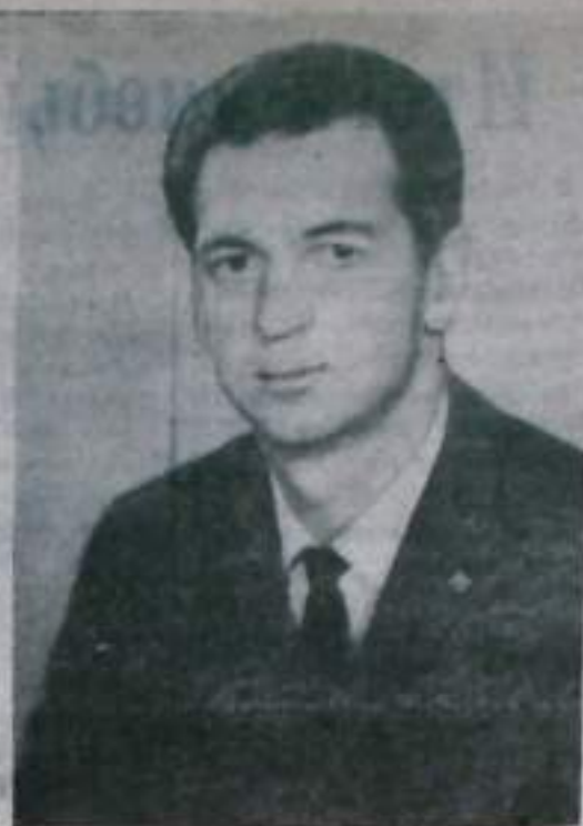
Бортинженер космического корабля «Союз-9» Виталий Иванович Сенастьянов.