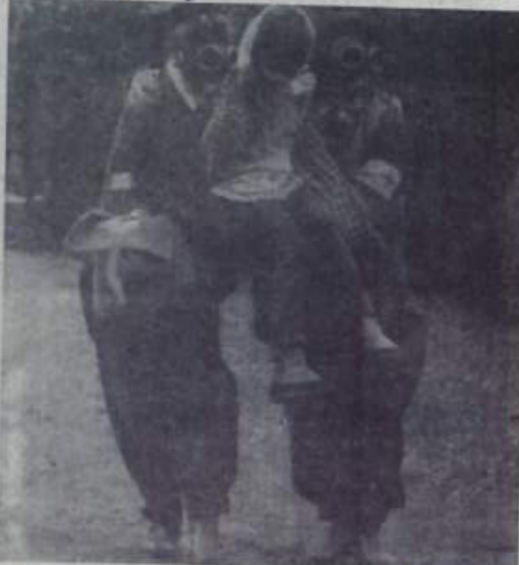
На снимке: во время практических занятий.