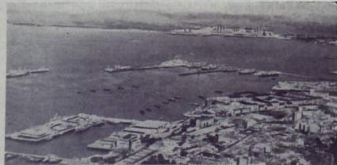
Гибралтар — колония и военная база Англии на юге Пиренейского полуострова. Здесь на площади в 6 квадратных километров проживает 25 тысяч человек. У них — беспокойная жизнь. Крепость начинена оружием. Кроме того, Гибралтар — предмет спора между Англией и Испанией, которая пре-

тendует на эту территорию. Это уснавляет у населения чувство неуверенности в завтрашнем дне.