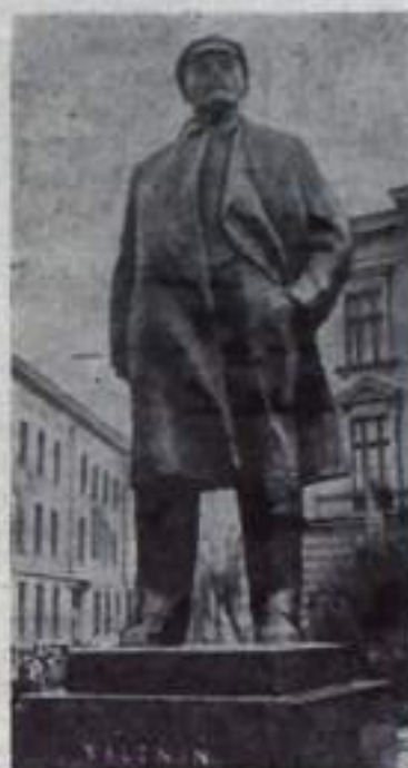
Чехословакия. Памятник Владимиру Ленину, открытый на центральной площади в городе Градец-Кралове.