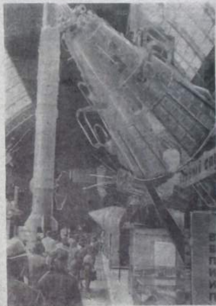
В павильоне «Носмос».

Прогрессивный метод аэроионизации животноводческих помещений показывается на ВДНХ СССР.