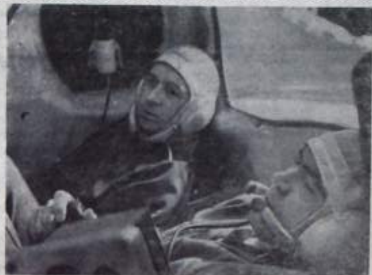
Командир космического корабля «Союз-9» А. Г. Николаев (на переднем плане) и бортинженер В. И. Севастьянов на тренировках.