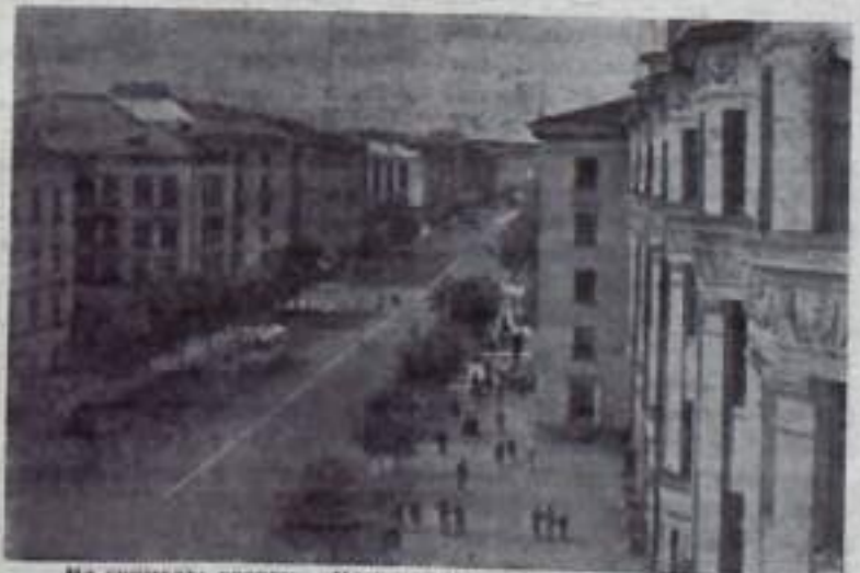
На снимках: сверху — Петрозаводск, проспект К. П. Костина, снизу — тракторные «ТДТ-55» на заводском дворе.