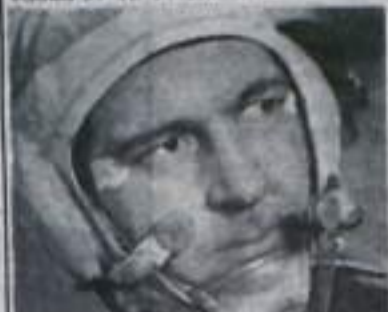
Бортинженер космического корабля «Союз-9», кандидат технических наук Виталий Иванович Севастьянов.