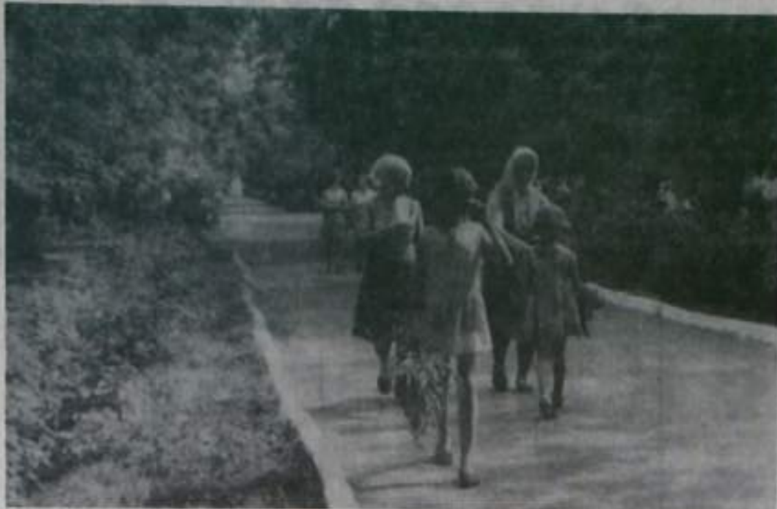
В сквере по улице Ленина.