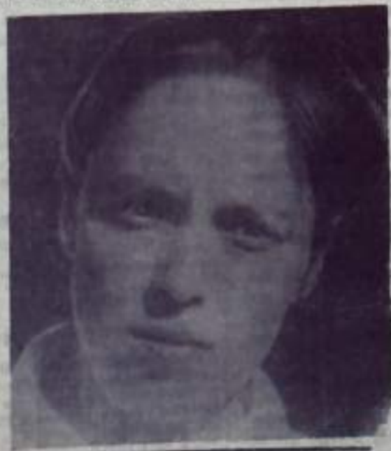
«ПУТЬ ИЛЬИЧА» 2 стр. 3 июня 1971 года.