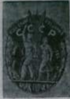
ОРДЕНОМ «ЗНАК ПОЧЕТА»