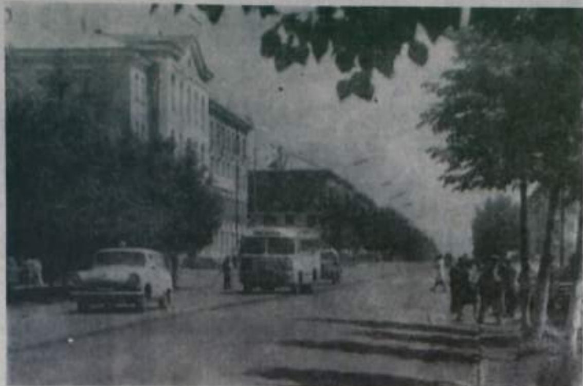
Растет и хорошеет Кумертау. В яркий зеленый наряд оделась одна из центральных улиц города — ул. Карла Маркса.

3 июля в городе Туле состоится тираж 6-й автомобильной лотереи ДОСААФ первого выпуска. В нем будет разыграно 480 автомобилей «Москвич-412», 320 автомобилей «Запорожец-966», 12240 других ценных вещей на общую сумму 1 800 000 рублей.