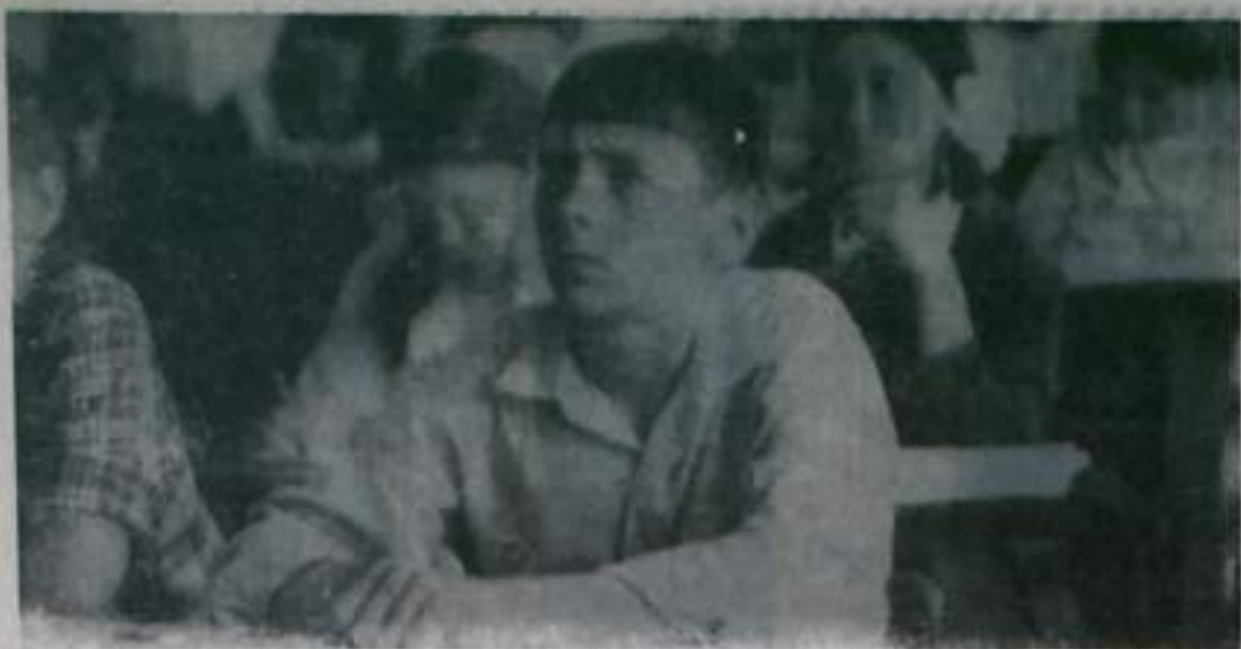
Трудная задача. (Экзмен по математике в 8 «в» классе школы № 9).