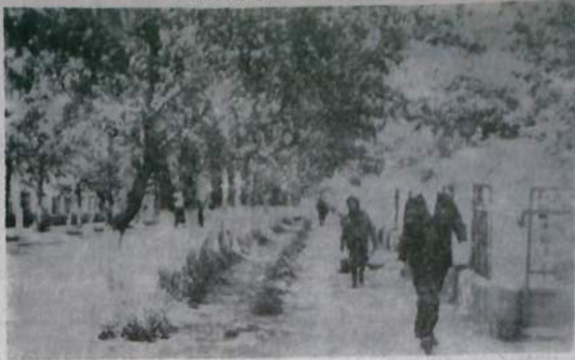
Одна из самых зеленых улиц города — Парковая.