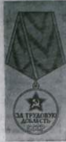
МЕДАЛЬЮ «ЗА ТРУДОВУЮ ДОБЛЕСТЬ»