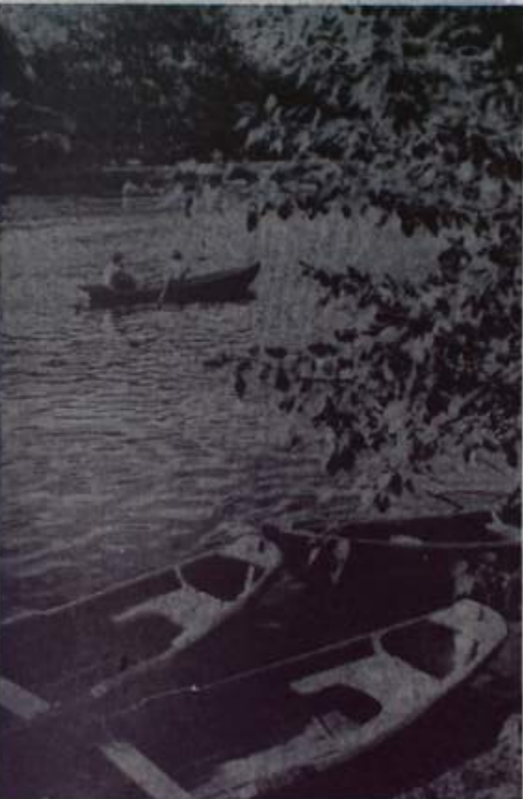
В жаркий день...

Ребята, исполнившие свои номера на «отлично», поедут и заключительный смотр в г. Уфу. Генеральной репетицией для вокально-инструментального ансамбля школы № 9 послужит городская конкурс ансамблей, который состоится 16 июня во Дворце культуры угольщиков. Конкурс этот будет проведен в рамках Всесоюзного фестиваля молодежи. Для участия в нем приглашаются молодые исполнители города и района. Победители получают 6 призов ГЕ ВЛКСМ, отделов культуры, райкома профсоюза рабочих и служащих сельского хозяйства. Начало конкурса в 19 часов. М. РЫБАЛНИНА, инструктор ГИ ВЛКСМ.