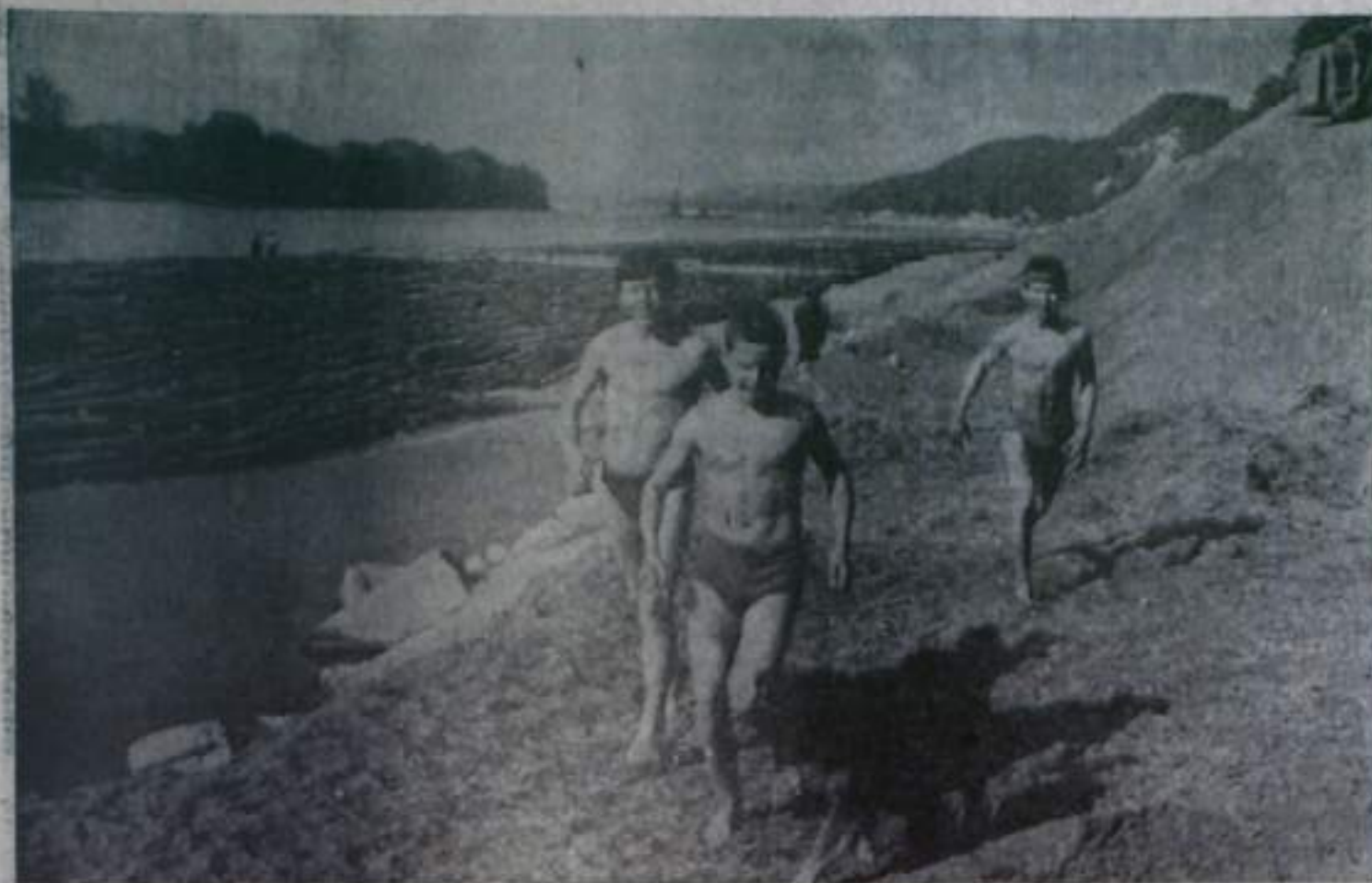
ИЮНЬ. НА РЕКЕ БЕЛОВО.