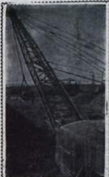
УКРАИНСКАЯ ССР. Коллектив предприятий буровзрывной промышленности Кировоградской области за семилетие увеличился на пять мощных разрезов. Первая очередь этих новостроек — Балазовский и Бандуровский разрезы, запасы угля в которых исчисляются примерно по 30 миллионов тонн. Строительство Бандуровского разреза будет завершено в 1961 году. Балазовский разрез должен вступить в строй действующим в нынешнем году. Он будет давать свыше полутора миллионов тонн топлива в год.