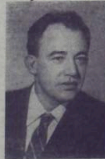
А. Е. Карнейчук—писатель, общественный деятель (СССР).