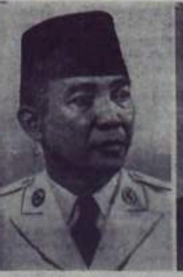
Донато Сукарно — общественный и государственный деятель (Индонезия).