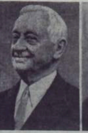
Сайрус Итон — общественный деятель (США).