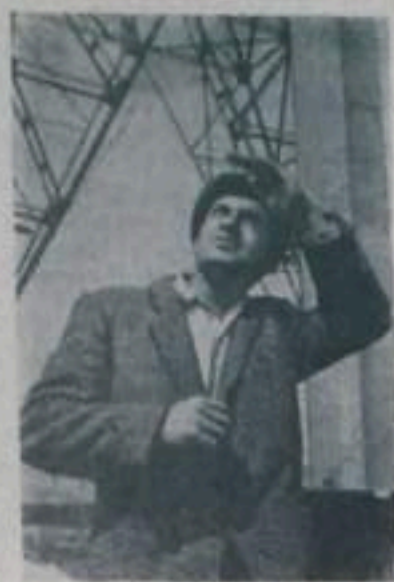
АЗЕРБАЙДЖАНСКАЯ ССР. На склоне вертеу Куру у города Алашты. Байракам сооружается тепловая электростанция, ее оборудование

который будет установлено над открытым небом. Благодаря этому сроки строительства станции сокращаются вдвое, а материальные затраты — в два с половиной раза.