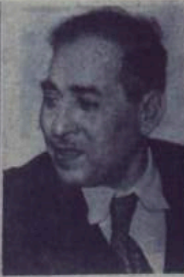
Азим Шериф — общественный деятель (Иранская Республика).