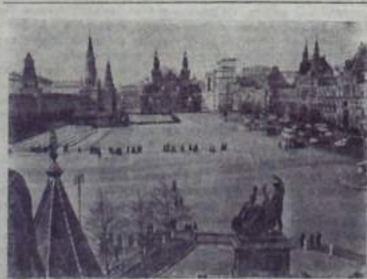
Москва. Красная площадь.

Верные подручные партии, работники советской печати с честью оправдывают доверие партии, активно борются за осуществление величественных планов коммунистического строительства.