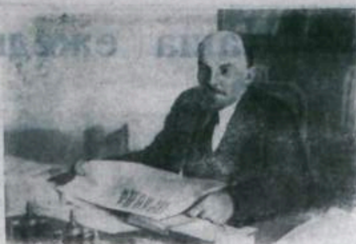
В. И. Ленин за чтением «Правды».