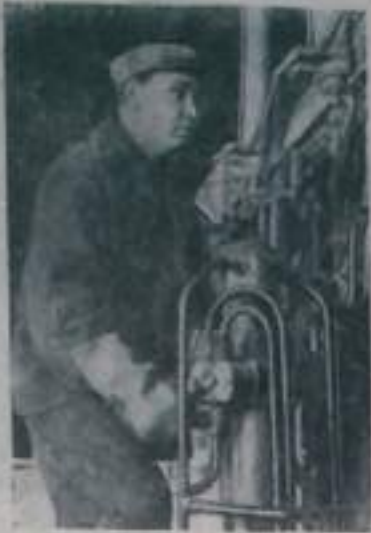
ЧЕЛЯБИНСК. На электромеханическом комбинате заканчивается строительство цеха производства ферросплавов. В него входят печи, шихтовое и сушильное отделения, электролизная станция, водонапорная база. В ближайшее время две печи выдут первый феррохром.

При проектировании и строительстве цеха учтены последние достижения техники производства ферросплавов. Особое внимание уделено автоматизации технологической линии подготовки и подачи шихты в печи.