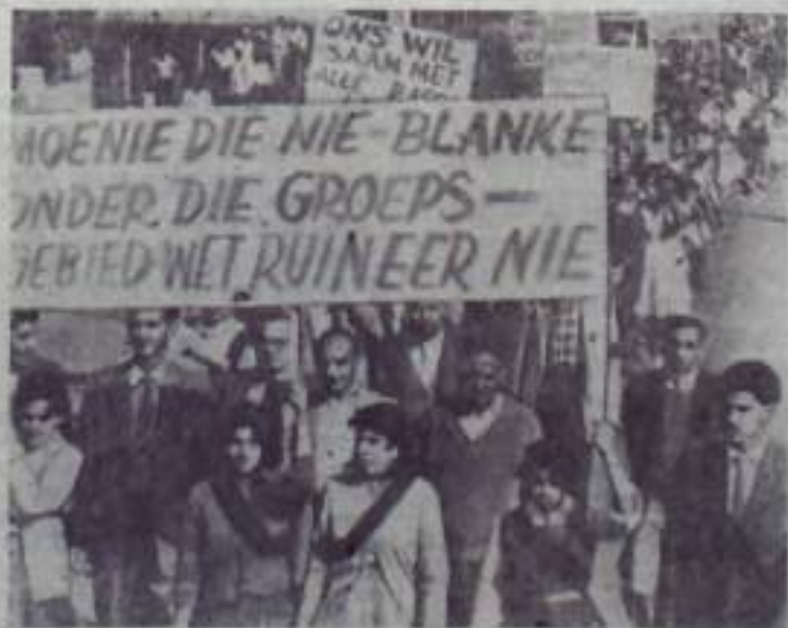
В Южно-Африканском Союзе продолжается борьба против апартеида. Недавно была в Наталье собрана большая демонстрация индийцев, выступивших против закона об установлении определенной жестокости для расовых меньшинств. Этот расистский закон, принятый в 1957 году, имел целью лишить индийцев для жизни, жалости и предоставления другим национальностям.

НА СНИМКЕ: во время демонстрации индийцев.