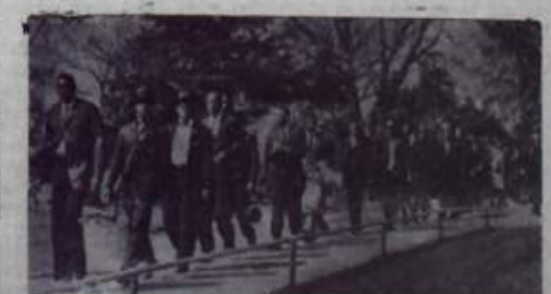
Соединенные Штаты Америки. Участники демонстрации негров против сегрегации. Они прошли перед зданием законодательного собрания города Колумбия (штат Южная Каролина). Агентство Ассошиэтед Пресс. распространяя этот снимок, сообщало, что позднее демонстранты были арестованы.