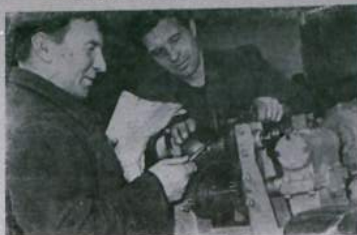
КАЛИНИНСКАЯ ОБЛАСТЬ. Свыше 200 рационализаторов Бежецкого завода автомобильного оборудования имеют свои личные счета. Рационализаторы внесли в фонд семилетки 207 тысяч рублей, сэкономили 435 тонн стали различных марок, 24,8 тонн цветных металлов и много других ценных материалов.

№ 65 (1186) СРЕДА 31 М А Я 1961 года Цена 2 коп.