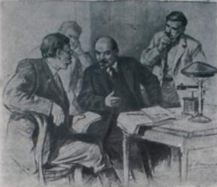
В. И. Ленин беседует с рабочими корреспондентами в редакции газеты «Правда».