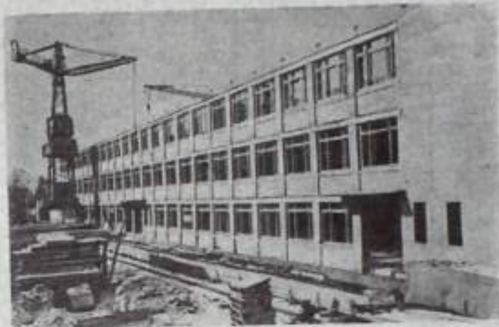
ЛЕНИНГРАД. В Старом Петергофе сооружаются три школы-интерната. В трехэтажных зданиях, напоминающих по форме букву «П», разместятся бытовые и учебные корпуса, мастерские, кабинет домоводства, медицинский пункт. Школы будут готовы к новому учебному году.

НА СНИМКЕ: строительство школ-интерната №3.