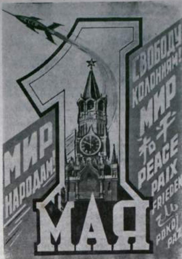
Фотоплакат Б. Антонова.

Перевыполнением планов встречи первомайский праздник трудящиеся Кумертауского хлебокомбината. План апреля выполнен на 103 процента. При задании выработать за месяц продукции на 101,9 тыс. рублей, выработано на 105 тыс. рублей. План четырех месяцев выполнен на 102 процента.