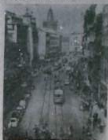
Улица на Пржишкпе в Праге.

Прошедший год явился знаменательным в истории страны — была принята новая конституция ЧССР, закрепившая победы социалистического строительства. Новая конституция провозгласила глубокой демократичностью, она создает все условия для широкого участия народа в управлении хозяйством и государством, в решении всех вопросов общественной жизни. Во введении и новой конституции трудящийся народ ЧССР провозглашает: «Мы вступили в новый период своей истории и готовы идти дальше».