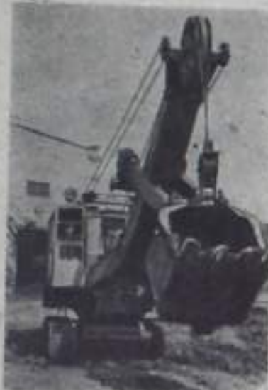
Работники Воронежского экскаваторного завода выполняют новую героическую кубу. Для народного хозяйства этой страны изготавливаются экскаваторные машины. Уже собраны три экскаватора.