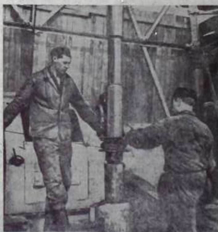
Чехословацкая Социалистическая Республика. Недавно на Южно-Моравском нефтяном промысле началось бурение новой скважины глубиной 4 тысячи метров.