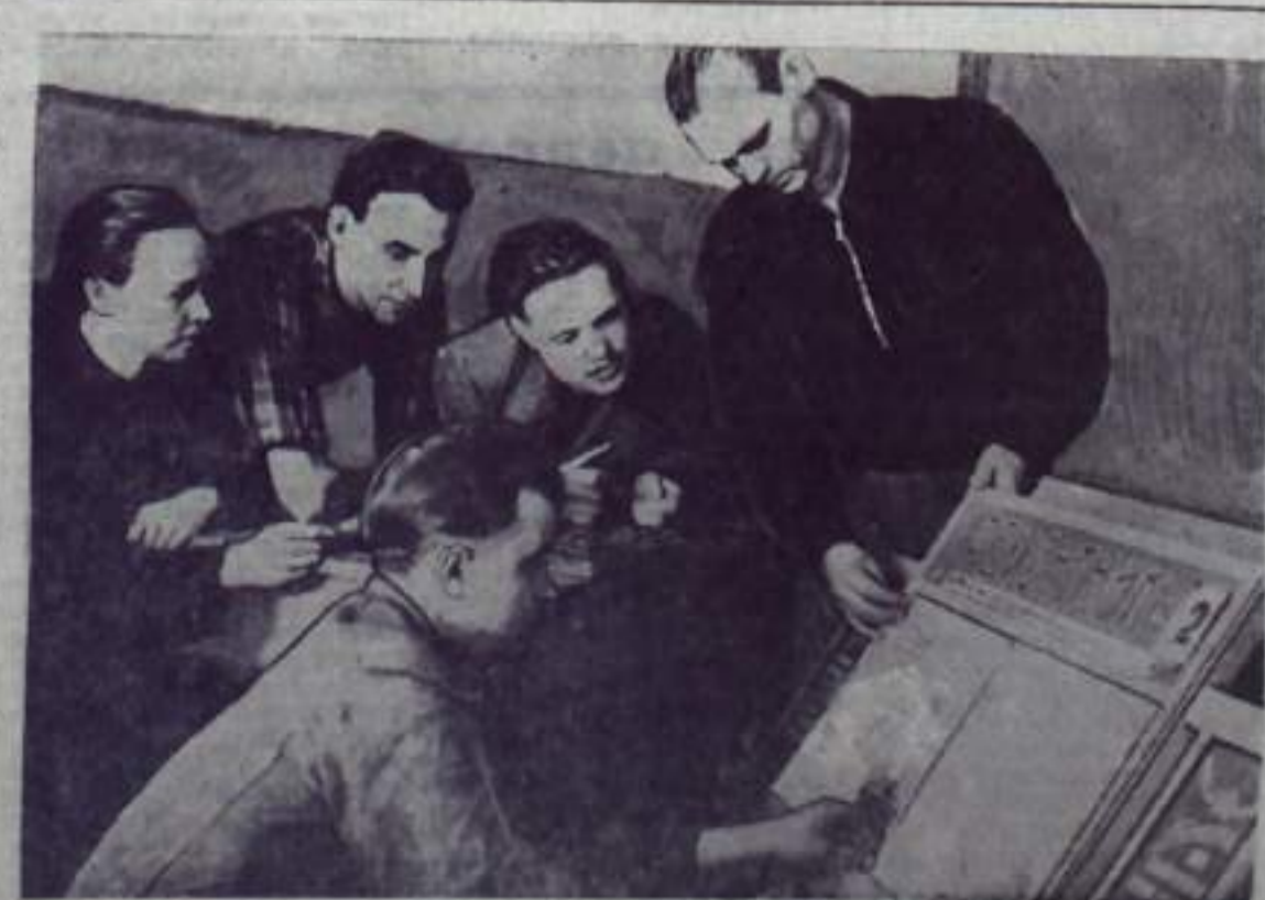
Редколлегия стеновой газеты «Ремонтник» за работой.

Редколлегия стеновой газеты «КОТЕЛЬЩИК» за работой.