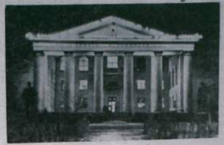
Дворец культуры угольщиков