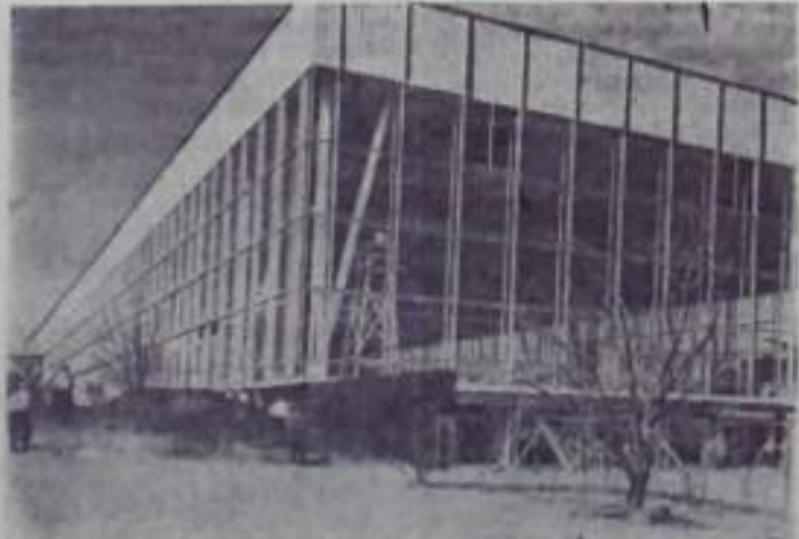
В Московском парке культуры и отдыха «Сокольники» заканчивается строительство большого выставочного павильона. Здесь будут устраиваться межгосударственные выставки, ярмарки, проводиться спортивные соревнования.