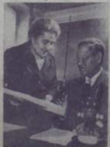
ЛЕНИНГРАД. На Всесоюзном научно-исследовательском институте защиты растений состоялся международный симпозиум по борьбе с сельскохозяйственными вредителями зерновых культур. В нем принимали участие специалисты из многих стран: Индия, Турция, Сирийской арабской РДР.

А ведь здесь, в литейном цехе, имеются неисчерпаемые возможности, большие резервы. Об этом свидетельствует такой факт. В апреле, например, сталевары сменное задание выполняли почти втрое больше. Нормы плана были занижены. Сейчас их пересмотрели. И сделали хорошо. Пора, давно пора объявить неприимую войну такому бесхозяйственности, расточительному расходованию необходимых материалов, электроэнергии. Тем самым коллектив литейного цеха может встретить XXII съезд Коммунистической партии хорошим трудовым подарком.