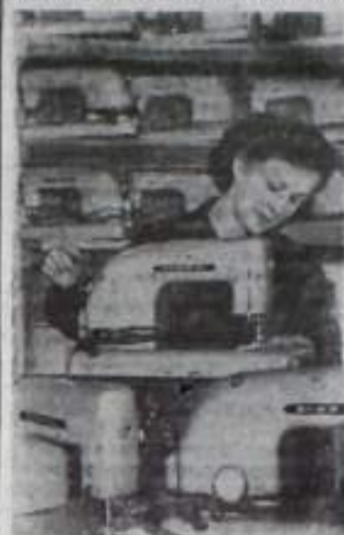
На Ржевском заводе электрических швейных машин в этом году началось массовое производство машин «Ржева» новой модели. Она выполняет две операции — шитье и вышивку и может быть использована как с ручным, так и с электрическим приводом.

Будет работать выставка-продажа тканей и готовых изделий, комната памятных встреч, где