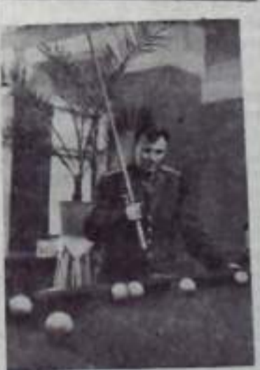
Ю. А. Гагарин через день после своего космического полета.

естественно, что для полета в космос стали подбирать людей физически здоровых, с устойчивой нервной системой и уравновешенной психикой, волевых, быстро ориентирующихся, находчивых, смелых и мужественных. Таких людей немало в нашей стране. На первое время они были отобраны по числу летчиков, у которых по характеру самой профессии наиболее полно сочетаются эти качества. Так была создана группа летчиков-космонавтов, которая прошла специальную тренировку и теоретическую подготовку.