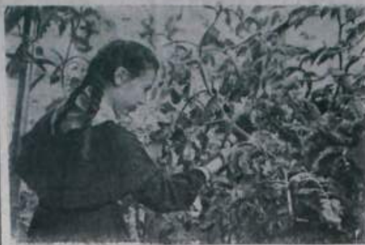
При многих школах города Норильска созданы живописные ботанические сады. Особенно хорош ботанический сад школы № 1. Здесь подвластными хозяевами являются юнаты. Они вырастили около 1,500 цветов и других декоративных растений.

Не представляется на выставке газеты школы №№ 3 и 4. Летом ребятишкам предстоит провести слайд детских корреспондентов, и члены редколлегии школьных газет решили хорошо наладить выпуск стеновой печати в каждой школе.