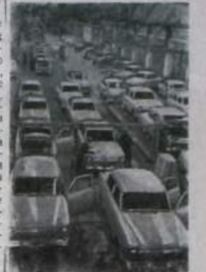
Коллектив Горьковского автомобильного завода достиг уровня производства легковых автомобилей и запасных частей, заплавленного на последний год семилетия.

Стремись достойно встретить XXII съезд КПСС, автомобильные работники борются за досрочное выполнение плана третьего года семилетия, за дальнейший рост производительности труда, снижение себестоимости и повышение качества продукции. Конструкторы завода создают образец легкового автомобиля «Волга» модели 1962 года, а также новые образцы грузовых автомобилей.