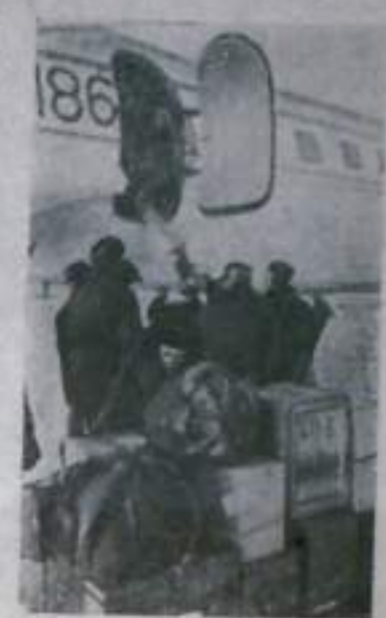
трассе Северного морского пути.

Эти работы имеют большое практическое значение. Данные, полученные после обработки материалов, позволят лучше познать природу суровой Арктики. Они будут использоваться при составлении прогноза погоды, помогут обеспечить безопасный путь кораблей по