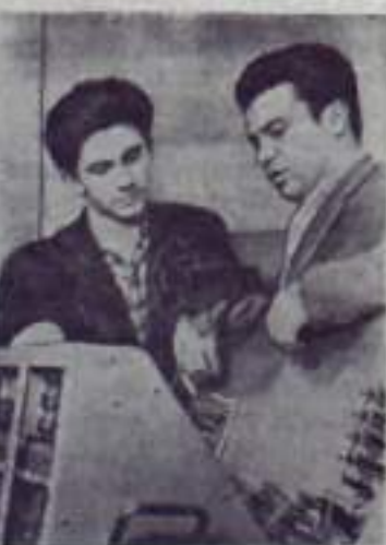
ГУРЬЕВ. В лаборатории нефтегазовой и телеметаллической лаборатории «Гипрогазнефть» изготавливается модель автоматизированного комплекса нуля для управления для нефтепромысла Косчалы. Внедрение этой техники облегчит труд добывающих нефти, даст большую экономию.