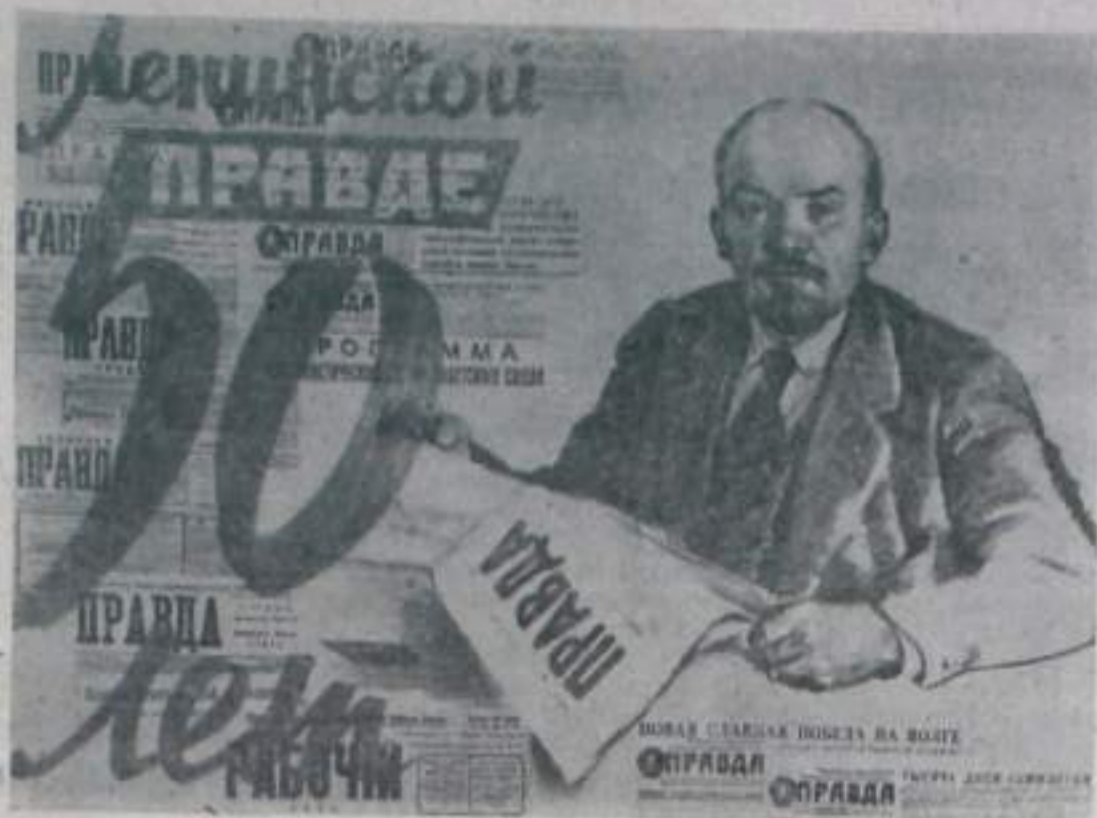
Плакат художника И. Гринштейна (ИЗОГИЗ).