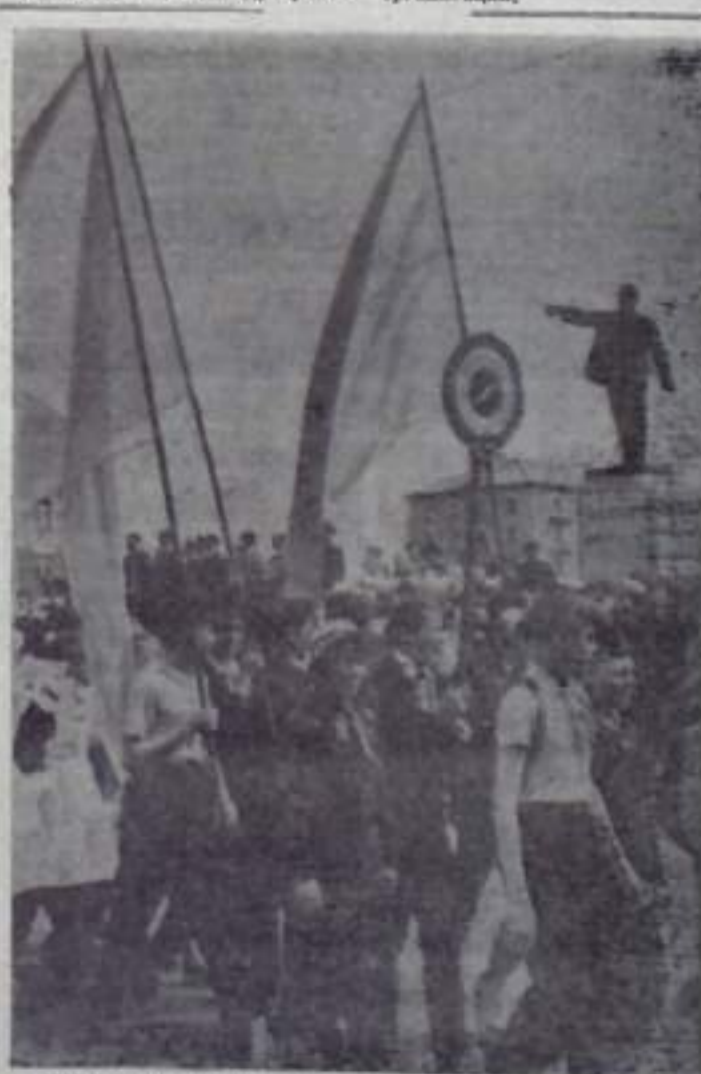
На первомайскую демонстрацию туристы вышли в полной походной готовности. Бодрым, веселым, жизнерадостным не страшны ни ветер, ни дождь, ни почва под открытым небом.

Торжественно и радостно проходит мимо трибуны коллектив брикетной фабрики. На транспаранте в колонне — трудовой рапорт. Трудящиеся предприятия выработали сверх четырехмесячного плана 23 тысячи тонн угольных брикетов. Вслед за брикетчиками идут коллективы погрузочно-транспортного управления, центральных электромеханических мастерских, ЖКО, орс, ТЭЦ, Кумертауского машзавода, строительных управлений, треста «Кумертаустрой», городских учреждений и организаций.