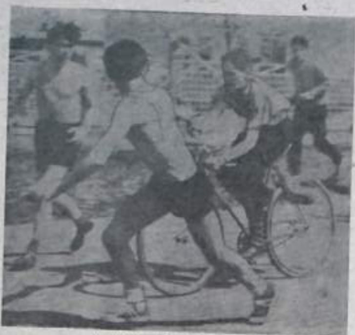
На дистанции эстафеты.

Командам — победительницам вручены Почетные грамоты газеты «Горняк», а спортсменам угольного разреза присужден переходящий кубок газеты «Горняк», учащимся старших классов школы-интерната имени Ю. А. Гагарина — переходящий кубок горкома ВЛКСМ.