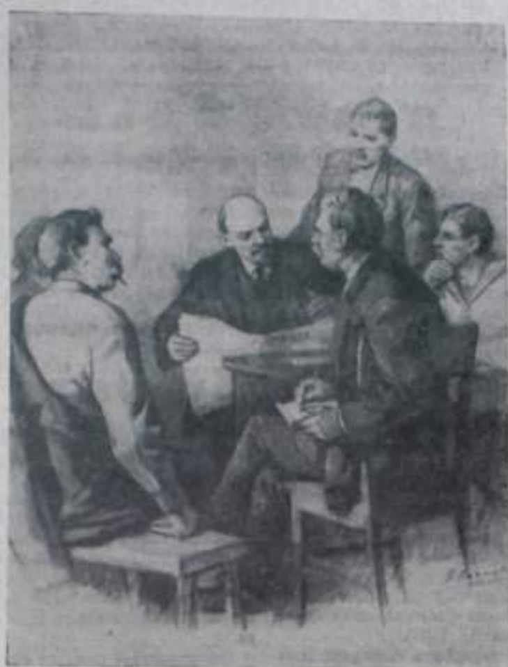
В. И. Ленин беседует с рабочими корреспондентами в редакции газеты «Правда». Рисунок заслуженного деятеля искусств РСФСР И. Васильева.