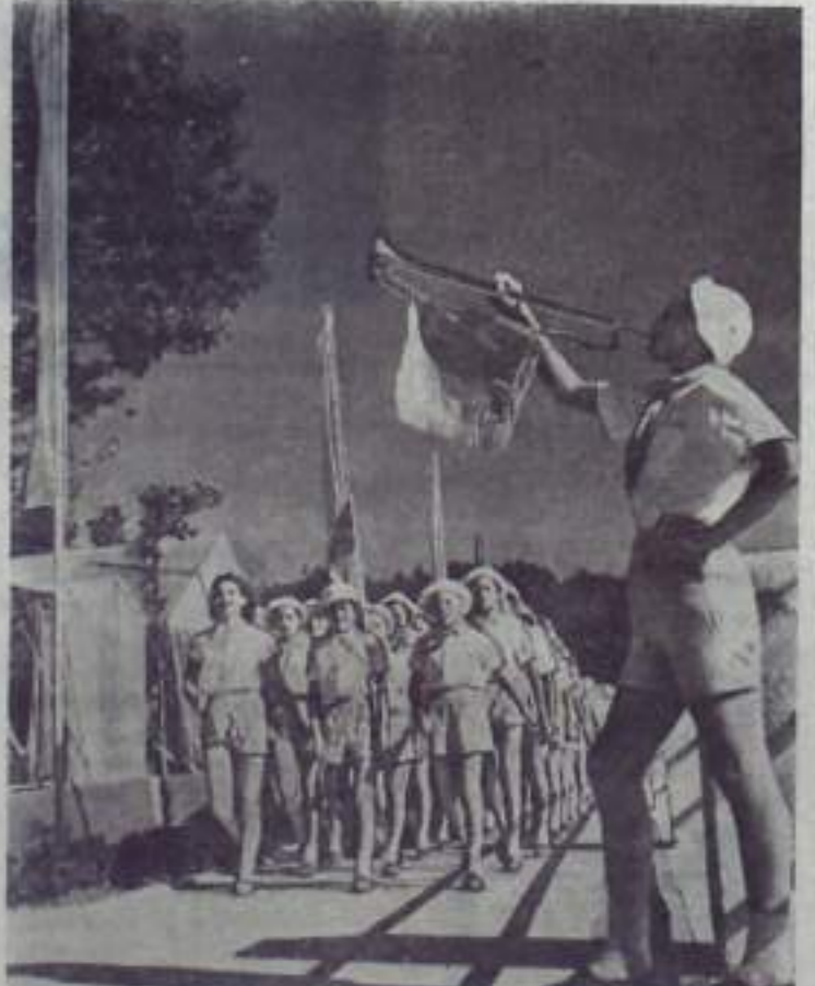
В пионерском лагере «Орленок» на Черноморском побережье Кавказа.