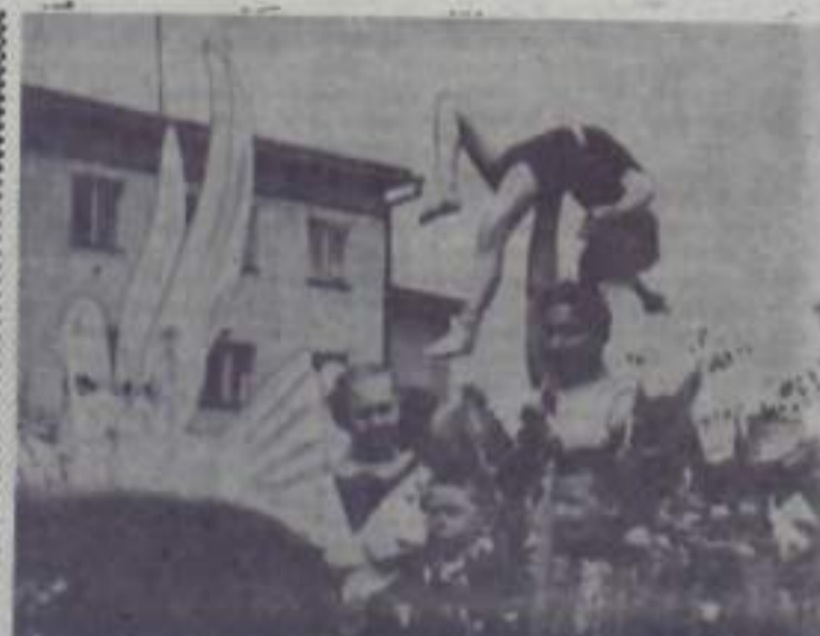
Грузовой автомобиль превращен в небольшую арену. Он выходит на площадь. Перед трибуной ловкие руки юности легко поднимают ястру акробатку.

«Правда», вся советская печать изо дня в день энергично борются за мир, дружбу и сотрудничество между народами, за мир и счастье на всей земле.