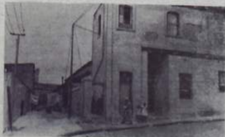
Южно-Африканская Республика. Кейптаун. В квартале дзвонных.

На снимке: резервуары из армоцемента.