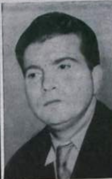
Пианист З. Г. Гилельс.