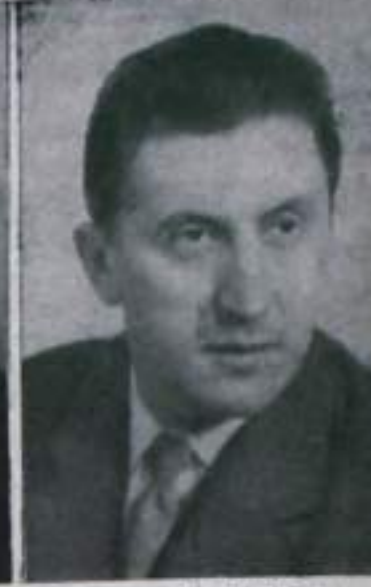
Скульптор Л. Е. Кербель.