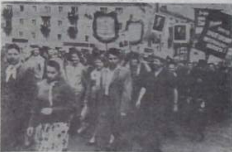
Михо трибуны проходят колонны демонстрантов.