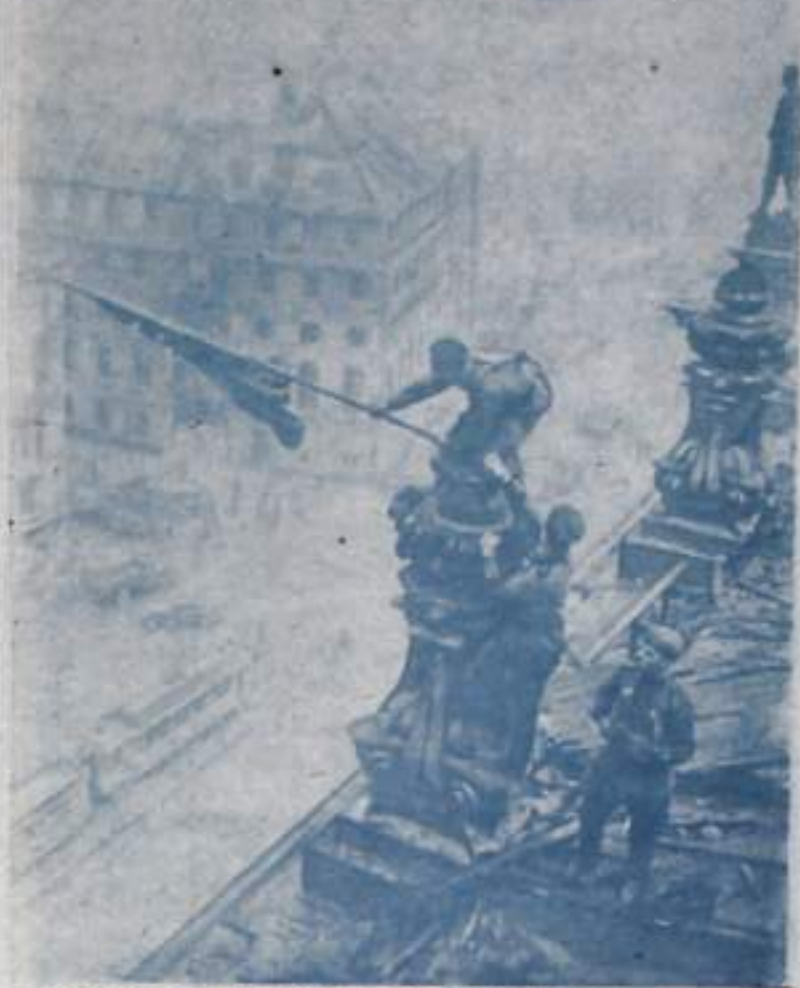
1945 год. Советский флаг над рейхстагом в Берлине.