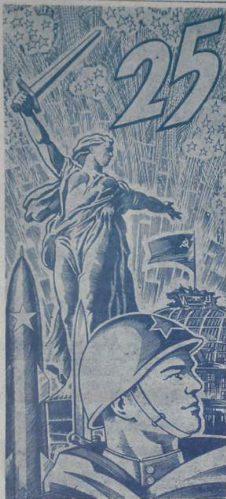
Плакат художника С. Гринько.