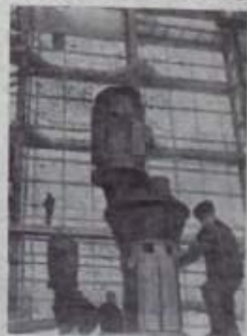
СТАВРОПОЛЬСКИЙ КРАЙ. Продолжает строиться Нелин-новский комбинат. Угнетем в семье и эксплуатации цех экстракционной фосфорной кислоты. Сейчас здесь идут проектно-монтажные работы.

НА СНИМКЕ — одна из производственных цехов фосфорной кислоты.