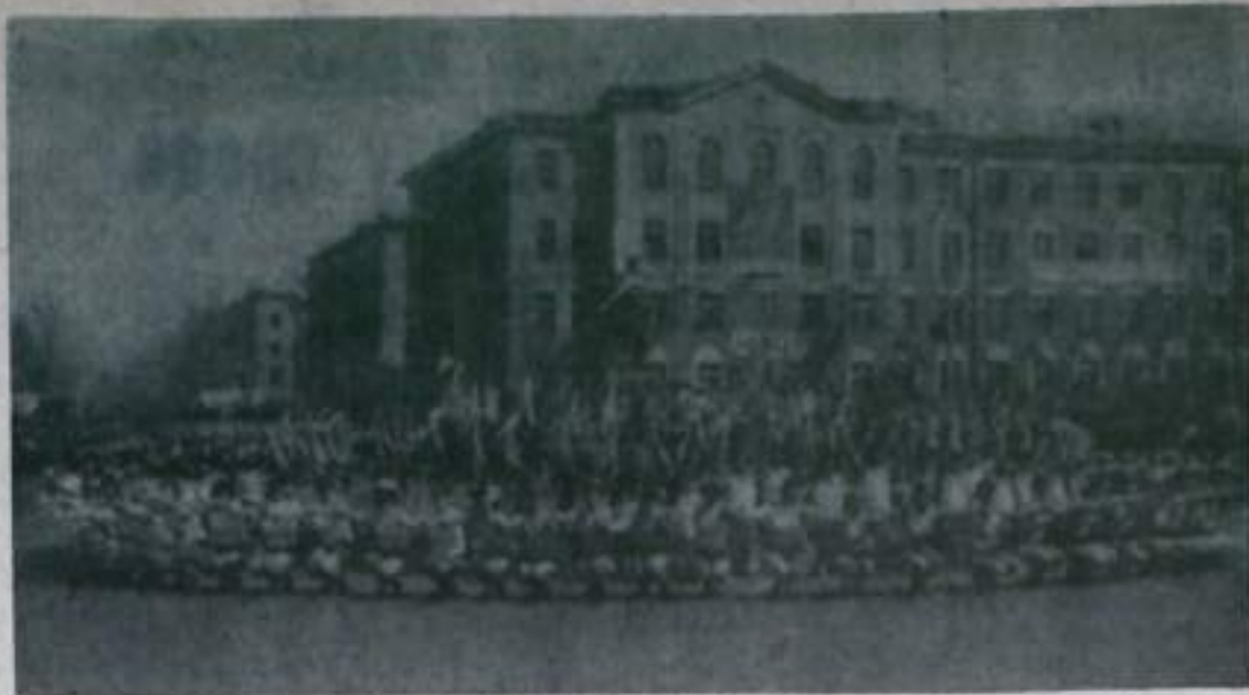
На снимке: спортсмены г. Кумертау на первомайской демонстрации.

По случаю первомайского праздника в сирийской столице Дамаске прошли многотысячные демонстрации. Затем был проведен митинг. Выступившие на нем ораторы сурово осудили прокси империализма на Ближнем Востоке, в Юго-Восточной Азии и Латинской Америке и призвали крепить единство всего прогрессивного человечества. День Первомай отметили также трудящиеся Испании, Швейцарии, Турции, Бельгии, Туниса, Перу, Ирака, Канады, Японии, Финляндии и многих других стран всех континентов. (ТАСС).