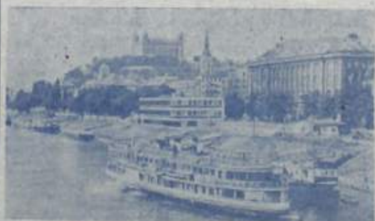
На снимке: набережная Дуная в Братиславе.

СЕГОДНЯ — 25 ЛЕТ СО ДНЯ ОСВОБОЖДЕНИЯ (1945) ЧЕХОСЛОВАКИИ ОТ ФАШИСТСКИХ ЗАХВАТЧИКОВ. НАЦИОНАЛЬНЫЙ ПРАЗДНИК НАРОДОВ ЧЕХОСЛОВАКИИ