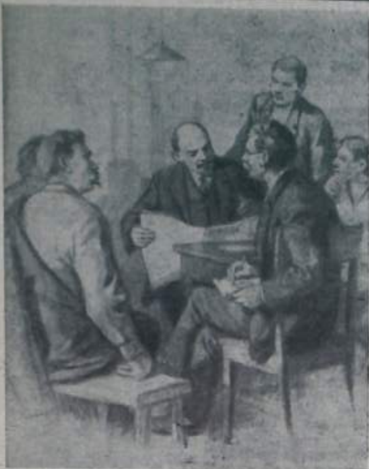
В. И. Ленин с рабочими корреспондентами в редакции газеты «Правда».