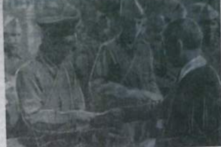
Игра «Зарница». Вручение пакета с боевым заданием.

нем приняли участие семь коллективов ДСО «Труд».