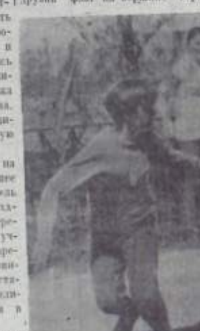
Передача эстафеты на этапе.

Снова по сигналу горня участники игры «Зарница» расходятся на специально назначенные места. Начинается игра. Четко и слаженно действуют отряды будущих воинов. По лучше всех все же были ребята и девочки из школы № 10. Они первыми заняли высоту, наголову опередив своих соперников. Вдрузья флаг на вершине горы.