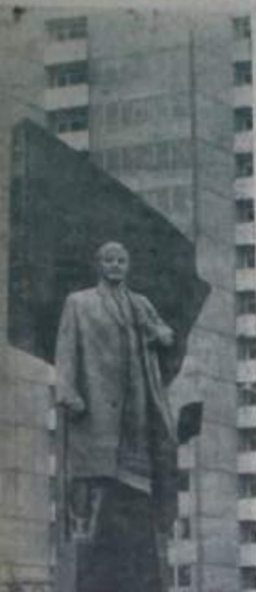
Берлин. Памятник Владимиру Ильичу Ленину был открыт недавно в столице ГДР. Он сооружен по проекту советского скульптора народного художника СССР Н. В. Томского.