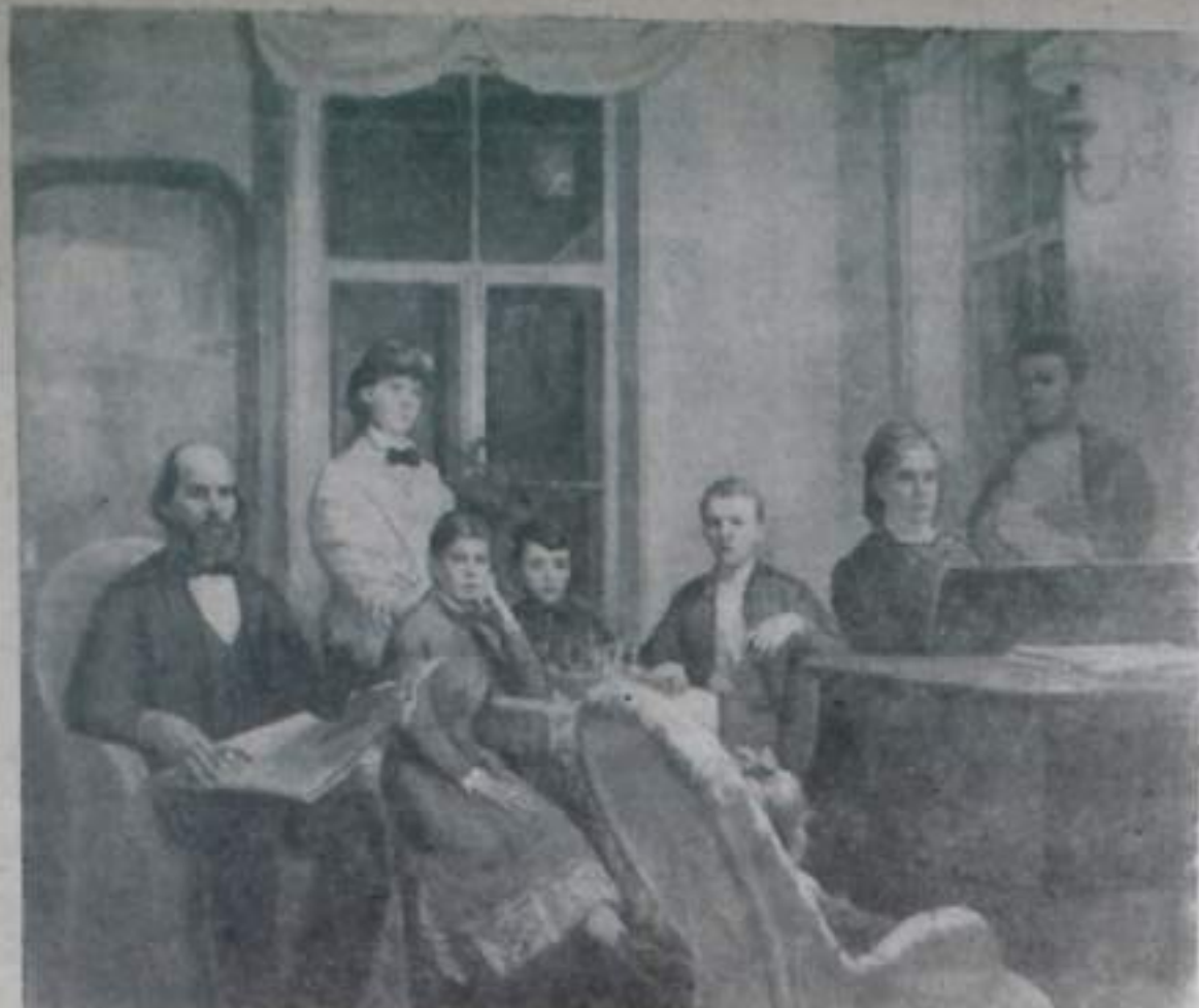
МОСКВА. Всесоюзная художественная выставка, посвященная 100-летию со дня рождения В. И. Ленина.