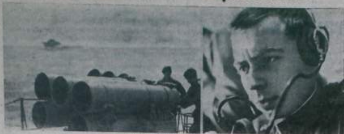
НА СУШЕ И НА МОРЕ

Зорно стерегут сухопутные и морские рубежи нашей Родины пограничники. Днем и ночью, зимой и летом, в любую погоду они выполняют свою нелегкую, но почетную задачу.