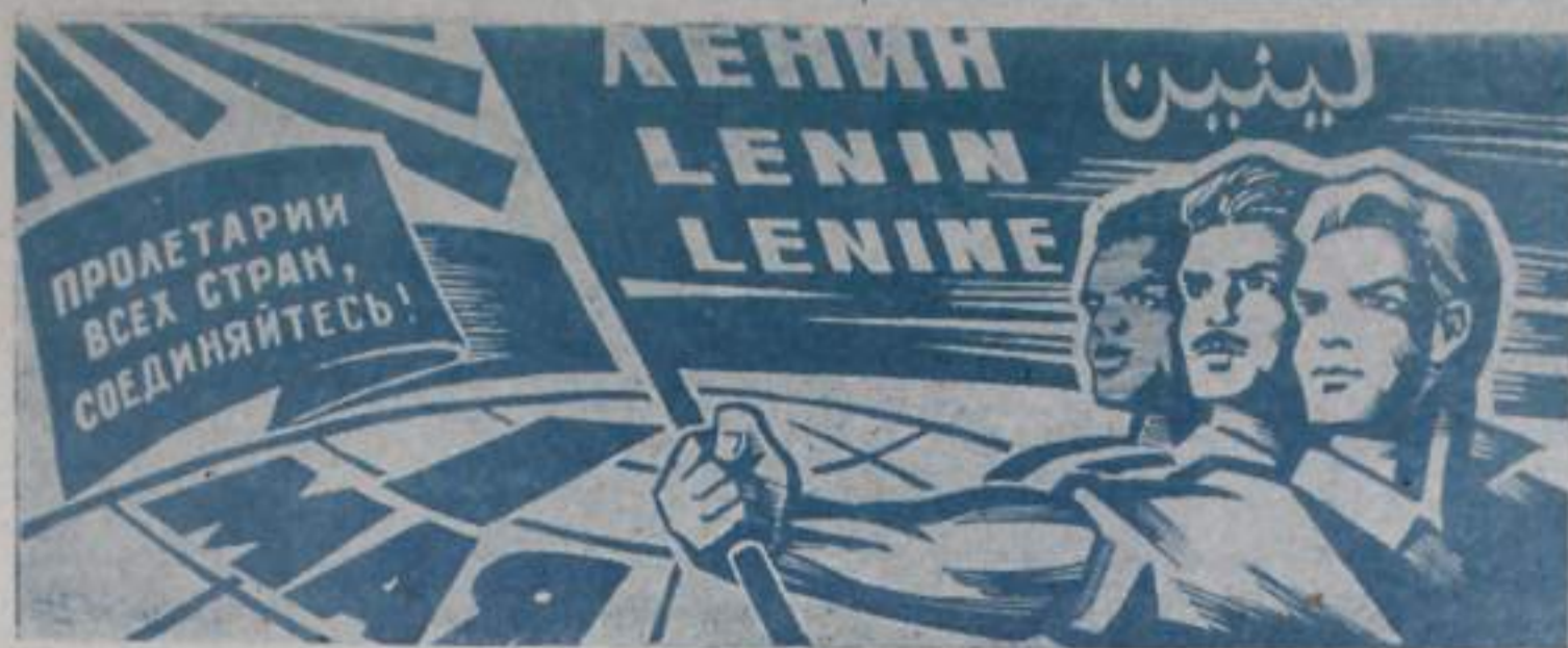
Пролетарии всех стран, соединяйтесь!