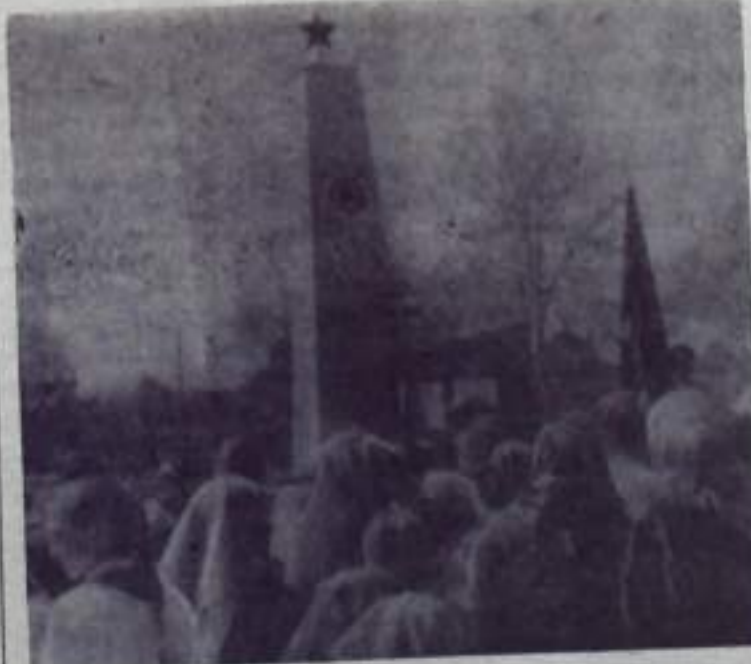
У обелиска погибшим воинам.