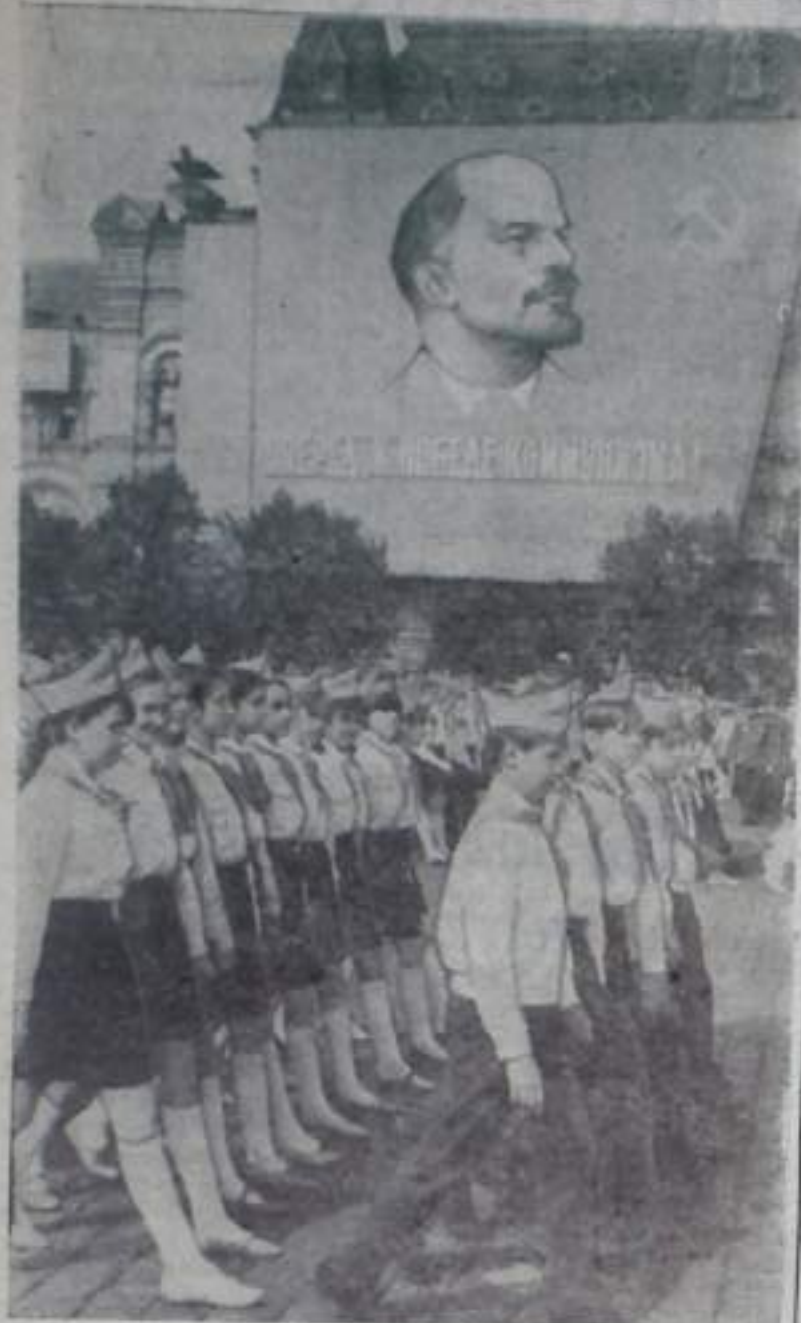
На снимке: парад юных ленинцев на Красной площади в Москве.