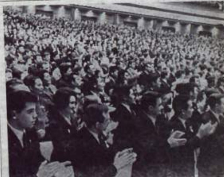
Москва. Крупным политическим событием для всей советской молодежи стал XVI съезд ВЛКСМ. На снимке: во время заседания в Кремлевском Дворце съездов.