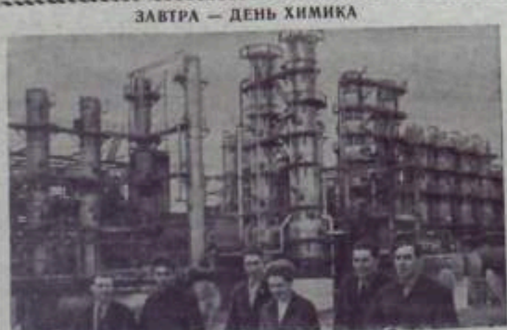
По выпуску химической продукции наша страна занимает второе место в мире. Увеличение объема производства химической продукции

Кумертауская типография управления по печати при Совете Министров БАССР.