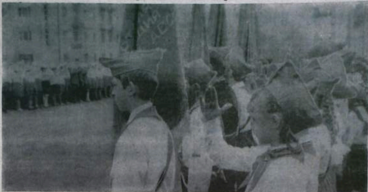
«В строй, пионеры, санкнитеесь тесней. Смотрят страна на своих сыновей. Будь же бесстрашен, честен и чист, Помни, ведь будущий ты коммунист. Этими словами была открыта торжественная линейка юных летчиков, посвященная Дню рождения пионерской организации имени В. И. Ленина. На ней лучшим дружиан были вручены грамоты по маршрутам марша «Всегда готовы», присвоенные

звание правофланговых новых пионерских отрядов. Здесь же, на площади Советов, ребята произнесли слова клятвы. Закончился праздник парадом пионерских дружин школ города.