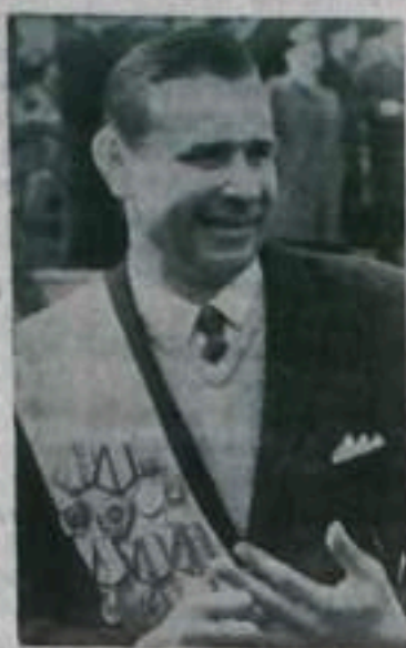
Сегодня в составе сборной клубов «Динамо» на футбольное поле Центрального стадиона имени В. И. Ленина в Москве и послед-

ний раз выйдет прославленный вратарь Лев Яшин. Прочувственный матч с командой «звезд» — сборной мира — признание его заслуг перед мировым футболом.