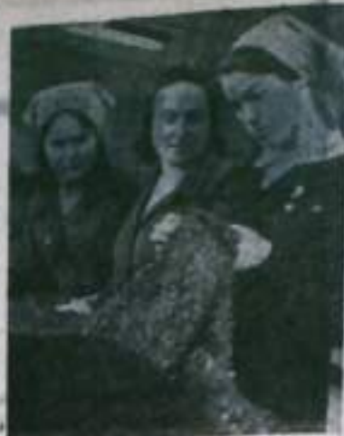
ВЛАДИМИРСКАЯ ОБЛАСТЬ. 16 групп и 29 папков народного контроля действуют на Александровском комбинате искусственных кож. В обязанности общественных контролеров входит регулярное проведение контрольных рейдов с целью проверки качества выпускаемой продукции, своевременной отладки оборудования и правильности его эксплуатации.

секретарь парткома треста «Кумертаустрой».