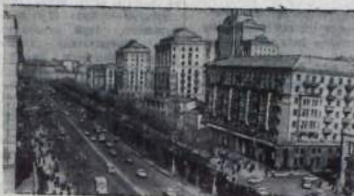
Киев — столица Украины. Центральная магистраль города — Крещатик.

(Из Постановления ЦК КПСС «О подготовке к 50-летию образования СССР».)