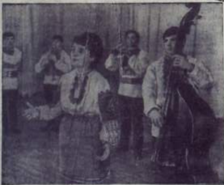
Около 150 рабочих и инженеров комбината «Прикарпатлес» (Ивано-Франковская область) участвуют в самодеятельном народном ансамбле песни и танца «Карпаты». Красочные костюмы, темперамент и мастерство исполнителей завоевали ансамблю любовь зрителей.

В настоящее время ансамбль «Карпаты» пополняет свой репертуар произведениями русских, украинских, белорусских и грузинских авторов.