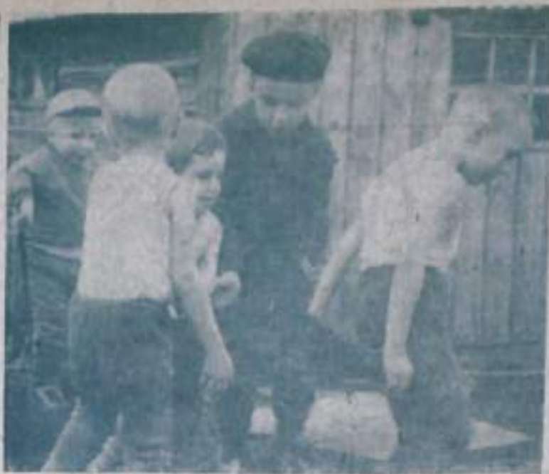
Мы тоже участвовали в субботнике...

Вторыми были волейболисты школы № 9. Третье призовое место — у представителей школы № 2. Наш корр.