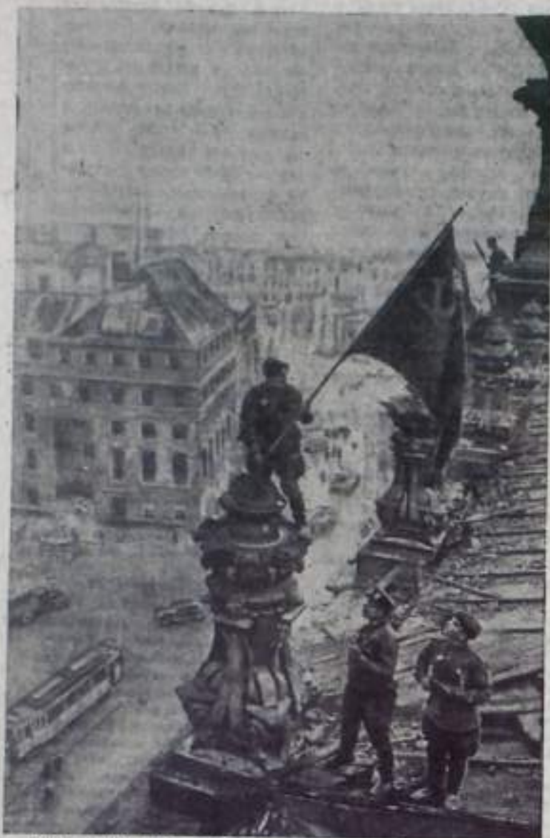
НА СНИМКЕ: 1945 год. Советский флаг над рейхстагом в Берлине.