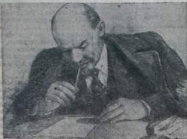
«В. И. Ленин за работой» — карандашный рисунок народного художника РСФСР П. В. Васильева.