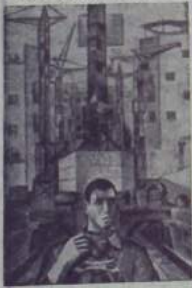
МОСКВА. В Центральном выставочном зале открыта выставка произведений живописи, графики, скульптуры, декоративно-прикладного и народного искусства художников Белоруссии и Молдавии.

— Ты, Иван, побудь со мной, выхотал меня этот бор. А ты, — кивнул он остальным, — идите по своим местам.