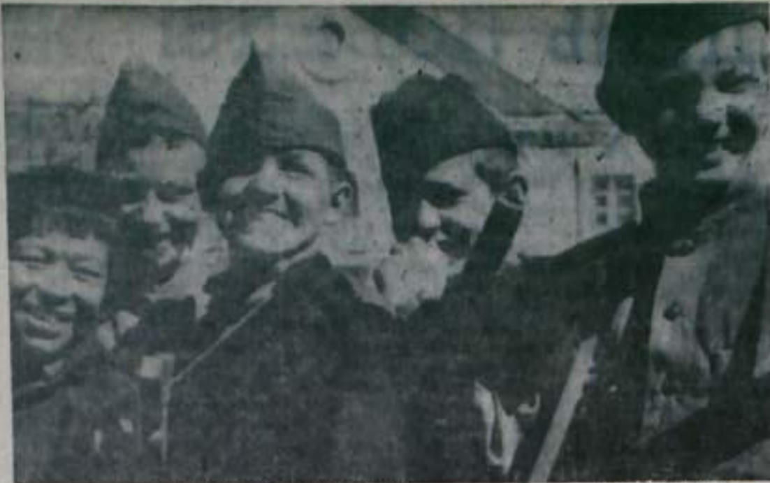
НАШЕ ДОЛГОЕ ВОЕННОЕ СЛАВЫ ОЦОВ И ДЕДОВ