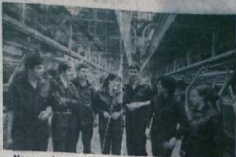
Москва. Автомобильный завод имени Ленинского комсомола увеличил свои производственные мощности. Недавно пущен новый автоматизированный сборочный комплекс.

Проектная мощность нового цеха позволит удвоить выпуск автомобилей «Москвич».