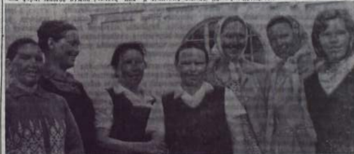
На снимке: группа участников совещания из колхоза «Радно».

Необходимо помнить, что от успешного проведения летнего пастбищного периода скота будет зависеть выполнение планов и заданий третьего, решающего года пятилетия.