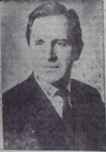
Джеймс ОЛДРИДЖ, писатель, общественный деятель (Англия)