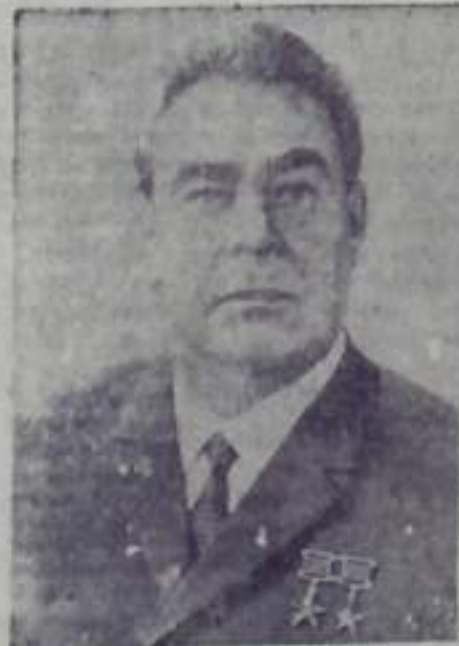
Леонид Ильич БРЕЖНЕВ, Генеральный секретарь ЦК КПСС