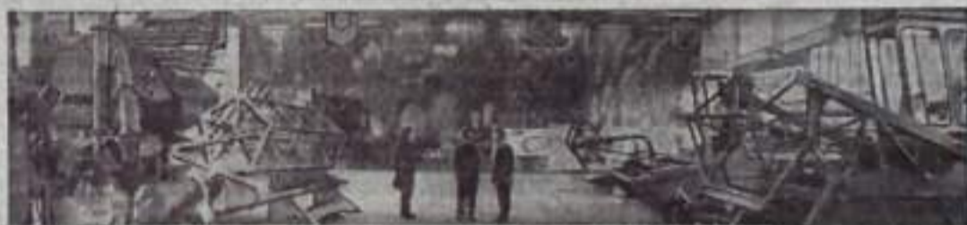
КУЙБЫШЕВСКАЯ ОБЛАСТЬ. На Куйбышевской машиностроительной станции построен новый демонстрационный павильон. Его площадь занимает две тысячи квадратных метров. В павильоне будет показываться новая отечественная и зарубежная сельскохозяйственная техника, поступающая из стран — членов СЭВ.

начальник районного агентства «Союзпечать».