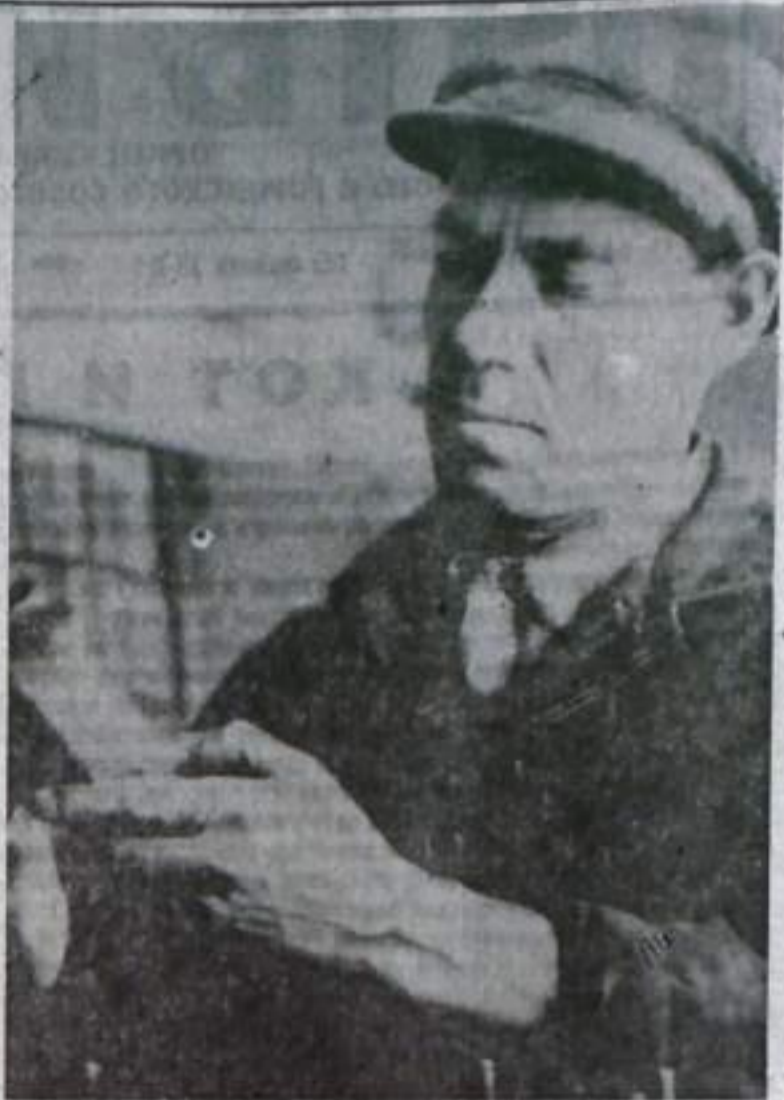
Фото и текст В. НЕЛЮБИНА.