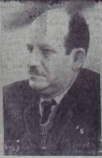
Эрика ПАСТОРИНО, председатель Всемирной Федерации профсоюзов (Уругвай)