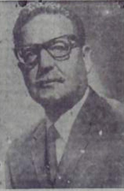
Сальвадор АЛЬЕНДЕ ГОССЕНС, Президент Республики Чили