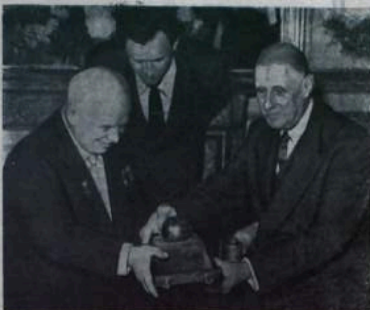
Председатель Совета Министров СССР Н. С. Хрущев в Париже. На снимке: Н. С. Хрущев в Елисейском дворце вручает Президенту Французской Республики Ш. де Голлю копия вымпела, доставленного на Луну советской космической ракетой. (Снимок принят по фототелеграфу).

После осмотра ленинской квартиры на улице Мари-Роз Н. С. Хрущев направился в Елисейский дворец, где между главами Советского правительства и президен-