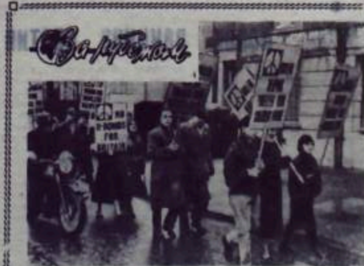
Лондон. Демонстрация протеста против производства ядерного оружия.

В сельскохозяйственных центрах по всей Италии прошли массовые митинги крестьян, которые требуют от правительства проведения реформ и защиты мелких крестьянских хозяйств. В частности крестьяне требуют демократического перераспределения ассигнованных правительством средств на развитие сельского хозяйства.