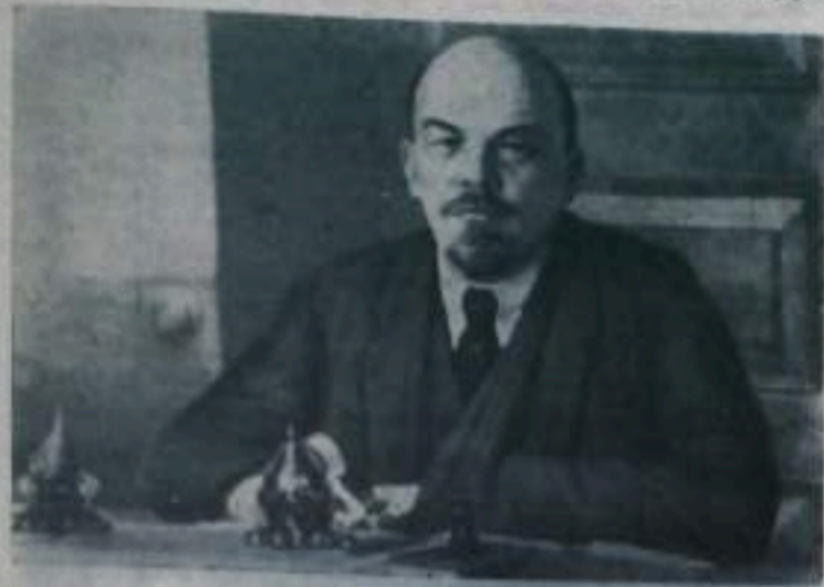
В. И. Ленин на первом заседании после ранения, 1918 год.

ИСТОРИЯ этого крупного московского предприятия тесно связана с Лениным. 30 августа 1918 года, в тяжелый период борьбы Советской республики с белогвардейской и иностранной интервенцией, Владимир Ильич приехал сюда, на бывший завод Михельсона, по призыву Московского комитета партии. Он выступил перед рабочими с речью на тему «Две власти (диктатура пролетариата и диктатура буржуазии)». Ленин страстно звал рабочих, «презрев все лицемерие, награды вывески и причитания разбойничьей буржуазии, творить свою революционную работу». С огромным энтузиазмом были встречены заключительные слова его вдохновенной речи: «У нас один выход: победа или смерть».