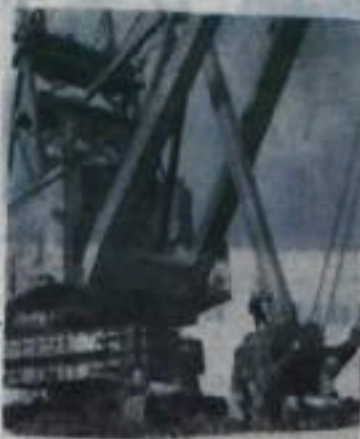
ИРКУТСКАЯ ОБЛАСТЬ. Огромное поле, на концы в концы прорезанные глубоким котлованом. По его углубленным бортам железнобетонные составы с арматурой и углем. Врезается в грунт многотонные мощные экскаваторы. Это Храмцовский угольный разрез треста «Черемшануголь», один из крупнейших в стране.

Париж, 24 марта. (ТАСС). Президент Французской Республики, генерал де Голль дал вчера вечером обед в честь Председателя Совета Министров СССР Н. С. Хрущева.