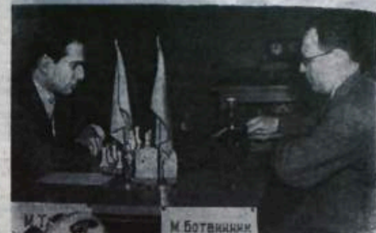
МОСКВА В Драгматическом театре имени А. С. Пушкина проходит матч на первенство мира по шахматам между чемпионом мира гроссмейстером М. Ботвинником и гроссмейстером М. Талем.

На снимке: за шахматной доской М. Ботвинник (справа) и М. Таль.