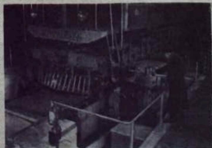
МОСКВА. В депо Москва-Саратовских железных дорог выданы в эксплуатацию первый на сети железных дорог автоматизированный измерительно-калибровочный станок типа КМ-20. Станок изготовлен на Крайтовском заводе тяжелого машиностроения и предназначен для обработки колесных пар без выкатки на колной локмотивной и моторвагонных секциях.

Специальные фасонные фрезы, установленные на станке, обеспечивают получение точного профиля на один оборот колесной пары без какой-либо подгонки над шаблоном.