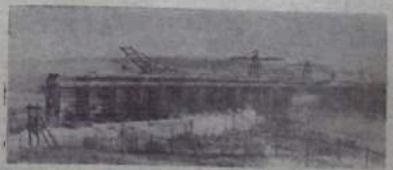
Строительство Братской ГЭС. Вид с мыса Пурсей.