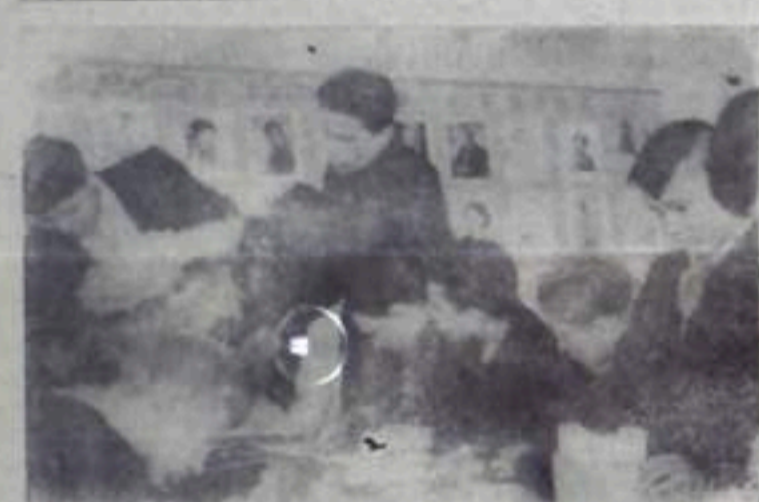
Большой популярностью пользуется у учащихся школы-интерната № 2 кружок художественного выпиливания. В нем выполняются около 30 изделий. В основном их работы идут на оформление и оборудование учебного корпуса, обшпоны.

Кружковцы изготовили красавцу доску для методического уголка, две стеллажа для инвентарной комнаты, выпилили 20 полонок под репродукторы, заголовки для сатирической газеты, стеллаж и многое другое.