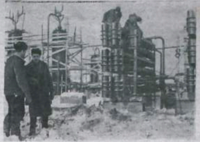
Кумертауский газоконденсатный промысел управления «Ишимбайнефтегаз» начал запиху газа в магистраль Кумертау—Магнитогорск. Домны и мартены Магнитки будут получать ежемесячно десятки миллионов кубических метров дешевого топлива.

День пуска газа в магистраль нефтяники Кумертау празднуют как день рождения своего промысла. Еще много пробуренных скважин предстоит подключить к этой линии. Мощности промысла значительно возрастает.