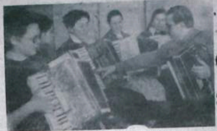
На снимке: занимается кружок аккордеонистов.