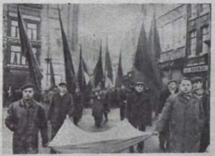
В Бельгии продолжается забастовочное движение в знак протеста против правительственного законопроекта, предусматривающего экономии за счет трудящихся. На снимке: демонстрация трудящихся в городе Монсе — одном из центров каменноугольного района страны. В развернутое знамя они собирают средства в пользу бастующих.

гнета капиталистов и помещиков. На днях провели однодневную забастовку 200 тысяч батраков Сицилии (Италия), требуя претворения в жизнь закона о социальном страховании. Положение крестьян особенно тяжелое в тех странах, экономика которых служит интересам империалистических держав. Малоземелье и безземелье большинства крестьян в ряде латиноамериканских стран, большая часть пахотной земли которых принадлежит крупным помещикам и иностранцам, — обычное явление. В Колумбии, например, более 500 тысяч крестьянских семей владеют лишь тремя процентами пахотной земли, в то время как в распоряжении 8 тысяч крупных помещиков находится 40 процентов всех земельных угодий. В стране насчитывается 500 тысяч бедных арендаторов. Процесс разорения фермеров и ухудшения положения сельских жителей характерен и для самой развитой страны капиталистического мира — США. Здесь насчитывается 2,3 миллиона сельскохозяйственных батраков, многие из которых — разорившиеся фермеры. Около 400 тысяч батраков постоянно косят по США в поисках работы. Д. КАСАТКИН.