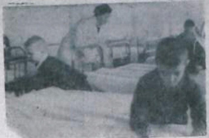
В то время, когда ребята второго корпуса уже моют полы, заканчивают уборку, малыши (они живут в первом корпусе) еще убирают постели. Пока это получается не так быстро, как у старшеклассников, но зато не менее аккуратно. Посмотрите, с каким старанием расправляют мальчики первого класса покрывала на своих кроватках! Участие в физическом труде приучает ребят следить за чистотой, уважать свой труд и труд своих товарищей. На снимке: первоклассники во время утренней уборки.