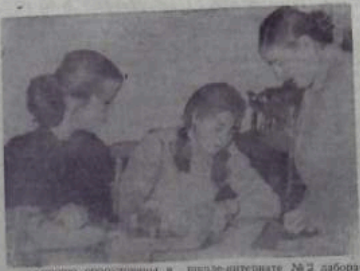
Хорошо оборудована в школе-интернате № 2 лаборатория для проведения уроков по химии, физике, биологии. На снимке: учащиеся проводят лабораторные работы по химии.