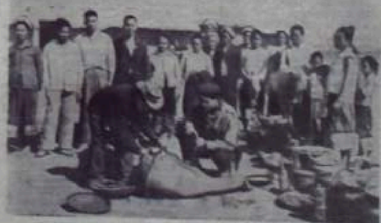
Раздача продуктов питания населению в долине Куаншон после освобождения ее правительственными войсками во взаимодействии с частями Патет-Лао.