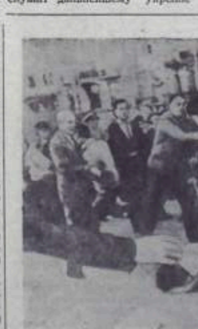
Уругвай. Как сообщает агентство Ассошиэтед Пресс, в столице страны Монтевидео на площади Независимости произошло столкновение сторонников и противников революции на Кубе.

Заседания Совета Безопасности, посвященные обсуждению положения в Конго, показали, кто враг и кто истинный друг народов Африки. О дружеских чувствах нашей страны к африканским народам свидетельствует и закончившаяся на днях поездка главы Советского государства Л. И. Брежнева по странам Африки.