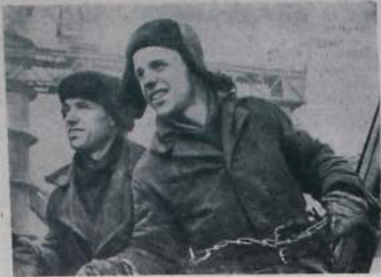
ТУЛА. Детские доменные плавильни — Новотульский завод реконструируется и расширяется. В течение семилетия он станет одним из крупнейших металлургических предприятий страны, оборудованным по последнему слову техники. Здесь строятся две доменные печи. Одна из них по своей технической оснащенности будет близнецом доменной, пущенной недавно в Кривом Роге.

На днях закончился монтаж воздухоподогревателя реконструируемой доменной. Работа выполнена досрочно.