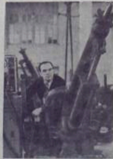
Кемеровская область. Всесоюзный научно-исследовательский институт «Гидроуголь» в гор. Сталинске ведет работы, направленные на развитие прогрессивного способа добычи угля — гидравлического.