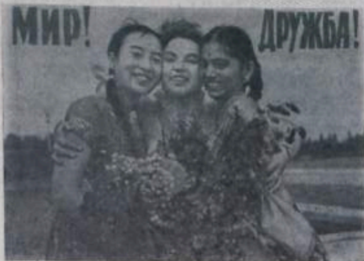
Плакат художника А. Устинова (ИЗОГИЗ).