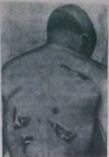
Фото на журнале «Фрайе вельд» (ГДР).