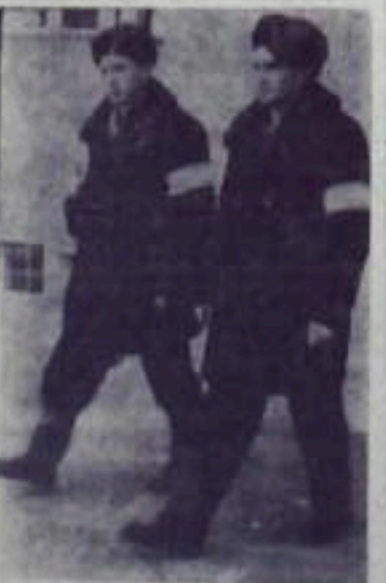
На охране порядка учащиеся техникума.

— Мы с радостью идем на дежурство, — говорят дружинницы. — Да это и понятно. Ведь делаем доброе дело.