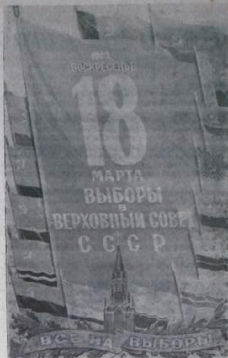
Плакат художника А. Антопченко (ИЗОГНЗ).