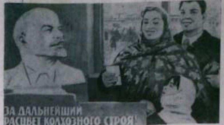
Плакат художника Э. Ардуяна (ИЗОГИЗ) Фотохроника ТАСС