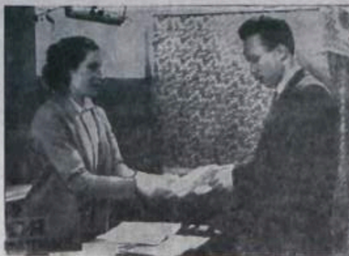
Выдача бюллетеней на Школьном избирательном участке.