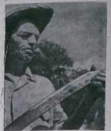
Крестьянин с мачете — ножом для резки сахарного тростника.