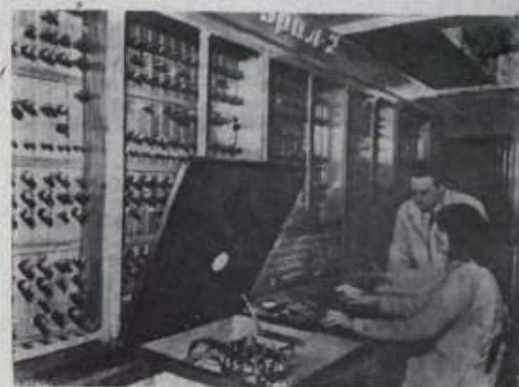
Чехословацкая Социалистическая Республика. В лаборатории транспорта и связи в Праге — Жижкове завершён монтаж советской электронной счётной машины «Урал-2». Она даст возможность достигнуть дальнейшего совершенствования транспорта, намеченного чехословацкой пятилеткой.

СОФИЯ. За последние годы благодаря широкому внедрению гибридных сортов кукурузы и улучшению агротехники производства кукурузы в Болгарии непрерывно увеличивается. В прошлом году, несмотря на неблагоприятные условия погоды, урожай кукурузы возрос примерно в два раза. (ТАСС).