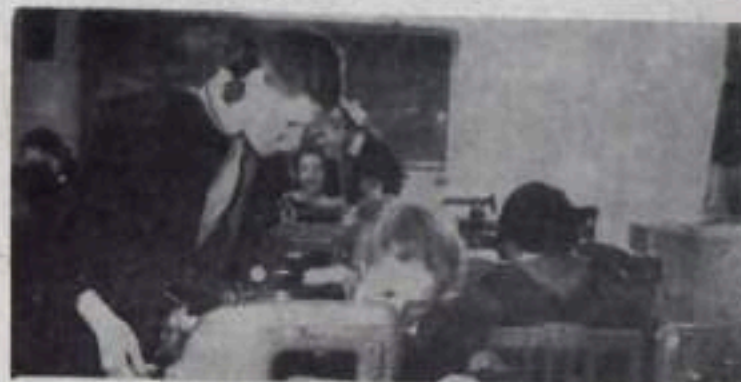
Девочки нашей школы с увлечением учатся шить, а некоторые уже научились. НА СНИМКЕ: в школьной швейной мастерской.