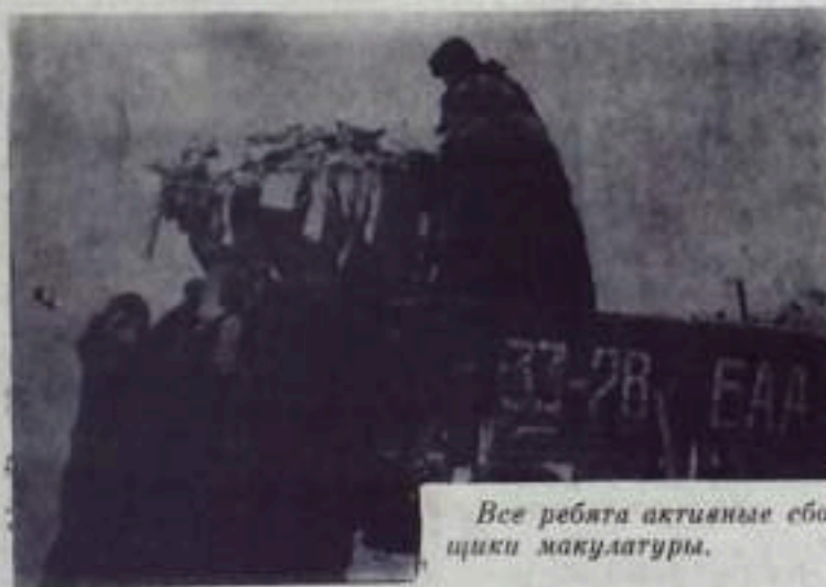
Все ребята активные сборщики макулатуры.