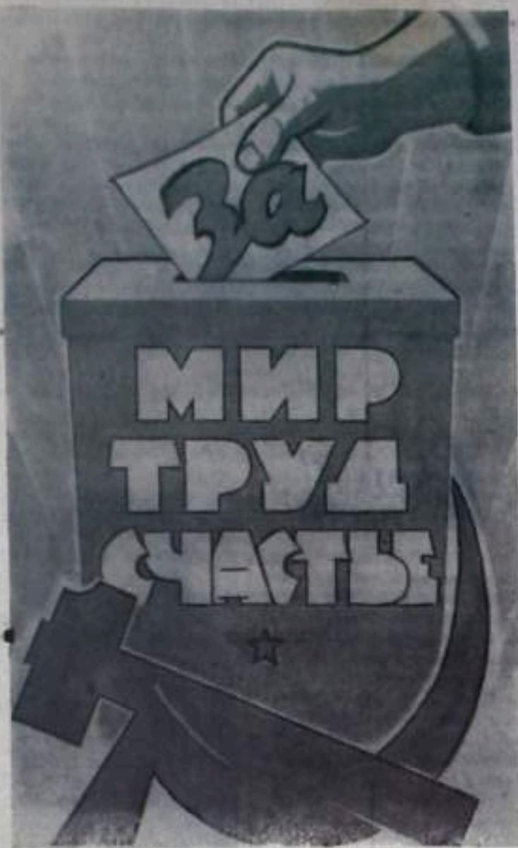
Плакат художника А. Лаврова (ВЗОГИЗ).

№ 35 (1312) ВОСКРЕСЕНЬЕ 18 МАРТА 1962 года Цена 2 коп.