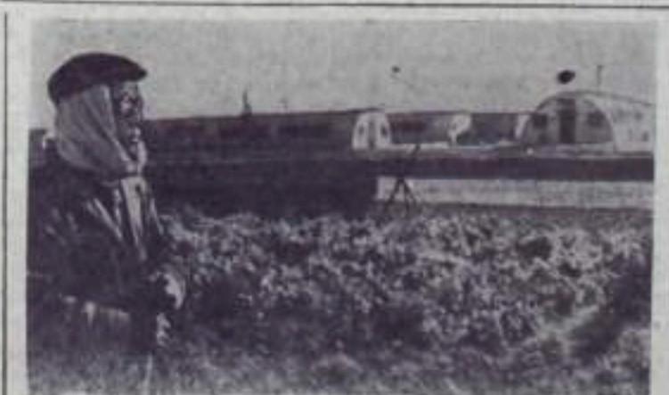
Японские острова покрыты густой сетью военно-морских и военно-воздушных баз США. Сейчас их насчитывается 250. Американская военщина чувствует себя хозяином в Японии, считая, что право на это ей дает японо-американский «договор безопасности». Шум самолетов, базирующихся на аэродромах морской авиации США, не дает возможности японцам нормально работать. НА СНИМКЕ: японский крестьянин около аэродрома в Ивакуна. Непрерывный грохот моторов американских реактивных самолетов заставил его закутать голову.