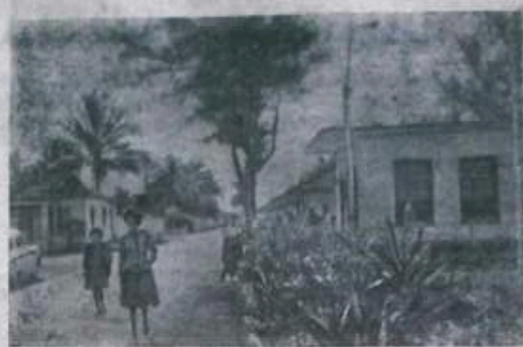
Новые жилые дома в народном имении имени Камило Сьенфуэгоса (провинция Матансас).