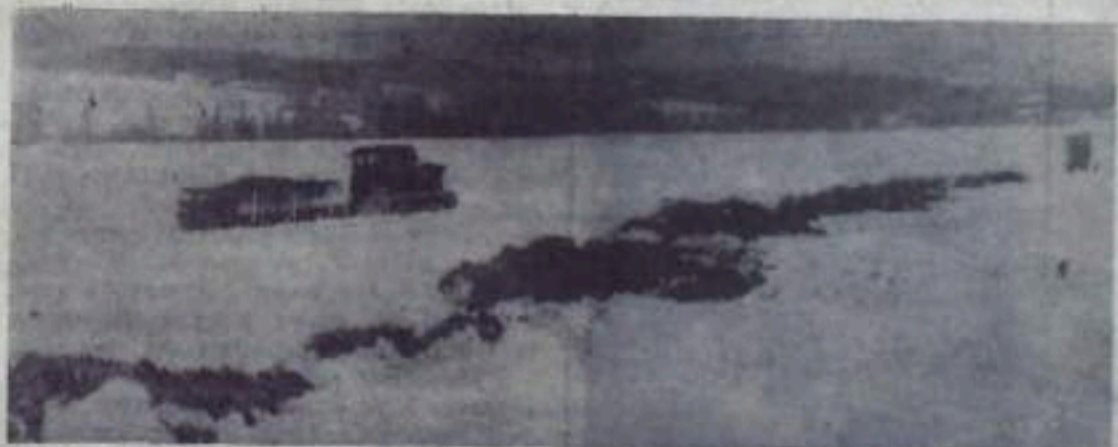
На снимке: вывозка навоза на поля в холмогорской бригаде колхоза имени Куйбышева.