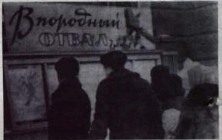
На снимке: У очередного номера сатирической газеты.

— Мы все, как львы, — твердят ребята, Но... не берутся за лопаты.