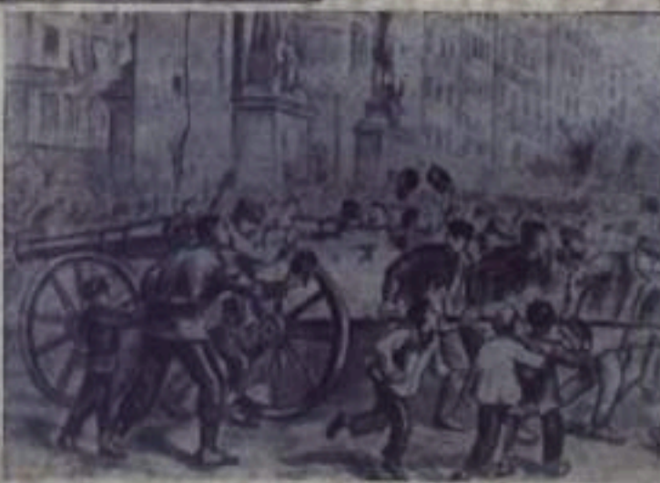
Рабочие Парижа увозят пушки на Монмартр 27 февраля 1871 года. Фотохроника ТАСС.

Славное знамя Парижской Коммуны, героический пример коммунаров в наши дни повсюду вдохновляют борцов за дело свободы, демократии и социализма.