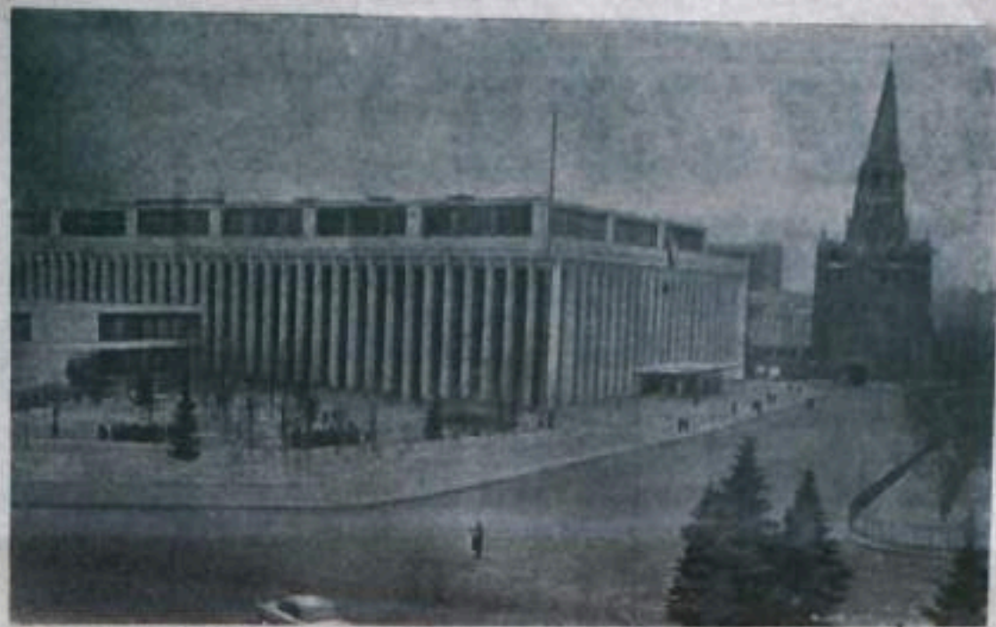
Москва. Кремлевский Дворец съездов. Здесь вчера начал свою работу XXIII съезд КПСС.

«ПУТЬ ИЛЬИЧА». 2 стр. 30 марта 1966 года.