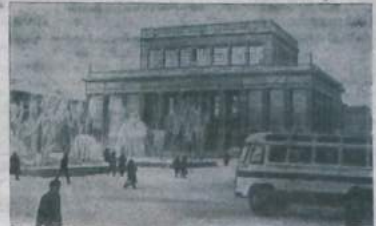
КОМИ АССР. Воруха. Дворец культуры шахтеров.