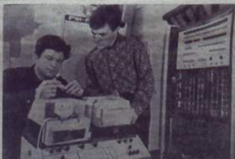
ЛУГАНСКАЯ ОБЛАСТЬ. На шахте «Луганская - Северная»