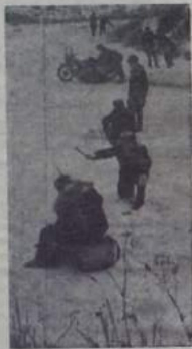
БЕЛОВО (КЕМЕРОВСКАЯ ОБЛАСТЬ). Сибирская речка Иня — любимое место отдыха горняков шахты «Чергинская-1».

23—24 марта 1968 года на колхозном рынке города Кумертау проводится весенняя ярмарка. На ярмарку приглашаются торговые организации района с товарами, колхозы, колхозники и рабочие совхозов с сельскохозяйственными продуктами. ОРС комбината «Башкирголь».