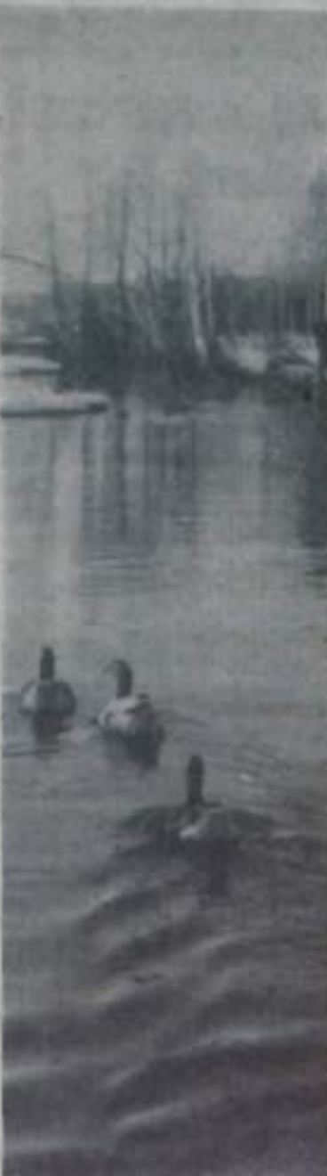
Природа, притерпела солнцем, в снегах открывает оконца, и снова, как песенный валет, весенняя сказка идет...

Управление пожарной охраны МВД Башкирской АССР.