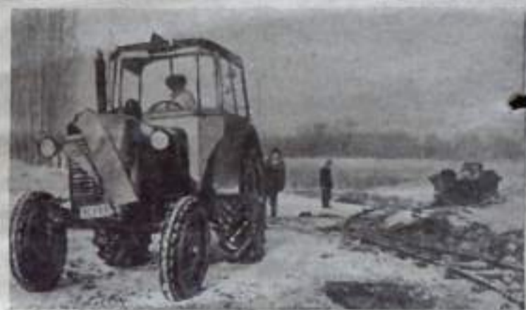
Работники госхоза в Фельдбаде (область Пешт) уже сейчас ведут подготовку к сбору богатого урожая. Для повышения пло-

дородия в местных песчаных почвах вносятся торф.