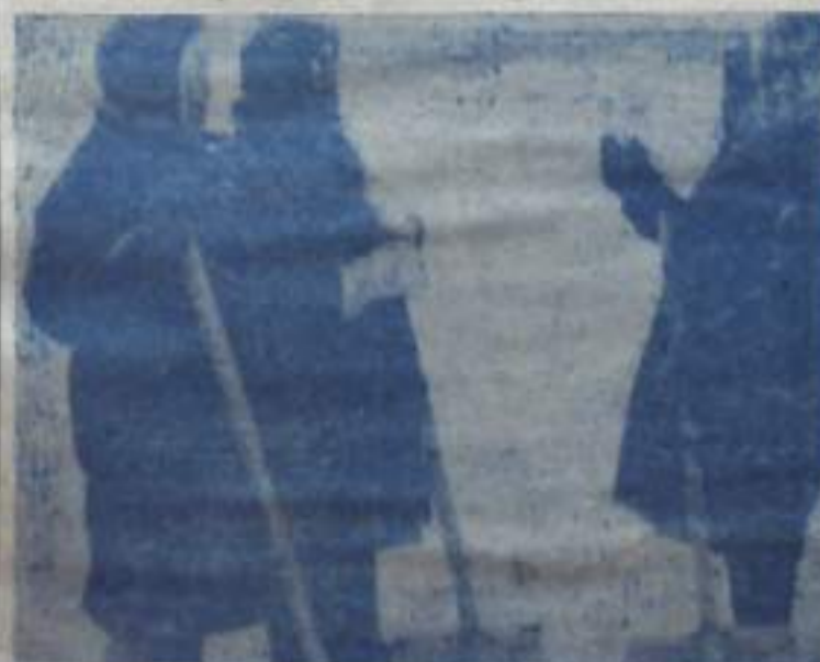
Хорошо трудятся а этом домоуправлении многие дворники-женщины. Особенно они выделяли на дворах новых домов 2600 корней деревьев а кустарников. А вынесенной многоснежной зимой содержат дороги а проездам в состоянии.