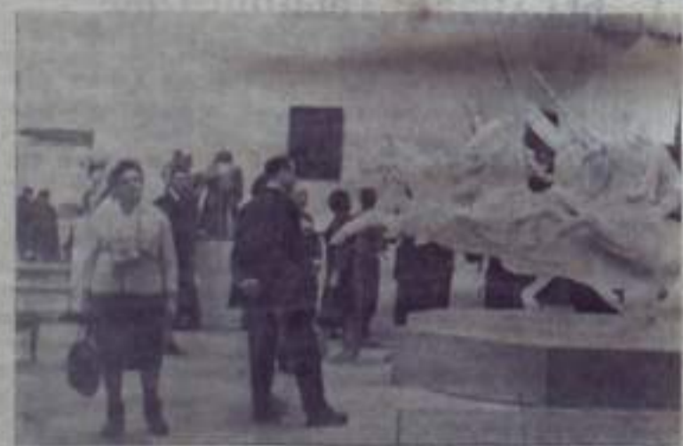
МОСКВА. В Центральном выставочном зале открыта Всесоюзная юбилейная художественная выставка «На стра-

же Родины», посвященная 50-летию Вооруженных Сил СССР. НА СНИМКЕ: посетители осматривают выставку.