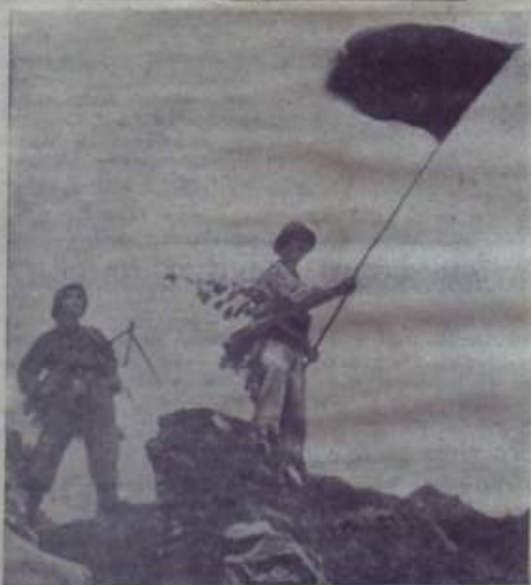
Южный Вьетнам. Успешно завершена одна из атак бойцов Ланг в освобождении на позиции американской морской пехоты. Над вражеским редутом поднимается флаг Национального фронта освобождения Южного Вьетнама.