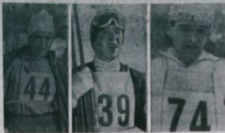
На соревнованиях по лыжному спорту в городе Штрбск-Плессе (Чехословакия) эти советские спортсмены стали чемпионами пара. ГАЛИНА КУЛАКОВА выиграла гонку на 5 км с результатом 18 мин. 07,89 сек. ГАРРИ НАПАЛКОВ и соотечественник на среднем трамплине прыгнул на 78,5 и 84 метра, заняв первое место. ВЯЧЕСЛАВ ВЕДЕНИН (справа) был первым в гонке на 30 км. Его результат — 1 час 39 мин. 48 сек.