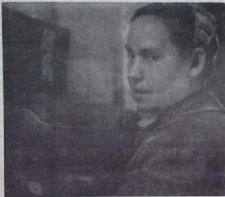
Коллектив Ермолаевского отделения связи небольшой, но объем работы у него солидный. Ведь кроме обработки и доставки почтовой корреспонденции, работникам отделения приходится поддерживать постоянную телефонную связь с населенными пунктами всего района.

«ПУТЬ ИЛЬИЧА» 3 стр. 14 марта 1970 года.