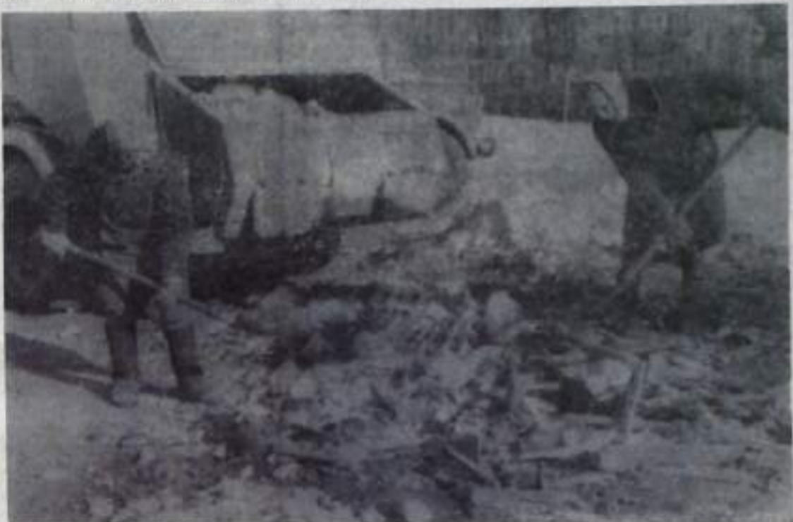
На снимке вы видите женщину-дворниц, которые ликвидируют мусорную свалку на улице Пушкина. Свалка образовалась за ночь. Это результат бессовестной «деятельности» тех жильцов, которым лень вставать рано, к приходу мусоровоза. Справедливо было бы заставлять саму себя и не мешать убирать выброшенный ими хлам. Ведь таких свалок в городе немало.

— Зачем дымите? — А чем плохо? Нам один детский врач сказал, что это едкий дым дезинфицирует окрестность, меньше летит по ветру дрипных бумажек на территорию детского сада. Бумажный хлам можно хоть сжечь. Но жильцы выбрасывают