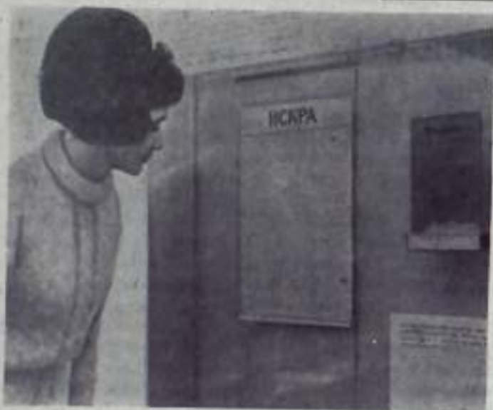
У одного из стендов музея В. И. Ленина в Праге. Сейчас, в дни подготовки к 100-летию со дня рождения вождя мирового рабочего движения, экспозиция музея пополняется материалами. Большую помощь оказывают институты международного рабочего движения многих стран мира. Посетители высоко оценивают научную, публицистическую и пропагандистскую деятельность коллектива музея.