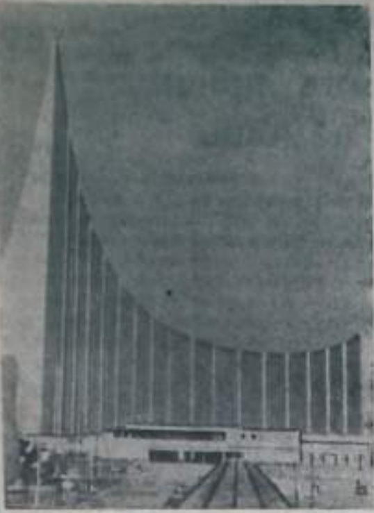
На снимке: общий вид советского павильона на Всемирной выставке «ЭКСПО-70» 109-метровое бело-красное здание павильона увенчано серпом и молотом. Объем его составляет 200 тысяч кубических метров. На «ЭКСПО-70» Советский Союз демонстрирует успехи в развитии науки и техники, достигну-