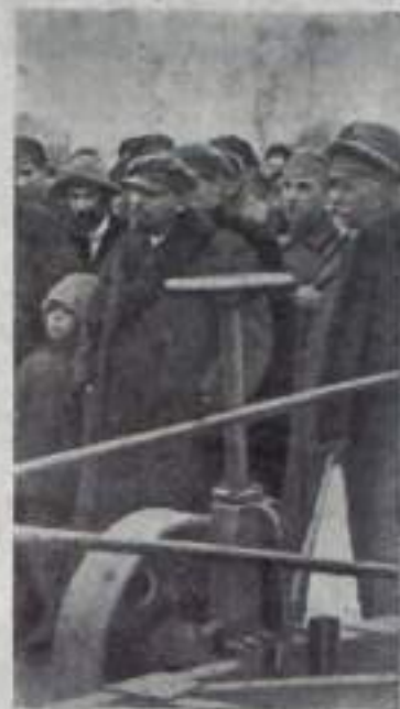
На снимках (слева направо) сверху: В. И. Ленин на X Всероссийской конференции РКП(б) в мае 1921 г.