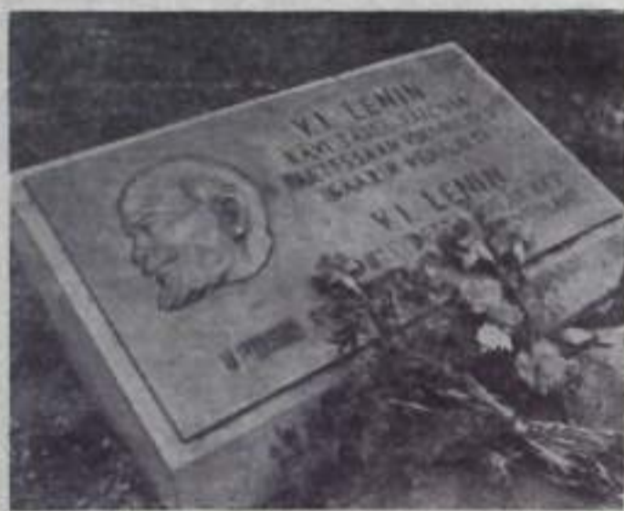
Мемориальная табличка в городе Турку у дома № 15 на улице Ауракури установлена мемориальная табличка с надписью: «В. И. Ленин посетил этот дом в 1907 году во время эмиграции из царской России».