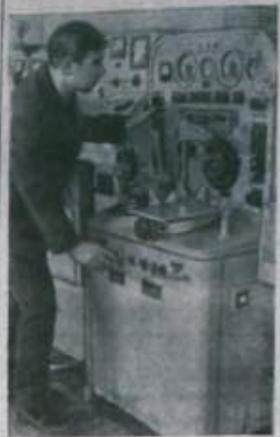
МОСКВА В павильон «Машиноремонтная мастерская ВДНХ СССР» поступил новый изобретение — универсальный колесо-ролино-испытательный стенд «СН-968» для проверки авто-тракторного электрооборудования, изготовленный на Ростовском опытно-механическом заводе объединения «Росгазкоптехника». Этот стенд, предназначенный для испытания и регулировки всего электрооборудования машин — от генератора до звукового сигнала, дает возможность не только значительно повысить производительность труда, но, главное, обнаруживать такие дефекты, которые зачастую оставались незамеченными при прежних способах проверки.

Открыть в газетах специальную рубрику, в которой постоянно публиковать показатели работы передовых колхозов, совхозов, ферм, доярок и скотников республики.