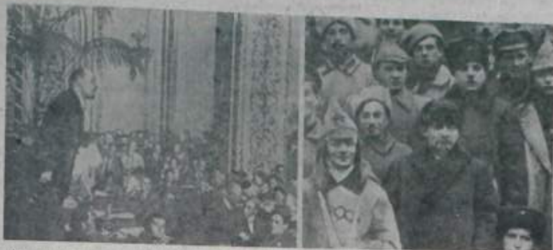
На снимках (слева направо): В. И. Ленин произносит речь на заседании III конгресса Колхозтерма в Амурском зале Кремля, Москва, июль-август 1921 года; В. И. Ленин и К. Е. Ворошилов