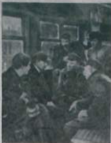
На киностудии «Мосфильм» заканчивается работа над цветным широкоэкраным фильмом «Кремлевские куранты», созданным на основе отношения народного хозяйства Советской республики на основе электрификации.