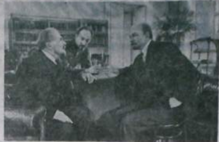
В заключительных кадрах фильма мы видим обновленную, заново электрическим светом страну, о которой мечтал В. И. Ленин.