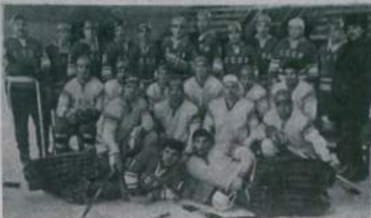
С 14 по 30 марта в Швеции пройдет чемпионат мира по хоккею с шайбой.