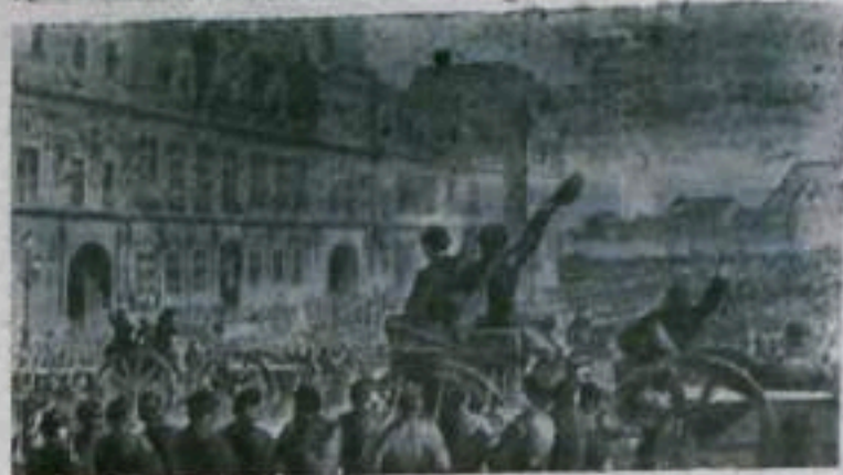
«Провозглашение Коммуны на площади перед Ратушей». (Рисунок из фондов Музея К. Маркса и Ф. Энгельса).