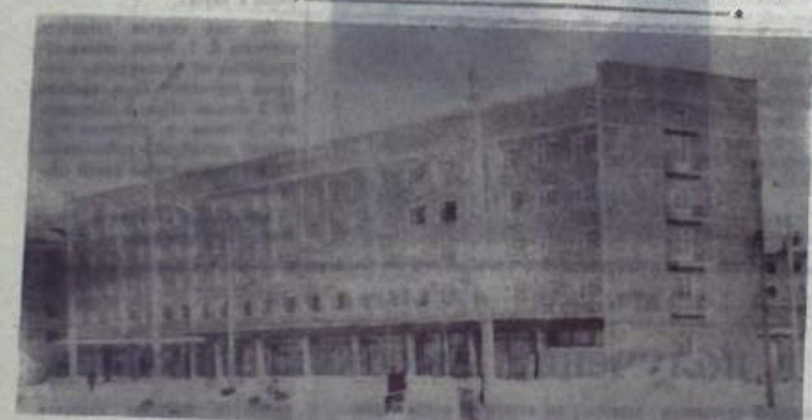
Здание новой гостиницы «Кумертау», открытой на днях в нашем городе.

Пользуйтесь услугами гостиницы! Управление коммунального хозяйства.