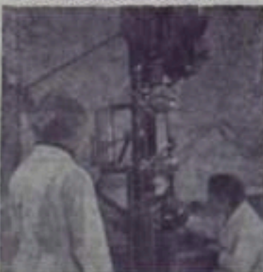
Испытание скани на разрыв для парашюта спускаемого аппарата автоматической межпланетной станции «Венера-7». (Кадр из цветного научно-популярного фильма «К планете загадок» производства студии «Центрвузфильм».)

От редакции. Случай беспрецедентный. Редакция надеется, что корреспонденция товарища Чернева будет серьезно обсуждена в коллективе треста «Кумертаумрайгаз». Администрация, партийная и профсоюзная организации накажут со всей строгостью виновных и примут меры к недопущению подобных случаев впредь. Тем более, что факты, о которых идет речь, явление в горгазе не редкое.