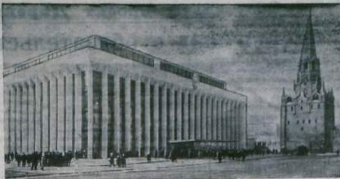
МОСКВА. Кремлевский Дворец съездов. 30 марта в этом здании начнет свою работу XXIV съезд КПСС.