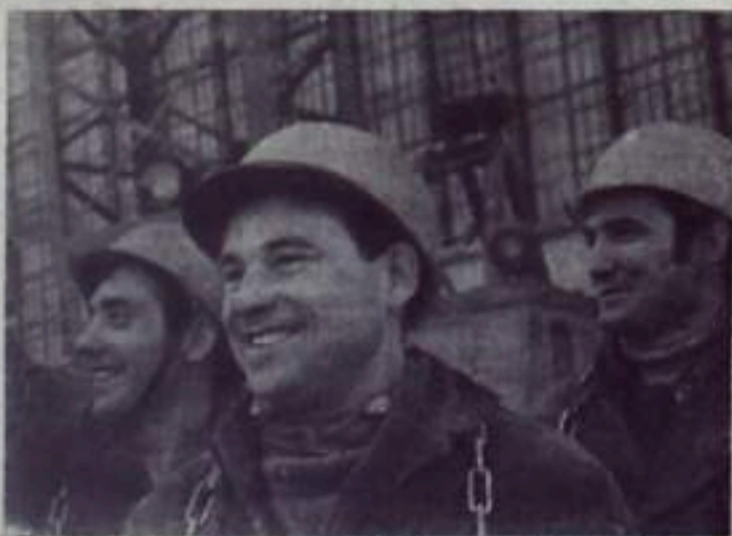
В проекте Директив XXIV съезда КПСС говорится: «В Украинской ССР... довести в 1975 году производство электроэнергии примерно до 200 млрд. киловатт-часов. Закончить строительство Славянской, Трипольской, Ладжинской, Кураховской ГРЭС...»

В подполье вылезли два молчалива. Сковырнули счетчик, проверили исправность пломбы и выдали Ахметову шмудальку, в которой