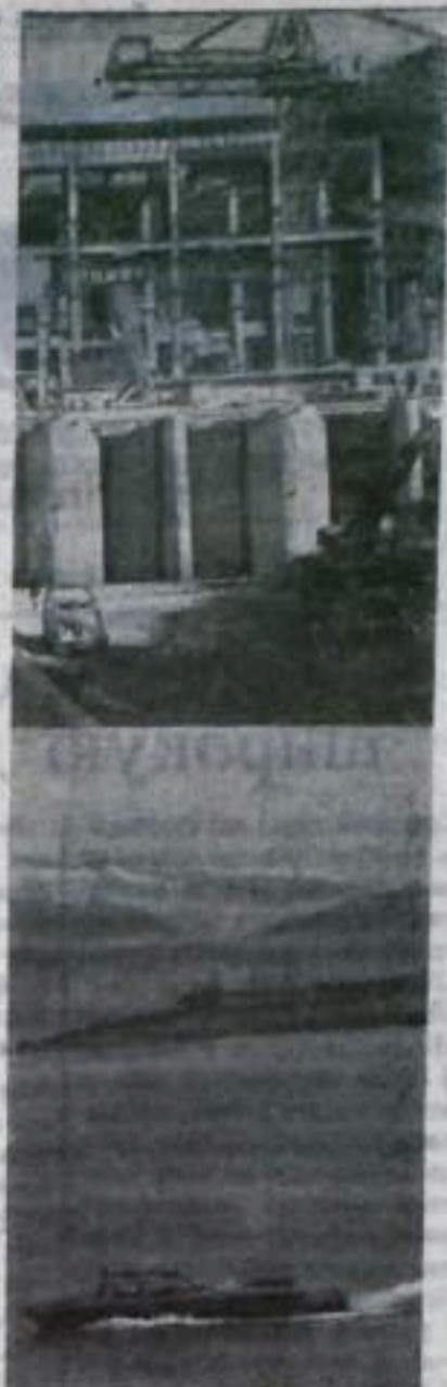
АБХАЗСКАЯ АССР. Ни на один час не затихает в эти дни гул работ на сооружении крупнейшего в Грузии энергетического комплекса на Ингури. На всех участках стройки широко развернулось социалистическое соревнование за достойную встречу XXIV съезда КПСС.