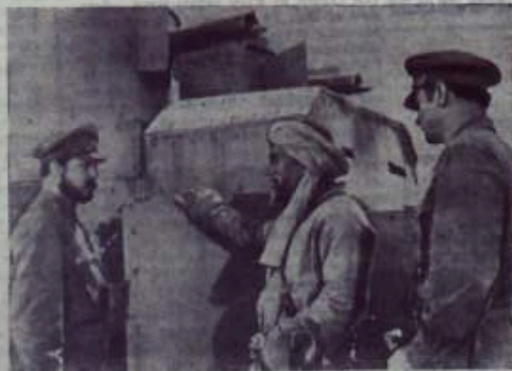
центре — Мирзо Рахматулла (З. Мухамеджанов).

На снимке: кадр из фильма. М. В. Фрунзе (Р. Хонятов, слева) отдает распоряжения. В