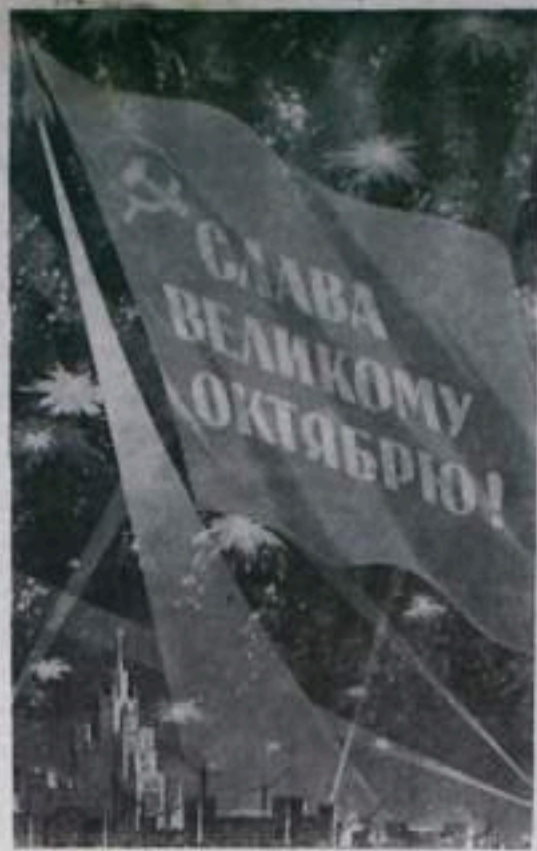
Плакаты художника А. Антонченко.