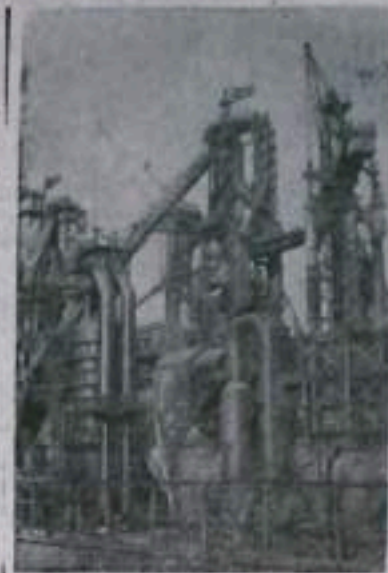
СТАЛИНСКАЯ ОБЛАСТЬ. На Енакиевском металлургическом заводе досрочно введена в строй «Енакиевская-Комсомольская» домна. Она заменила отслужившую свой век последнюю старую печь, построенную на этом заводе еще до революции. По проекту старую печь должны были остановить за два месяца до пуска новой. Коллектив цеха «Енакиевгазстрой» и металлурги сумели сократить этот размер в несколько раз. Печь домна оснащена совершенной контрольно-измерительной аппаратурой, все производственные процессы на ней механизированы и автоматизированы.

Разрез может значительно раньше выолнить годовой план, чем это предусмотрено в обязательствах. Для этого нужно улучшить организаторскую работу бюро, цеховых партийных организаций, инженерно-технических работников. Эти мероприятия намечены в принятом решении собрания, которые надо умело провести в жизнь.