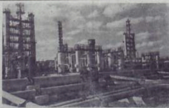
Татарская АССР. Миннибаевский газобензиновый завод — крупнейшее в республике предприятие по переработке нефтяного попутного газа. Благодаря вводу новых мощностей достигнуто значительное увеличение выпуска жидкого газа для бытовых нужд и сырья для химической промышленности.

На снимке: на Миннибаевском газобензиновом заводе.