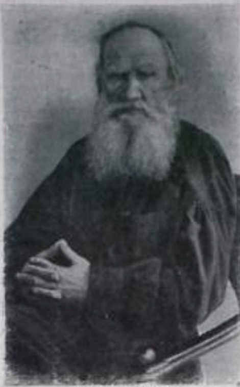
Л. Н. ТОЛСТОЙ.

Противоречия в творчестве Толстого глубоко и всесторонне раскрыл В. И. Ленин. «С одной