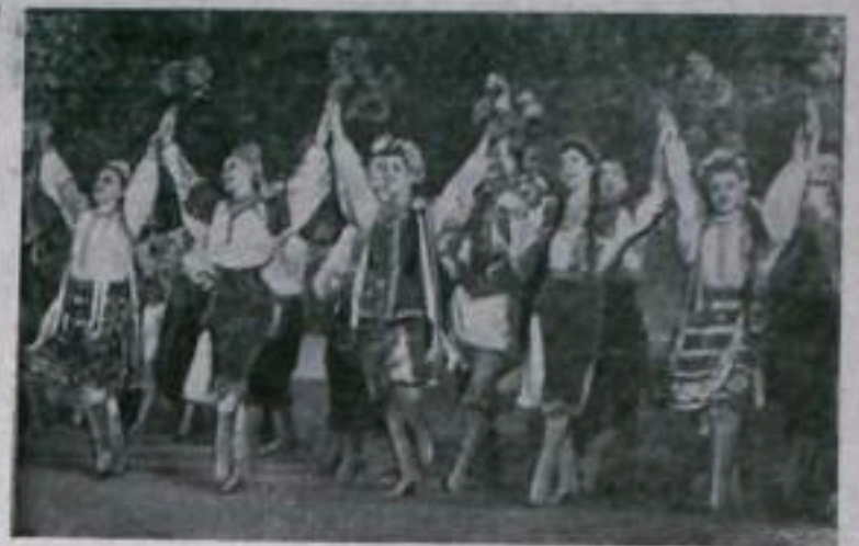
МОСКВА. В день открытия декады в помещении Концертного зала имени П. И. Чайковского состоялся концерт Государственного ансамбля танца УССР. Художественный руководитель — народный артист УССР Павел Вирский. НА СНИМКЕ: ансамбль исполняет хореографическую партию «Красная палица».