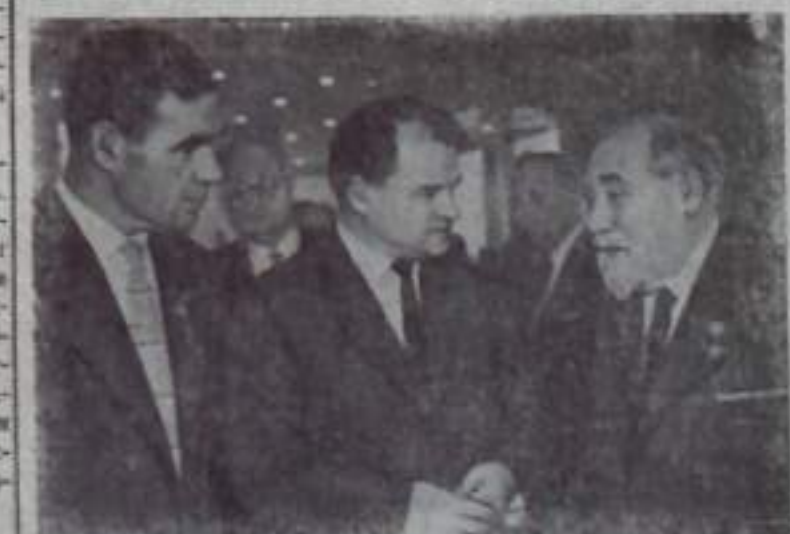
Москва. XXII съезд Коммунистической партии Советского Союза.

XXII съезд Коммунистической партии Советского Союза постановляет: 1. Мавзолей на Красной площади у Кремлевской стены, созданный для увековечения памяти Владимира Ильича Ленина — бессмертного основателя Коммунистической партии и Советского государства, вождя и учителя трудящихся всего мира, именовать вечно. 2. Признать нецелесообразным дальнейшее сохранение в Мавзолее саркофага с гробом Н. В. Сталина, так как серьезные нарушения у Кремлевской стены, созданные для увековечения памяти Владимира Ильича Ленина — бессмертного основателя Коммунистической партии и Советского государства, вождя и учителя трудящихся всего мира, именовать вечно.