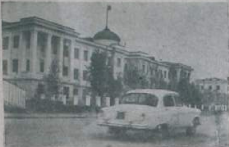
Указом Президиума Верховного Совета СССР Тувинская автономная область преобразована в Тувинскую Автономную Советскую Социалистическую Республику.