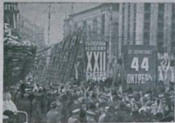
МОСКВА. 7 ноября 1961 года. Празднование 44-й годовщины Великой Октябрьской социалистической революции. Демонстрация представителей трудящихся. На снимке: в колонне демонстрантов.

Год издания 8-й № 136 (1257) ВОСКРЕСЕНЬЕ 12 НОВБЯ 1961 года Цена 2 коп.