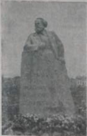
Москва. Памятник Карлу Марксу.

Год издания 8-й № 135 (1256) ПЯТНИЦА 10 НОВЯБРЯ 1961 года Цена 2 коп.