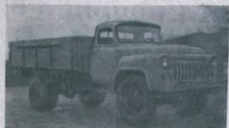
ГОРЬНИЙ. На Горьковском автомобильном заводе созданы новые типы грузовых автомобилей. НА СНИМКЕ: новый грузовой автомобиль «ГАЗ-53Б».

В. КИРИЧЕНКО, инженер по технике безопасности.