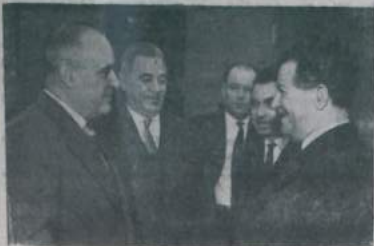
Москва. XXII съезд Коммунистической партии Советского Союза. На снимке: первый секретарь ЦК Румынской рабочей партии Г. Георгиу-Деж беседует с членом Политбюро ЦК Болгарской коммунистической партии А. Юговым.