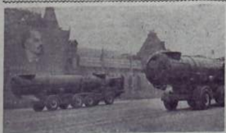
МОСКВА. 7 ноября 1961 года. Празднование 44-й годовщины Великой Октябрьской социалистической революции. Парад войск Московского гарнизона на Красной площади. На снимке: ракетная техника на параде.