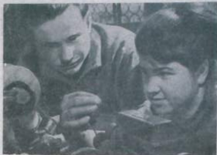
Татарская АССР. Промышленность республики пополнилась новым предприятием. В Булуге вступил в строй действующих завод нефтеавтоматики.