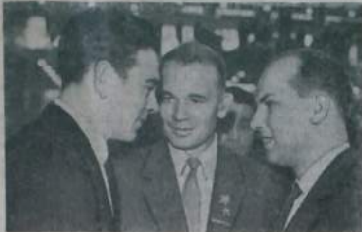
Москва. XXII съезд Коммунистической партии Советского Союза.

старший мастер отдела технического контроля.