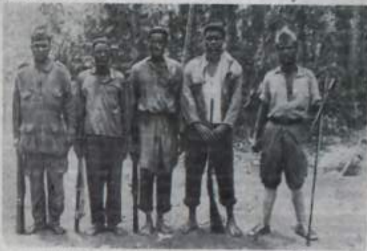
НА СНИМКЕ: группа бойцов национально-освободительной армии на военных занятиях в одном из районов Южной Анголы.

АФРИКА. Борьба народов Анголы против португальских колонизаторов принимает все более широкий размах. С каждым днем растут ряды бойцов повстанческой национально-освободительной армии. Многие вооружены только дубинами и охотничьими ружьями, некоторые имеют новейшее современное оружие, обитые в жестких боях с португальскими регулярными войсками. Мужественные ангольские патриоты полны решимости довести до победного конца борьбу за свободу и независимость Анголы.