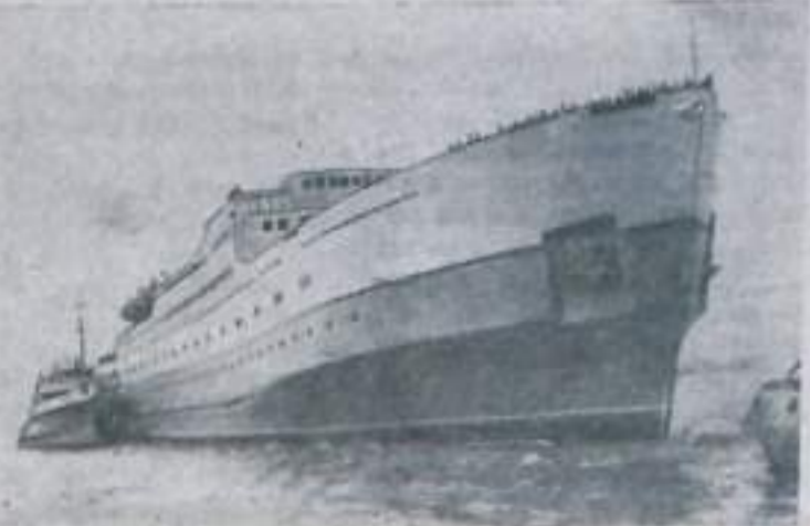
ГОРЬКИН. Коллектив завода «Красное Сорго» закончил основные работы по созданию морского железнодорожного паром-гиганта «Советский Азербайджан».

Это крупное морское судно длиной 134 метра и шириной 18 метров имеет двигатель мощностью до 250 лошадиных сил. «Советский Азербайджан» станет курсировать на линии Красноводск — Баку, паром рассчитан на перевозку одновременно 30 большегрузных железнодорожных вагонов. В его удобных каютах могут размещаться триста пассажиров.