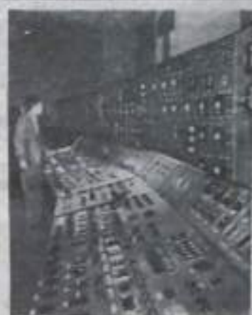
В Народной Республике Болгария сооружается самая крупная на Балканском полуострове теплоэлектростанция «Марица — Восток». Она снабдит дешевой энергией создаваемый в районе города Стара Загора мощный промышленный комплекс. Над стройкой шефствует болгарский комсомолец. Ряд объектов уже вступил в строй.

В Китайской Народной Республике разработан новый метод получения каучука из сладкого картофеля. Из 30 тонн картофеля можно получить одну тонну каучука. Для опробования нового метода создан опытный завод.