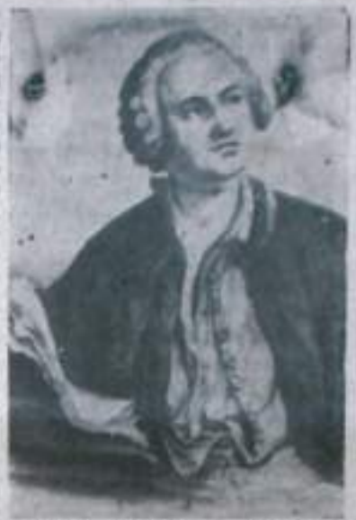
Михаил Васильевич Ломоносов (1711 — 1765 гг.), великий русский ученый и писатель.