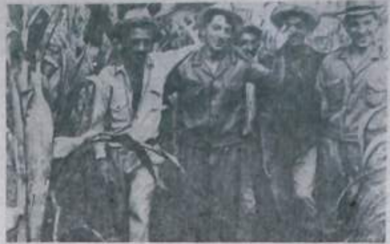
Группа молодых механизаторов и агрономов, прибывшая из СССР, работает в народном имении «Иван Родригес» (провинция Ориенте). Они рассказывают кубинским крестьянам о достижениях советских колхозов и совхозов, делятся своим опытом и знаниями. НА СНИМКЕ: советские и кубинские друзья.