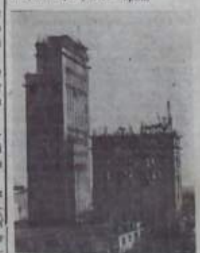
На снимке: строительство нового Ковыльненского элеватора.

Целиноградская область. На станции Ковыльная строится большой элеватор, первая очередь которого вступит в строй к началу жатвы будущего года. Элеватор будет принимать и перерабатывать более ста тысяч тонн зерна в год. Сделать это позволит высокий уровень механизации. Два оператора с пульта управления будут управлять всеми процессами по приемке, переработке и транспортировке зерна.