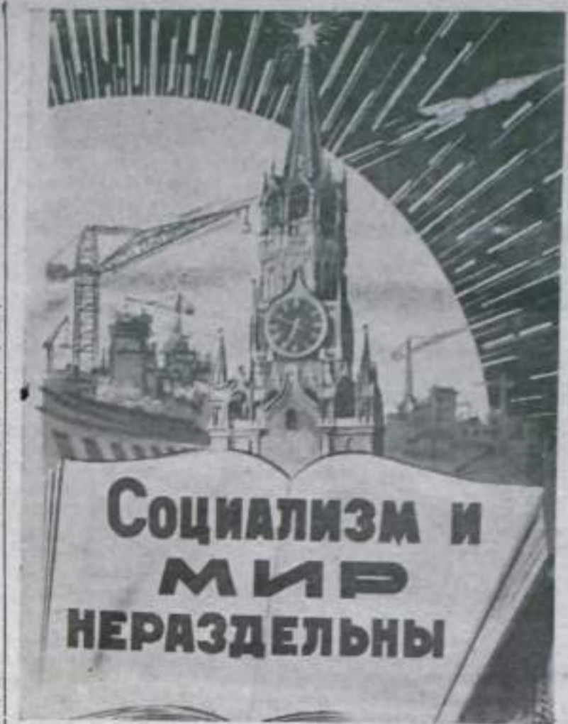
Плакат художника Б. Антонова.