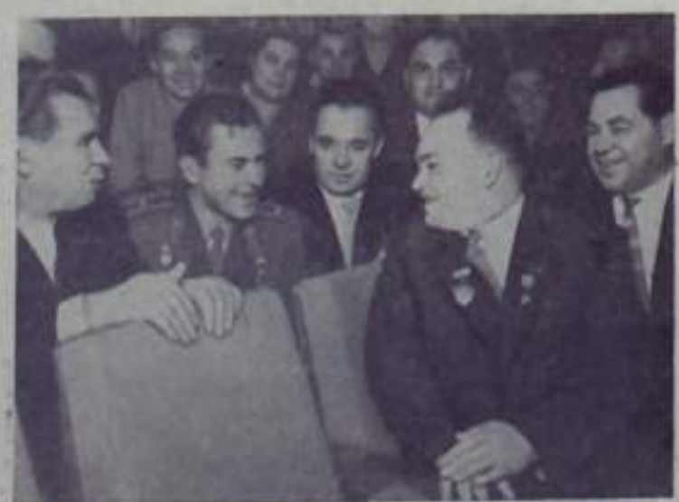
Москва. XXII съезд Коммунистической партии Советского Союза. На снимке: в зале перед началом заседания. В центре — делегаты съезда летчик-космонавт Герой Советского Союза Г. С. Титов и Герой Социалистического Труда лаборант шахты Суходольская № 1 Луганской области Н. Я. Мамай.