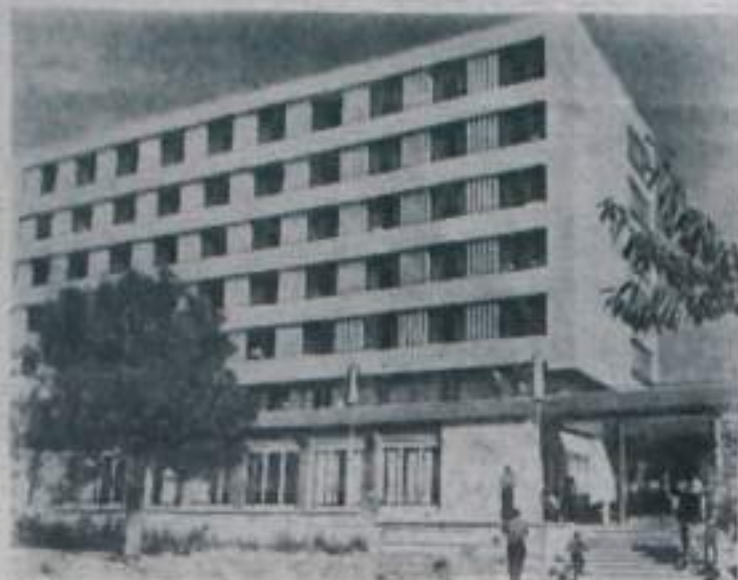
В Народной Республике Болгарии построено 15 домов отдыха и 9 санаториев для труженников села. Здания расположены в самых красивых местностях.

На снимке: дом отдыха для крестьян на черноморском курорте «Золотые пески» недалеко от города Варны.