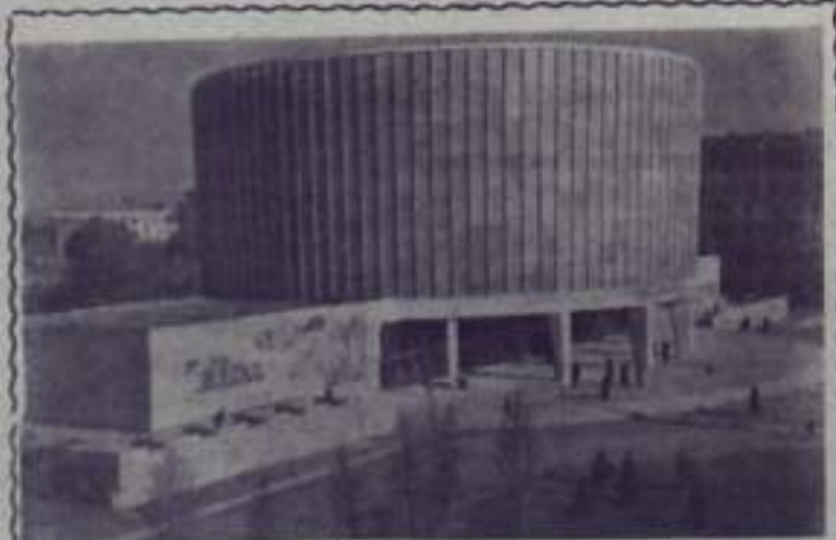
В Москве открылась для всеобщего обозрения папиромы выдающегося русского художника Ф. А. Рубо «Бородинская битва».

Советский Союз не дал вспыхнуть войне, которая не нужна ни советскому, ни американскому, никакому другому народу на земле. — эта мысль красной нитью проходит через все письма и телеграммы, поступающие в Советское посольство в Вашингтон. По всей стране, сообщает агентство АП, «ощущается ослабление