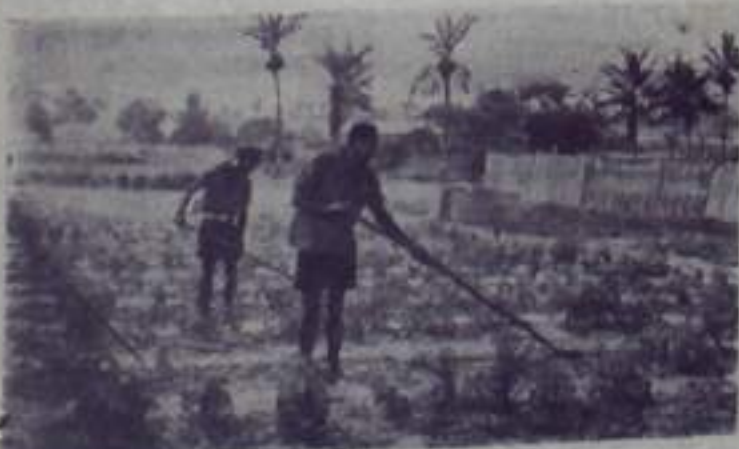
Республика Сенегал. Около 95 процентов населения страны занято в сельском хозяйстве. На снимке: крестьяне на плантации.

Из займа в размере 3,5 млн. фунтов стерлингов, предоставленного в августе этого года английским правительством, значительная сумма была направлена на строительство полицейских зданий и участков. В то же время до сих пор не было истрачено ни одного пенса на сооружение 60 начальных и 8 средних школ, намеченных к строительству в этом году. Вследствие существующей в Южной Родезии безработицы по окончании школы дети африканцев оказываются в трудном положении. Почти 30 тысяч окончивших школу, пишет «Гардиан», сейчас скитаются в городах без всякой надежды получить работу и пристанище.