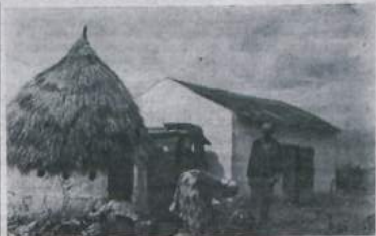
Марокко. Жизнь марокканского крестьянина в окрестностях Рабата.

Несто Соллиман аль Гурели из Саудовской Аравии не так давно поместил в западногерманских газетах объявление, что он является хозяином богатых нефтяных промыслов и ищет «хорошенькую европейку» в возрасте до 22-х лет, которая могла бы стать 42-й женой в его гареме. Аль Гурели получил в ответ 2000 брачных предложений.