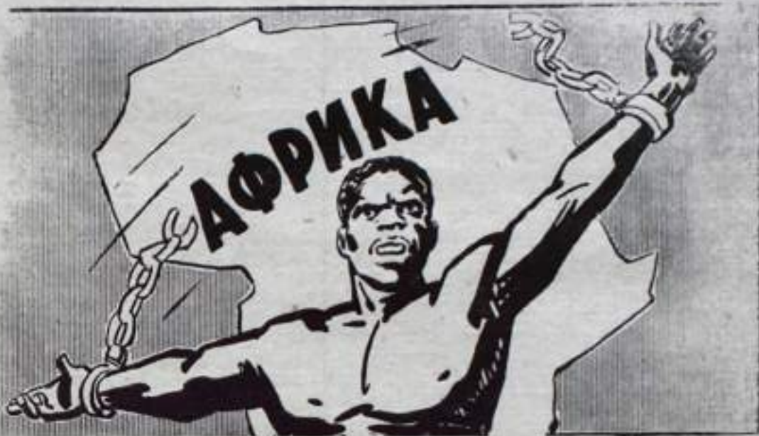
Плакат В. Жаринова.