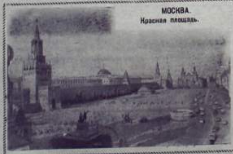
МОСКВА. Красная площадь.

«МАРИТЕ», «ИЛЬЯ МУРОМЕЦ», «БИТВА В ПУТИ» (1-я серия), 9, 10, 11 ноября — «БУДАПЕШТСКИЕ КРЫШИ», «БИТВА В ПУТИ» (2-я серия).