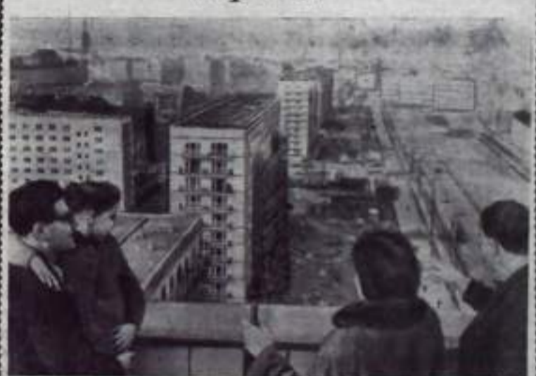
Германская Демократическая Республика. Вид на новостройки Карл-Маркс-алее в Берлине. Центральная — ТАСС.

Пекин. Большинство из 30 крупных машиностроительных заводов Внутренней Монголии, построенных после освобождения страны, выпускает машины для сельского хозяйства. За первые девять месяцев нынешнего года выпущено более 15 тысяч машин. Все они отправлены в сельские и скотоводческие районы. За это же время было произведено большое количество запчастей для тракторов и других машин.