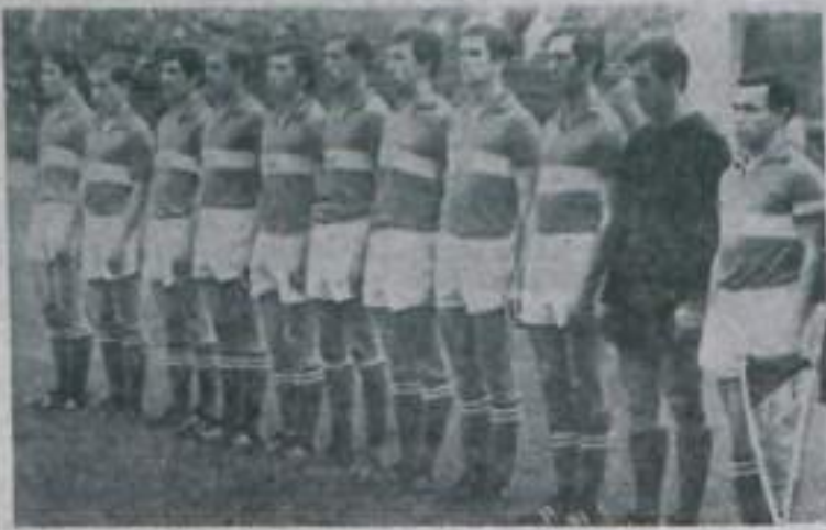
Московская футбольная команда «Спартак» стала чемпионом СССР 1969 года. Этого почетного титула спартаковцы добились после шестилетнего перерыва в овациих раз.

Новые чемпионы страны на протяжении всего турнира продемонстрировали высокие волевые и технические качества, показав футбол международного класса. Успешно выдержали экзамен на зрелость молодые футболисты команды. Силь воспитанники «Спартак» (старший тренер команды Никита Симонян) входят в состав сборной страны.