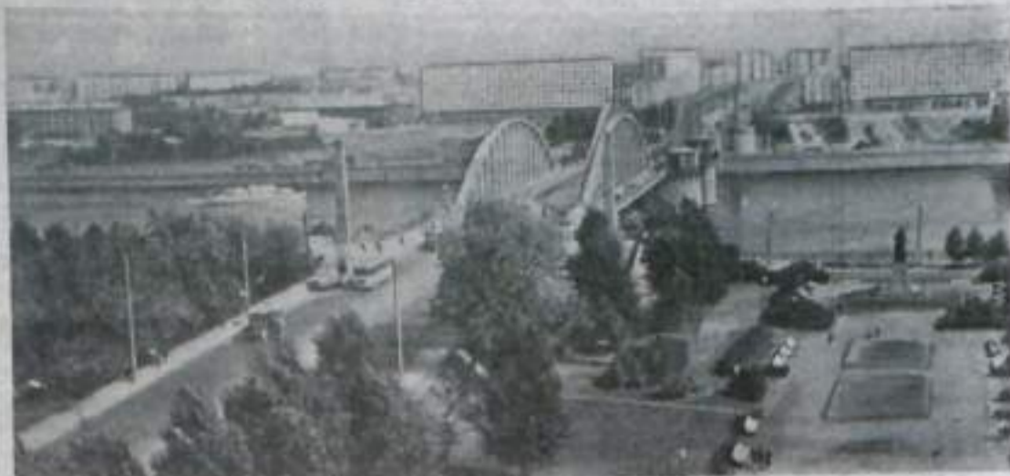
На снимках: новые жилые кварталы Невской заставы в районе Володарского моста.

Рабочие Невского района с большим воодушевлением готовятся к 100-летию со дня рождения В. И. Ленина, идут в первых рядах Ленинской юбилейной трудовой вахты.