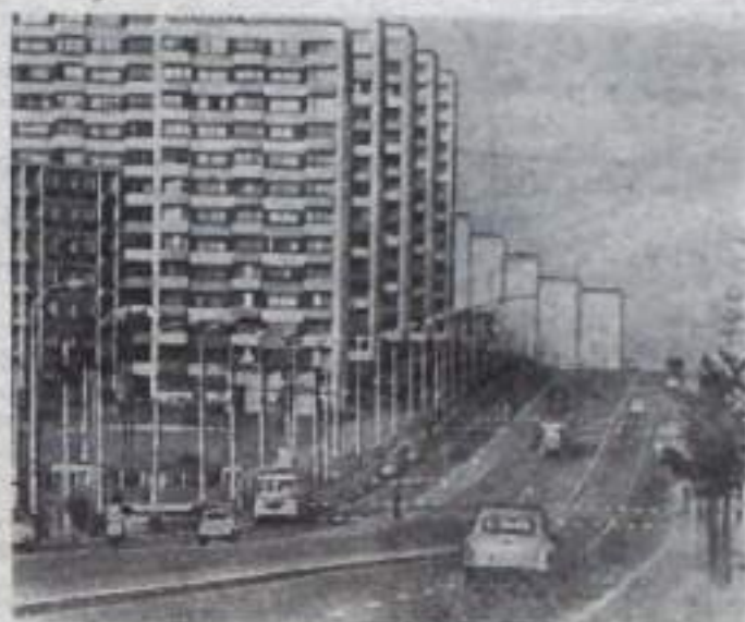
Именем В. И. Ленина названа улица в Праге, проложенная через новый район города. Она связывает площадь имени Великой Октябрьской социалистической революции с Рузичским аэропортом. Ее длина семь с половиной километров. По обеим сторонам широкой магистрали высятся многоквартирные жилые дома, построены школы, детские сады, магазины, кинотеатры.

ПРАГА. Металлурги завода в моравском городе Тршине в этом году дали сверх плана около 34 тысяч тонн чугуна, более 45 тысяч тонн стали и свыше 40 тысяч тонн проката. Уже не один год по своим производственным показателям тршинские металлурги находятся среди первых в республике. И сейчас, когда коммунистическая партия Чехословакии призвала трудящихся страны развернуть трудовую инициативу в честь 25-й годовщины освобождения страны Советской Армией, тршинские металлурги подписали обращение ко всем рабочим страны с призывом: «Больше труда для республики — вот наша агитация!» Слово тршинских мастеров металла не расходится с делом.