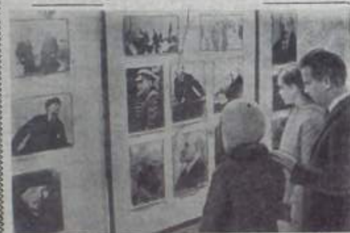
ФИНЛЯНДИЯ. В городе Турку прошла неделя, посвященная 100-летию со дня рождения В. И. Ленина.

В эти дни состоялись встречи общественности города с ветеранами финского рабочего движения, была организована фотоярмарка, отражающая жизнь и деятельность В. И. Ленина, проведена презентация выставки репродукций на финском языке.