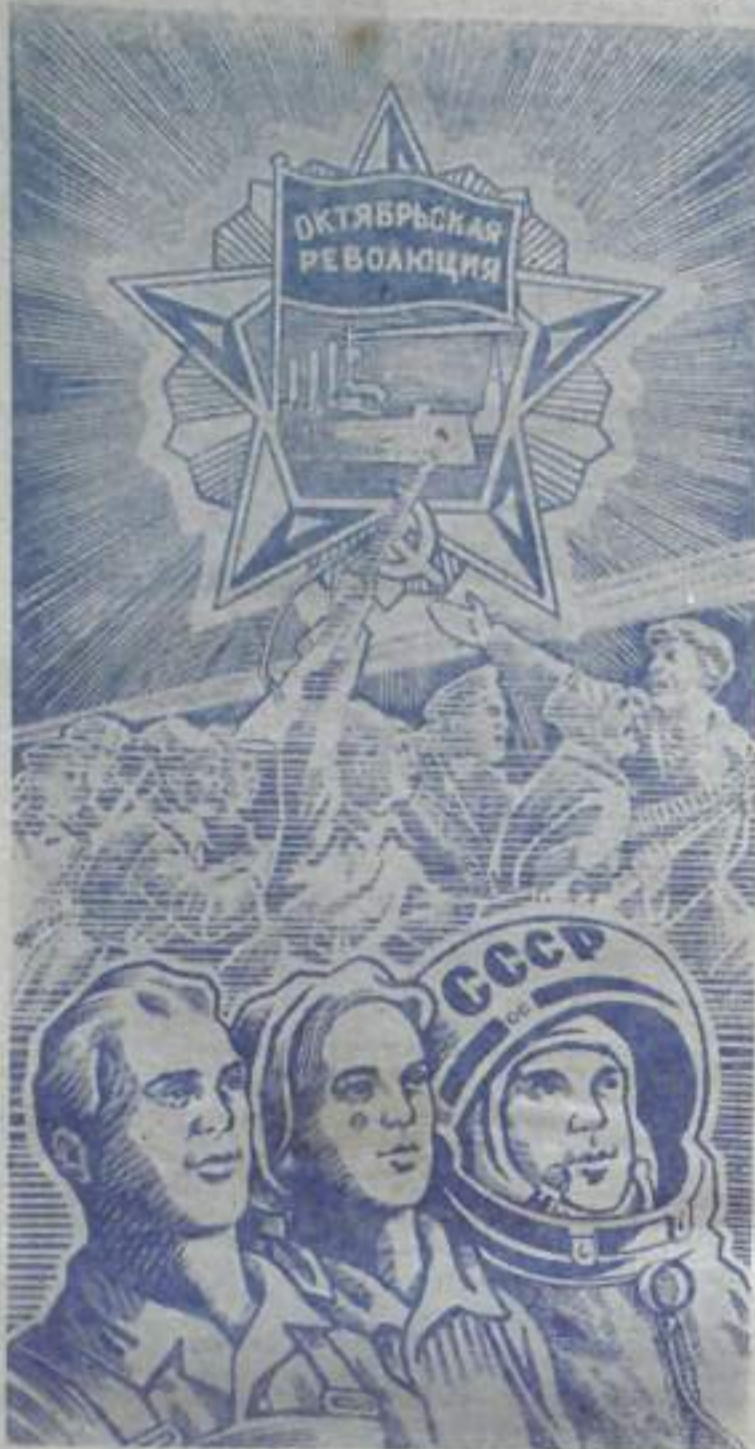
Рисунок художника С. Гринько.