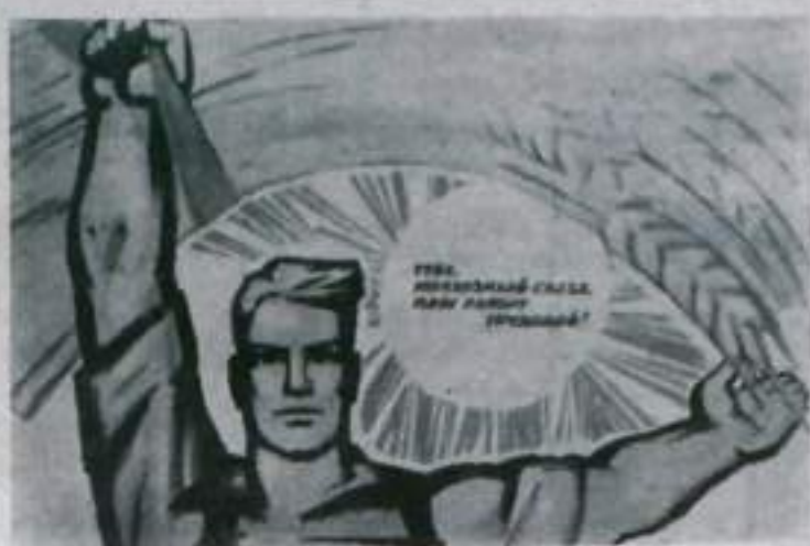
Тебе, колхозный съезд, наш рапорт трудовой! Плакаты художника В. Великова, выпущенный издательством «Советский художник» к Третьему Всесоюзному съезду колхозников.