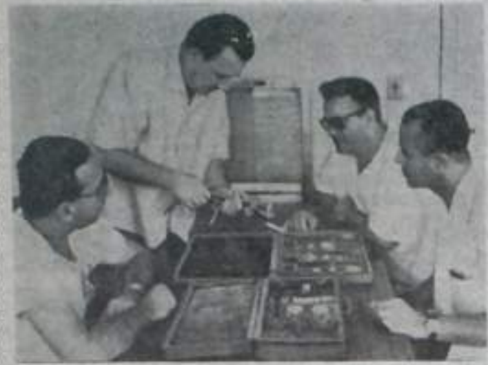
РЕСПУБЛИКА КУБА. В дар кубинскому народу Советский Союз в городе Ольгине построил больницу, которая названа именем Владимира Ильича Ленина. Врачам дружественной страны помогают в работе квалифицированные советские медики.

СОФИЯ. (ТАСС). Большое место в подготовке к 100-летию со дня рождения В. И. Ленина в Болгарии занимает пропаганда и изучение ленинского идейно-теоретического наследия. Только в сети партийно-политического просвещения Русникоз округа действуют 872 группы и кружка, в которых учатся более 21 тысячи коммунистов и беспартийных. Для слушателей читаются лекции и доклады о жизни и деятельности вождя мирового пролетариата. Кроме того, организовано более 20 семинаров, участники которых изучают ленинские труды.