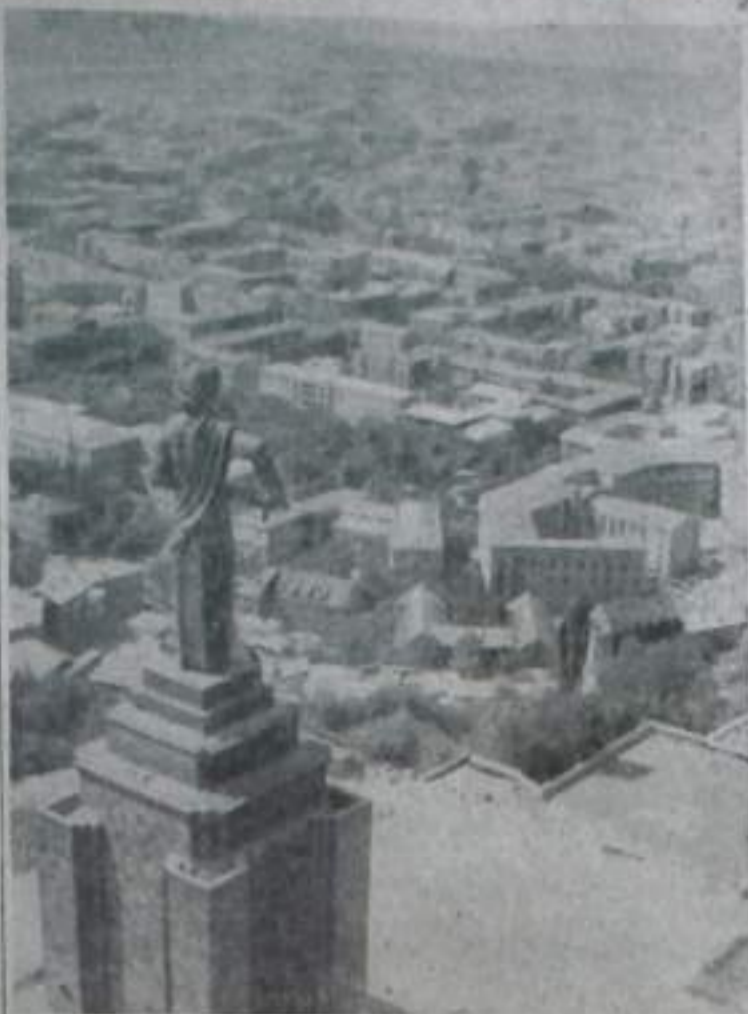
Панорама города Еревана. На переднем плане — скульптура «Мать Армения».

внештатный корреспондент газеты «Путь Ильича».