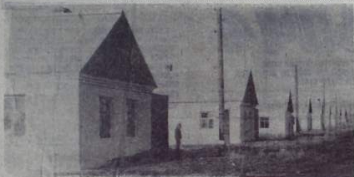
Растет и благоустривается село Бахмут. Колхоз имени Кавказца широким фронтом строит дома для колхозников.