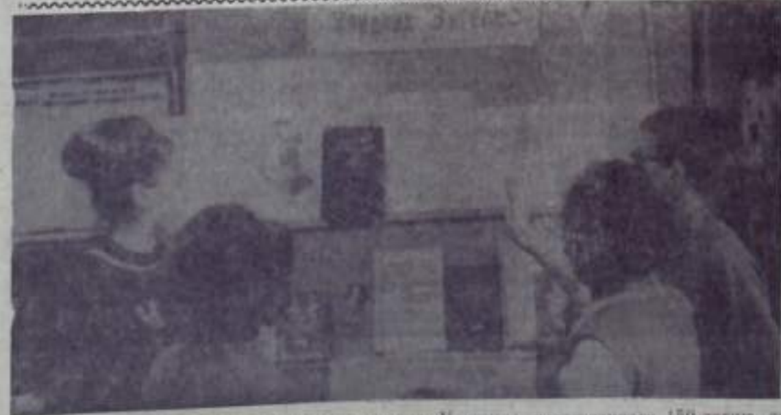
На снимке: Дворец культуры угольщиков. У стенда, посвященного 150-летию со дня рождения Ф. Энгельса.

«ПУТЬ ИЛЬИЧА» 3 стр. 28 ноября 1970 года.