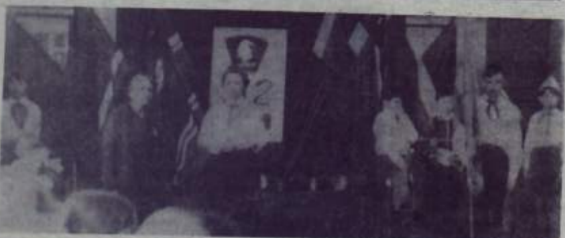
Накануне 33-х годовщины Октябрь в городской школе № 1 состоялся сбор пионерской дружины. На нем первоклассники были приняты в ряды октябрист.