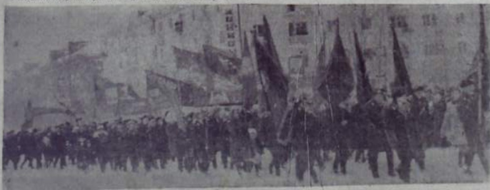
Праздничная демонстрация в городе Кумертау.