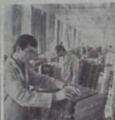
На ереванском заводе «Электрон» создаются универсальные электронно-вычислительные ма-

шины «Навря» и «Наври-2». Небольшие по размерам, они обладают большим количеством стандартных программ, несложны в эксплуатации. Это дает возможность широкого применения их во многих отраслях производства. «Электрон» — предприятие высшей культуры производства. В цехах всегда свежий воздух, повсюду чистота и порядок. Коллектив обязался выполнить годовой план к 29 ноября — 50-летию республики, а до конца года дать на сотни тысяч рублей продукции сверх плана.