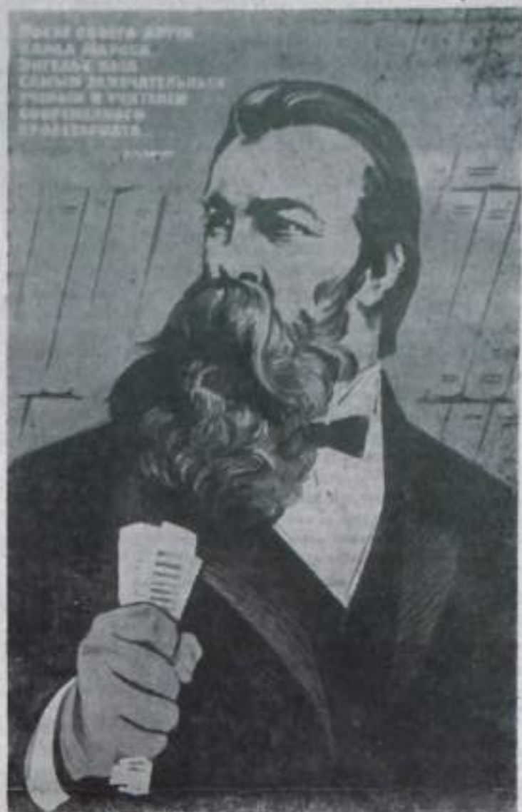
«Ф. Энгельс — великий теоретик и вождь пролетариата»

Чтить память о Фридрихе Энгельсе — это значит выполнять завет В. И. Ленина об изучении и пропаганде имени, жизни, деятельности, идейного наследия великого революционера Энгельса, использовать его труды в решении актуальных проблем развития мировой социалистической революции, строительства коммунизма.