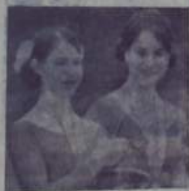
Любина (Югославия). На чемпионате мира по гимнастике блестящего успеха добился советский спортсмен.