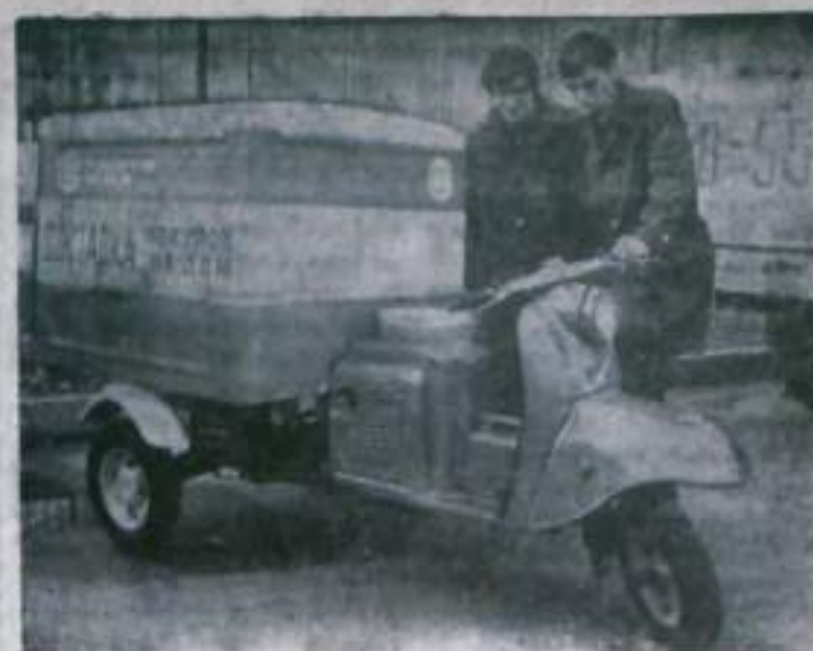
МОСКВА. На тематической выставке — «Транспортно-экспедиционное обслуживание населения», открытой в павильоне «Транспорт СССР» ВДНХ СССР, демонстрируются разные виды услуг, которые оказывают населению транспортные агентства Российской Федерации, Украинской и Грузинской союзных республик, и техника, которую они используют.

Производство конструкций уже освоено на предприятиях строительной индустрии республики. Фрагмент птичника в натуральном виде показывается на ВДНХ СССР.