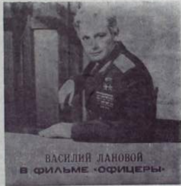
ВАСИЛИЙ ЛАНОВОЙ В ФИЛЬМЕ «ОФИЦЕРЫ»

Фильм режиссера Владимира Рогова (студия им. М. Горького) «Офицеры» кумертаусцам знаком. Премьера этого фильма состоя-