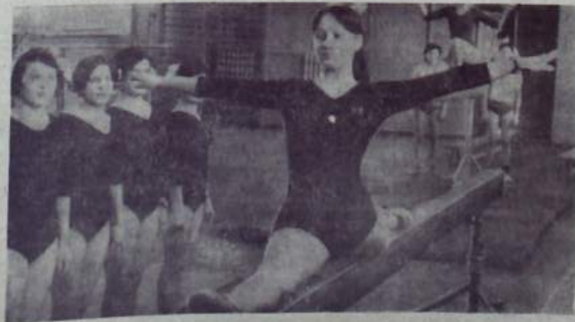
Отличные условия для занятий предоставляются учащимся в Кумертауском педучилище. Кроме просторных и светлых аудиторий, где юности и девушки усваивают теоретический курс, есть здесь и физкультурный зал для спортивных занятий.