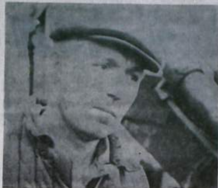
Фото и текст В. НЕЛЮБИНА.