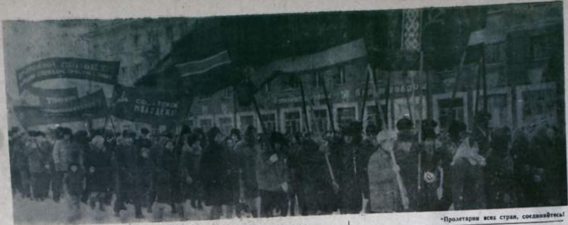
«Пролетарии всех стран, соединитесь!»