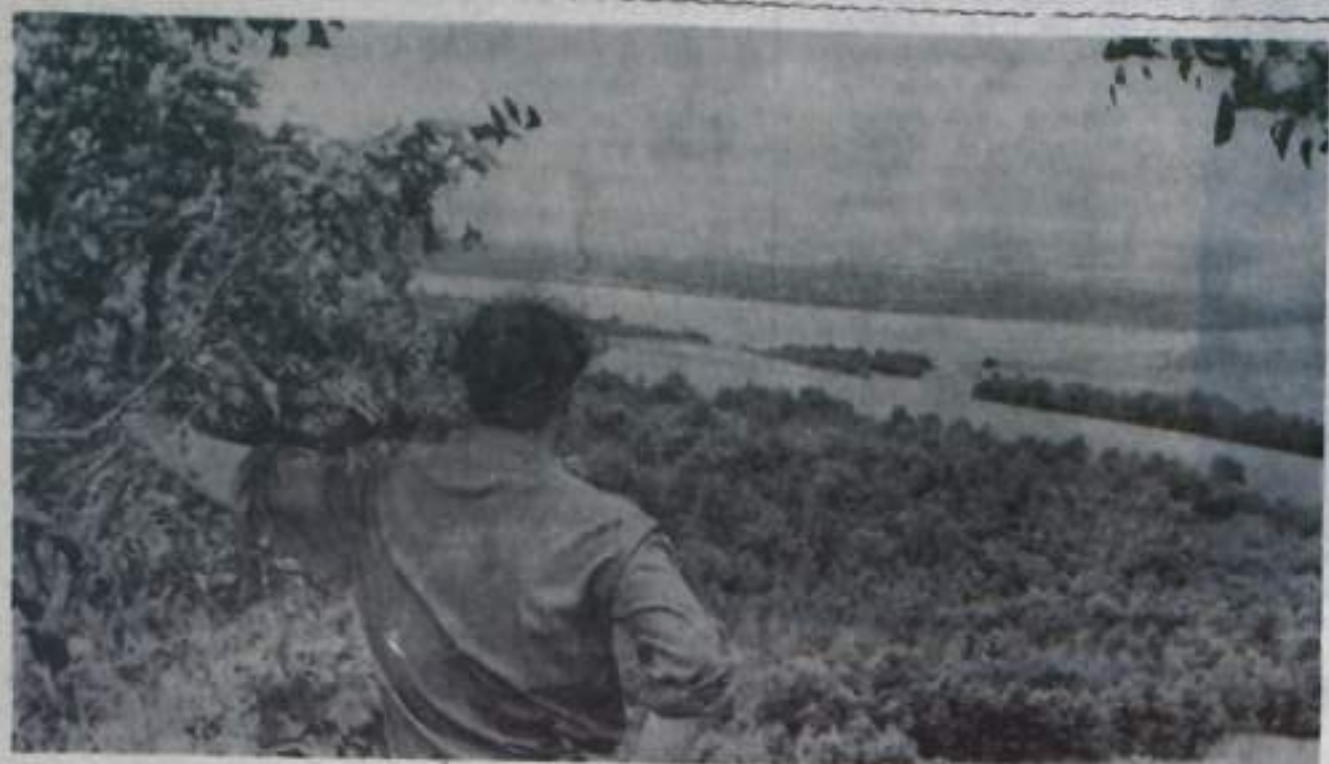
ВОСПОМИНАНИЯ О ЛЕТЕ.

Стекло и сталь И рвется в небо здание, Полувоздушным профилем мана, Мы сквозь стекло проникли и мироздание, Раздвинув створки солнечного дня. И Галилей, Не убоится бога, Смотрел в ночное небо сын земли, И на открытиях в разные эпохи Вело стекло колумбов корабли. ...Звенят бокалы в праздничном застолье, И льют экраны голубой эфир... Стекло Оно по существу простое, Но сквозь него мы видим целый мир.