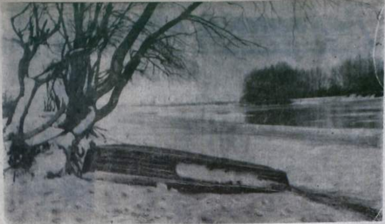
НА РЕКЕ БЕЛОЙ. НАЧАЛО ЗИМЫ.