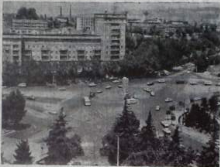
Столица Грузинской ССР — Тбилиси. Площадь Героев.

В автономной области живет немалый болен ста тысяч человек. А ведь здесь сегодня насчитывается около четырех тысяч специалистов с высшим образованием. В области 280 общеобразовательных школ, педагогический институт, научно-исследовательский институт Академии наук Грузинской ССР, сельскохозяйственный техникум, меццанское, художественное и музыкальное училища. Созданы национальный театр, отделение Союза писателей и Союза художников Грузинской ССР.