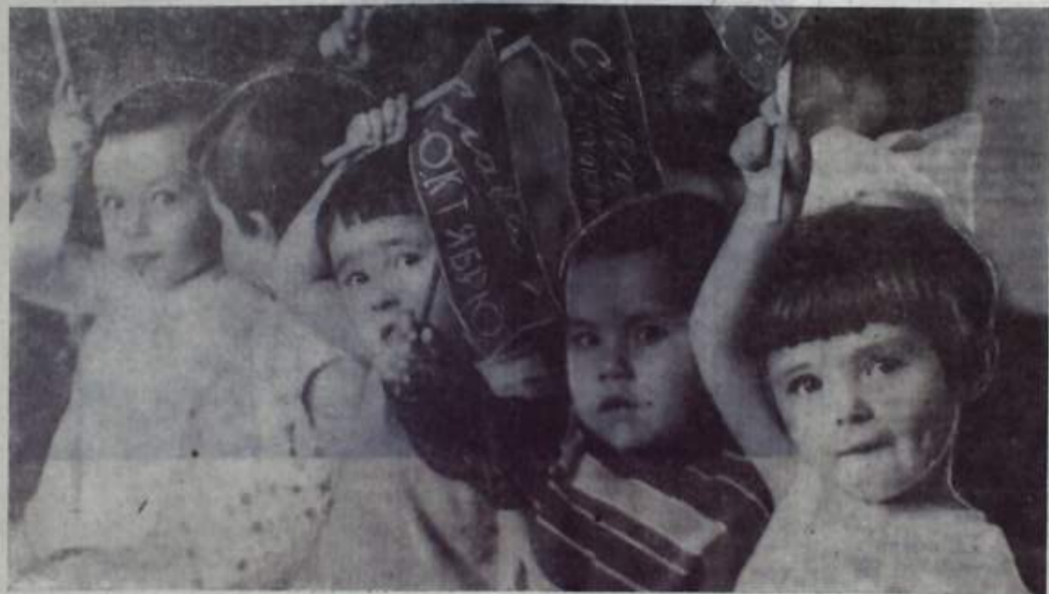
СЛАВА СЛАВА ОКТЯБРЮ!