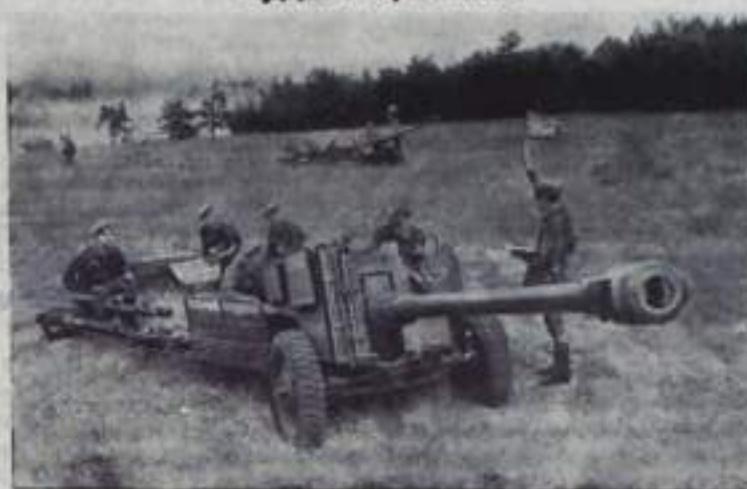
Артиллеристы-десантники на боевых учениях.