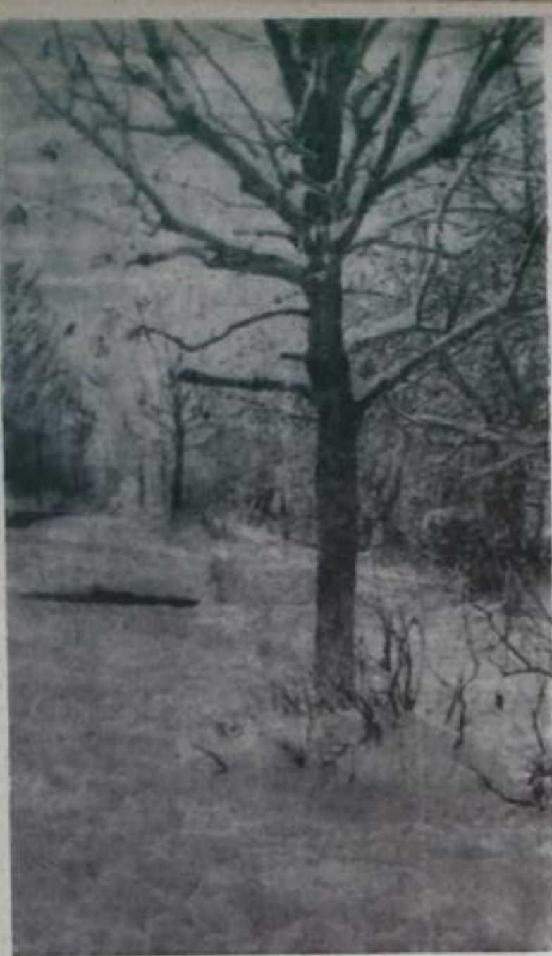
В зимнем лесу.