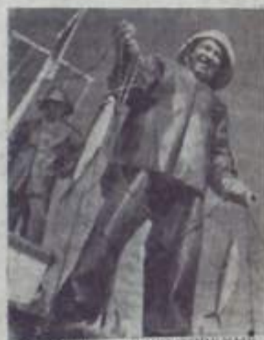
Байкал — неисчерпаемый уголок нашей земли, средоточие сказочных богатств и красоты...

В этом величайшем озере-море находится 4/5 мировых запасов поверхностных пресных вод — самых чистых