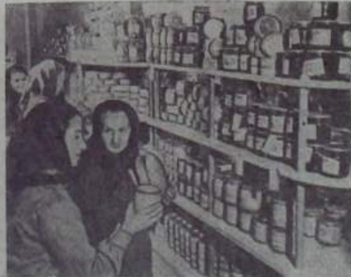
ЗАБАРПАТСКАЯ ОБЛАСТЬ. С каждым годом работницы Чувашского треста «Сваляжского района» расширяют обслуживание населения. Только в этом году в селе Чувашском начали работать

Многие наши строители работают на периферии, а снабжением их орс не интересуется. Он не выделяет нам поваров, их приходится нанять со стороны.