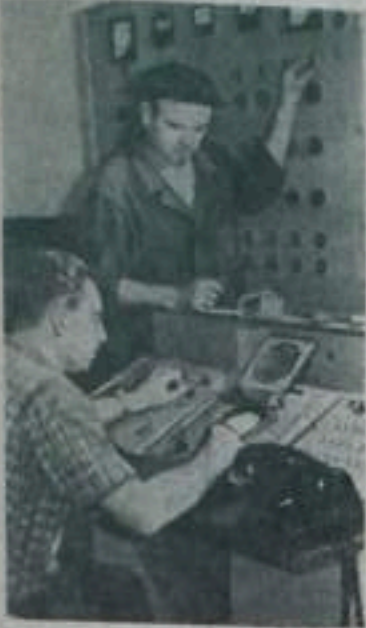
КРАСНОДАРСКИЙ КРАЙ. В нефтепромышленном управлении «Абиснефть» из 8 участков по добыче нефти в переводены на дистанционный контроль и телеуправление.

В настоящее время ведутся монтажные работы по диспетчеризации первого промысла. Управление работой нефтяных скважин будет осуществляться одним диспетчером.