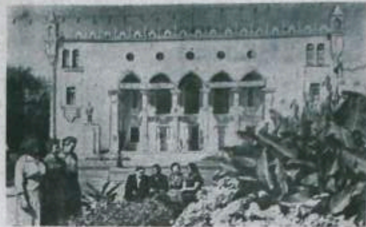
Восточно-Казахстанская область. Дворец культуры нефтяников в Гурьеве.