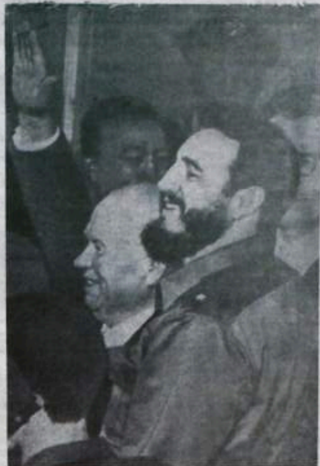
Нью-Йорк. Встреча Н. С. Хрущева с Президентом Министром Кубинской Республики Фиделем Кастро в отеле «Терезия» в Гарлеме. Глава Советского правительства отмечает на приветствии нью-йоркцев, собравшихся около отеля.

Инженер. С ним советские люди, наши труженики, связывают все лучшее, видят в нем борца за новое, прогрессивное, человека передовых взглядов. И это вполне справедливо. Инженер должен полученные в стенах вуза знания осветить крылатой мечтой, обогатить опытом своего труда, выступать поборником технического прогресса, обогащая свою память, передавать свои знания другим и будить в них мысль, нести в массы высокую культуру, воспитывать в себе и других черты человека будущего. Инженер — активный строитель светлого здания коммунизма!