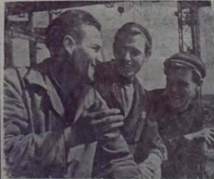
КРАСНОДАРСКИЙ КРАЙ. В этом году даст промышленный год первый квартал Новокузнецкой ГРЭС. На фоне ускоренной стройки идет напряженная работа, заканчивается монтаж парового котла, монтируется второй котел. Недалек тот день, когда начнется испытание первого агрегата.

Осень и зима — трудный период для строителей. Но их можно легко одолеть, встретив во всеоружии, создав необходимый задел. Руководителям треста и строительных управлений следует обратить также особое внимание на овладение строительными смежными профессиями. Исправить создавшееся положение в кратчайший срок — это должно стать первоочередной задачей партийных, профсоюзных и комсомольских организаций. Ибо наличие широкого фронта работ сегодня — необходимое условие для строительного трудового темпа завтра.