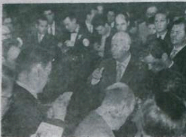
Соединенные Штаты Америки. В Гленкове состоялась беседа главы советской делегации на XV сессии ООН Н. С. Хрущева с корреспондентами.

На утреннем заседании выступил также премьер-министр Индии Дж. Перу, посетивший свою речь проблеме разоружения. (ТАСС)