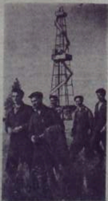
БАШКИРСКАЯ АССР. Большой трудовой успех добилась бригада вахтеры бурения № 2 треста «Туймазинбурнефть», ру-

УФА. В городе башкирских нефтяников — Октябрьском вступила в строй крупная фабрика по производству обуви. Новое предприятие оснащено передовым оборудованием. Все операции будут производиться на конвейере. Разработать модель износостойкой и удобной обуви, на которой будет стоять марка «Октябрьская», помогли специалисты Москвы и Казани. До конца года фабрика изготовит миллион пар обуви.