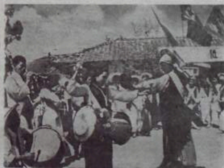
Корейская Народно-Демократическая Республика. На сельском празднике.

ПХЕНЬЯН (ТАСС). Здесь два месяца выставку посетило более полутора миллионов корейских трудящихся, свыше 6.000 технических работников и специалистов приняли участие в проведенных на выставке семинарах, более 500 тысяч человек просмотрели советские кинофильмы.