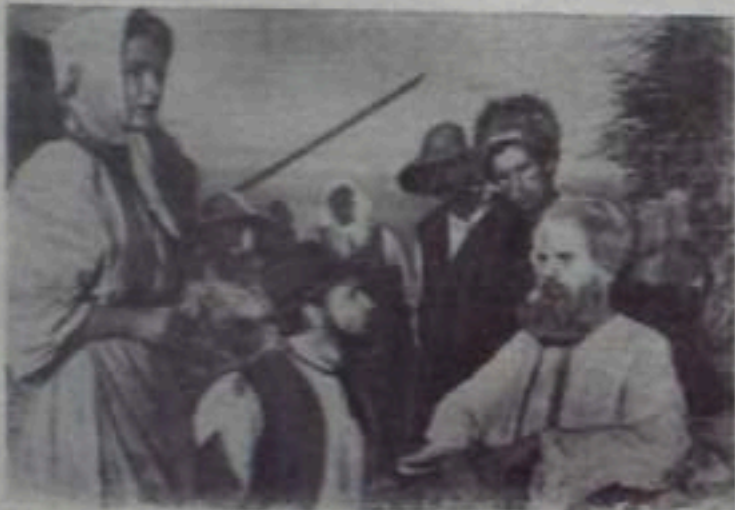
Кадр из нового художественного фильма «Газун». Режиссерство известуды имени А. Е. Давыдова.