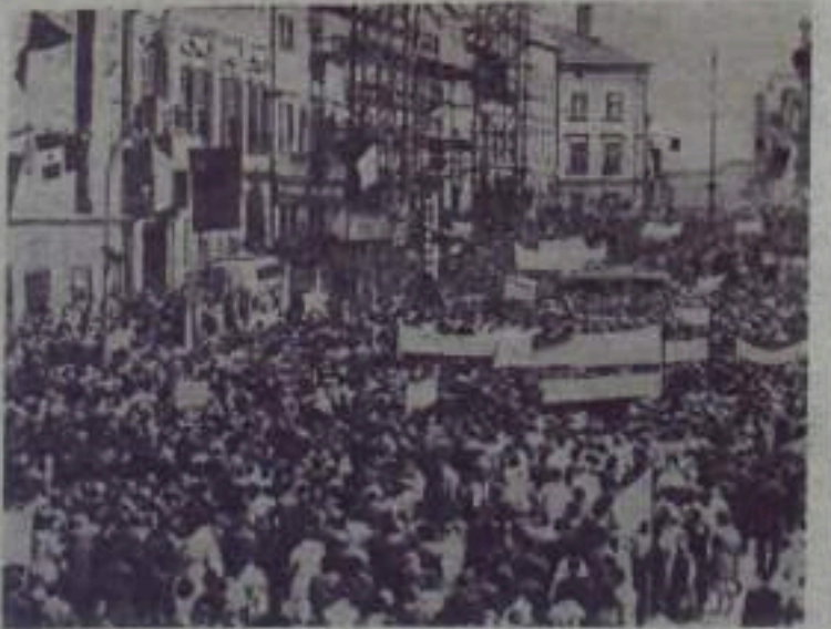
Чехословацкая Социалистическая Республика. В городе Хеб состоялся многотысячный митинг трудящихся. Присутствующие выразили протест против продолжающейся в Западной Германии политики милитаризации.

Советский Союз стойко и последовательно продолжает борьбу за мир. Л. СТЕПАНОВ,