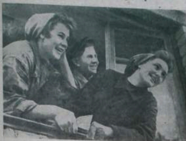
Два года назад недалеко от Комсомольска-на-Амуре развернулось строительство крупнейшего на Дальнем Востоке целлюлозно-бумажного комбината и города Амурска. Тысячи посланцев комсомола, прибывшие в тайгу, стали первооткрывателями строительства.