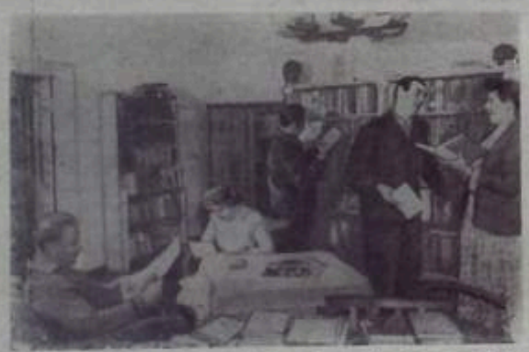
Германская Демократическая Республика. В библиотеке Дома культуры в деревне Круте, район Вал Фрейенвальде.