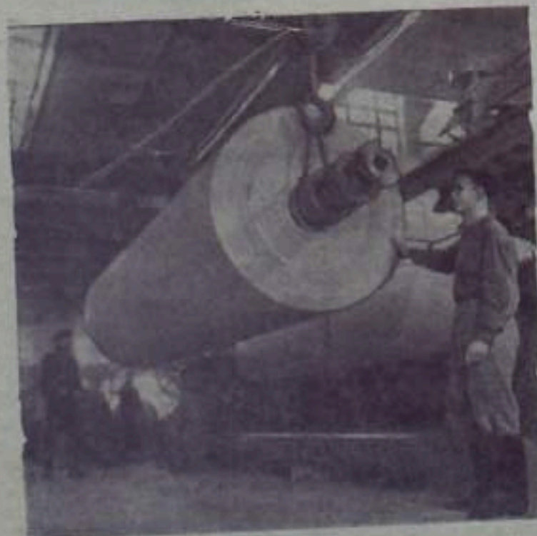
КРАСНОЯРСЬК. На конвейерной бригаде колхозника выведена в движение лента в Гильдии геологическая линия на конвейерной ленте бурной. По мощности ее нет равных в стране. С буроводительской машинкой ежедневно будет сниматься буроводительская лента длиной в 30 километров и шириной более четырех метров.

И. СТЕПАНОВ, корреспондент участка службы пути.