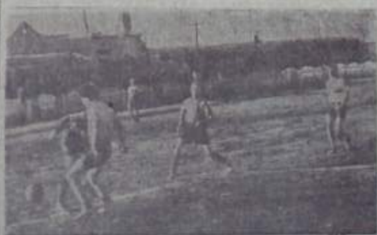
Момент игры детских команд.