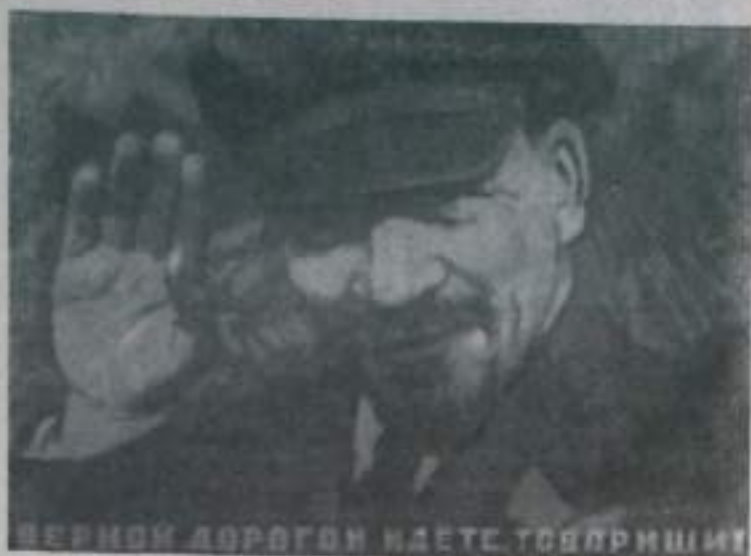
Плакат художника Н. Терещенко (Надательство «Советский художник»).

Выполнение и перевыполнение производственных планов и обязательств