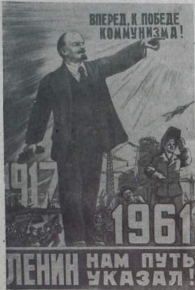
Плакат художника Б. Антонова. Фотохроника ТАСС.

В столице нашей Родины — Москве продолжает свою работу XXII съезд Коммунистической партии Советского Союза.