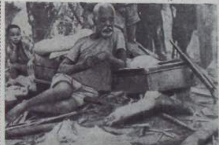
Португальские империалисты ведут колониальную истребительную войну против борющегося за свое освобождение народа Анголы. Упорное сопротивление ангольских повстанцев, приводит в ярость португальских карателей. Они вымещают свои мстительные намерения на мирном гражданском населении, расстреливая стариков, женщин и детей, сжигая дома ангольские селения. НА СНИМКЕ: они бежали от зверств колонизаторов.