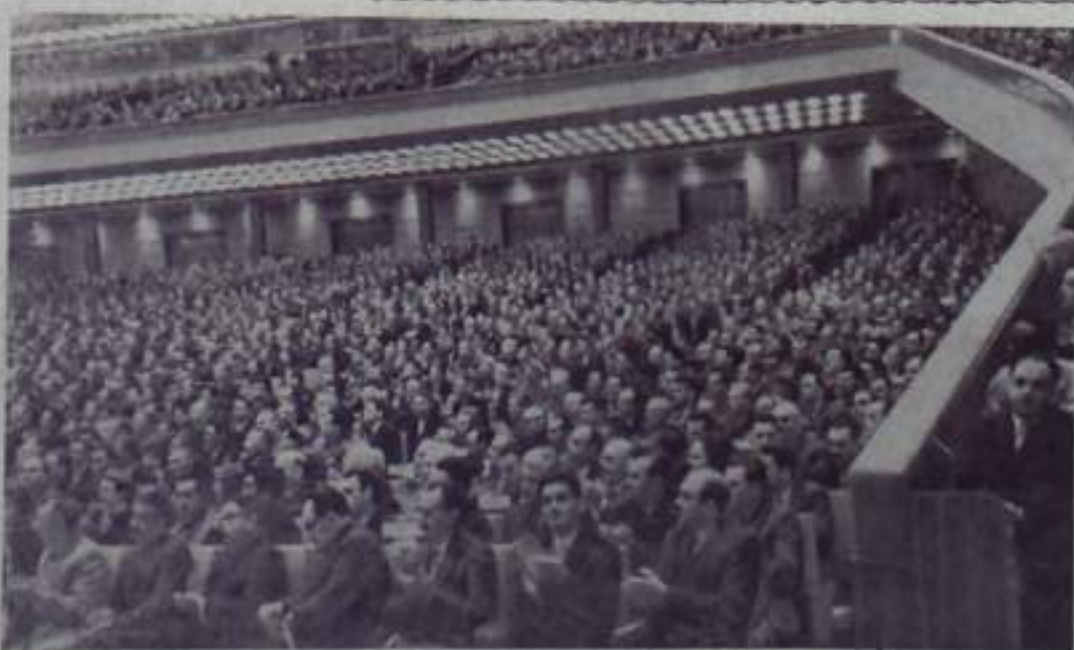
Москва. XXII съезд Коммунистической партии Советского Союза.

Наше поколение будет жить при коммунизме и чтобы приблизить это светлое будущее, я, как и все советские люди, не пожалел ни сил, ни энергии для достижения этой благородной цели.