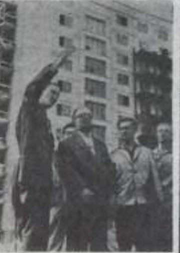
В столице Германской Демократической Республики ведется большое строительство, повсюду поднимаются высокие многоэтажные дома. Успешно продвигаются работы по созданию нового центра демократического Берлина в районе площади Александерплац. Здесь сооружается крупный массив жилых зданий. НА СНИМКЕ: обер-бургомистр Фридрих Эберт (в центре) осматривает новостройки на улице Сталиналлаге.

более открыто кричат о сплочении — целях — завоевании Германской Демократической Республики и территорий, принадлежащих Польше, Чехословакии, Советскому Союзу, Франции и другим странам. Агрессоры стремятся осуществить свои планы в первую