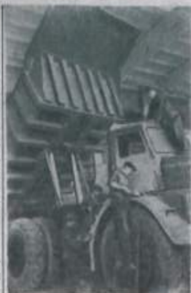
Коллектив Белорусского автомобильного завода подготовил для Выставки достижений народного хозяйства новый модернизированный 40-тонный автосамосвал «МАЗ-530». Заключаются последние отделочные работы. В ближайшее время этот гигант своим ходом будет доставлен в Москву.