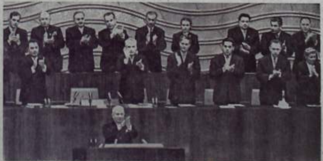
Москва. XXII съезд Коммунистической партии Советского Союза.