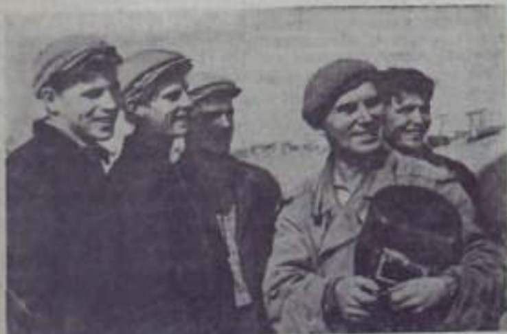
КНЕВ. На Украине сооружается пятая ступень Днепровского каскада электростанций — Киевская-комсомольская ГЭС. Уже открыт котлован под гидростанцию, намыты градательные пережки и часть правобережной плотины. Теперь строители ведут укладку бетона в основание гидротехнических сооружений.