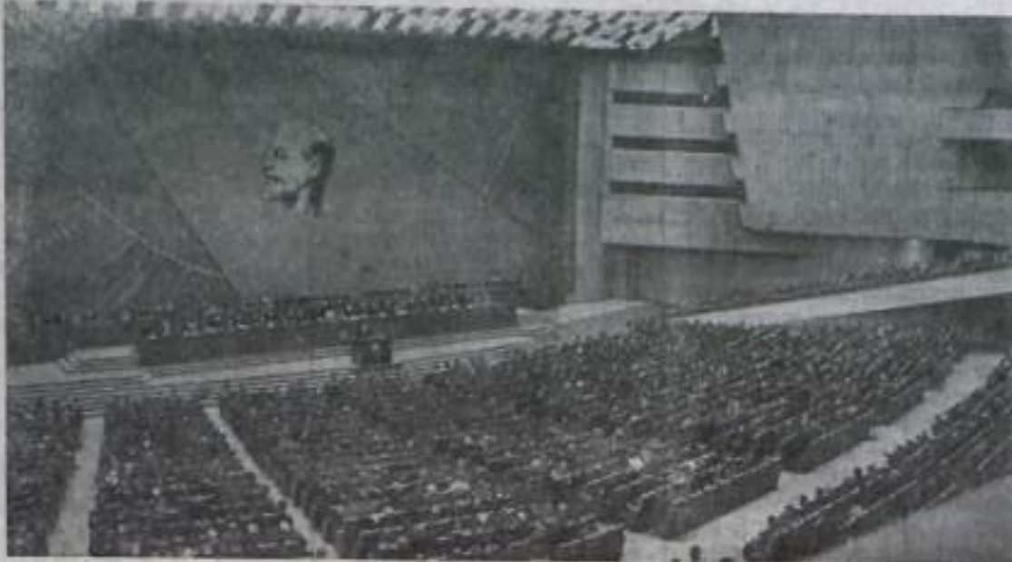
Москва. XXII съезд Коммунистической партии Советского Союза. На снимке: в зале заседаний съезда.

Делегаты нашего съезда и представители братских партий совершенно правильно говорили здесь, что албанские руководители отходят от общей согласованной линии всего мирового коммунистического движения в важнейших вопросах современности.