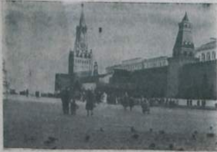
Москва. Красная площадь.