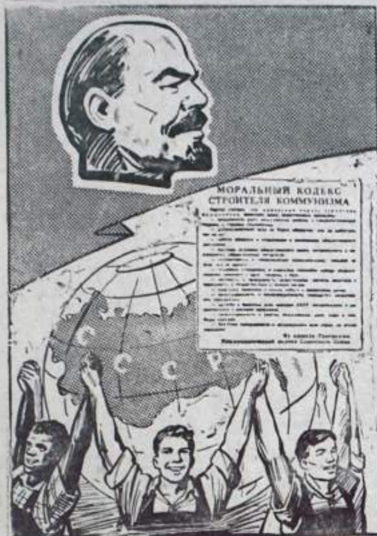
Рисунок В. Жарникова

№ 121 (1242) ВОСКРЕСЕНЬЕ 8 ОКТЯБРЯ 1961 года Цена 2 коп.