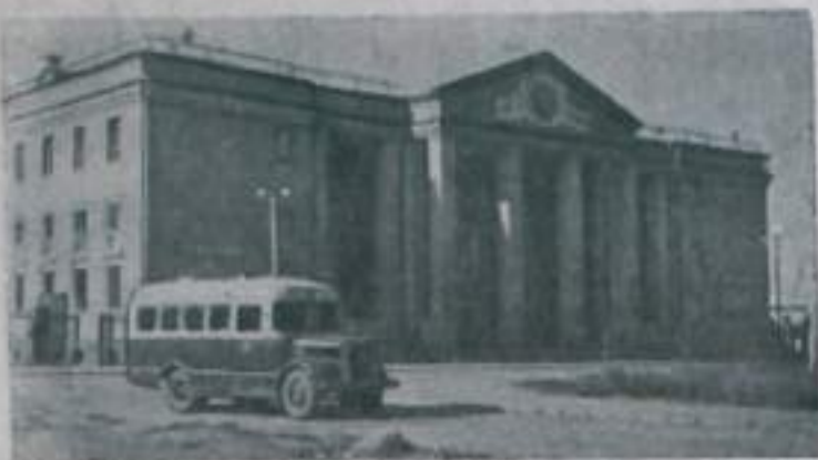
На снимке: Дворец культуры горняков города Абай.

Карагандинская область. Совсем недавно в пустынной холмистой степи на месте открытого месторождения поспевающего угля появилась рабочий поселок угольщиков Чурубай-Нура. Теперь Указом Президиума Верховного Совета Казахской ССР этот рабочий поселок переименован в город Абай. Это город нового типа с прямыми, широкими улицами, красивыми зданиями и административными зданиями, скверами и парками. Здесь работают клубы, 11 школ, 17 детских садов и школ, 4 больницы. В центре города возвышается административный Дворец культуры горняков.