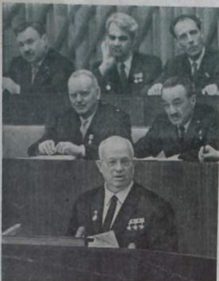
Москва. XXII съезд Коммунистической партии Советского Союза. На трибуне — товарищ Н. С. Хрущев.