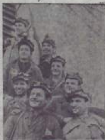
Украинская ССР. Замечательный подарок XXII съезду КПСС сделали строители Львовско-Волынского угольного бассейна. Они закончили сооружение шахты № 1 «Червоноградская». Процессы вывоза и загрузки угля на-гора автоматизированы.

Пункты проката легковых и автомобилей открываются только в крупных городах.