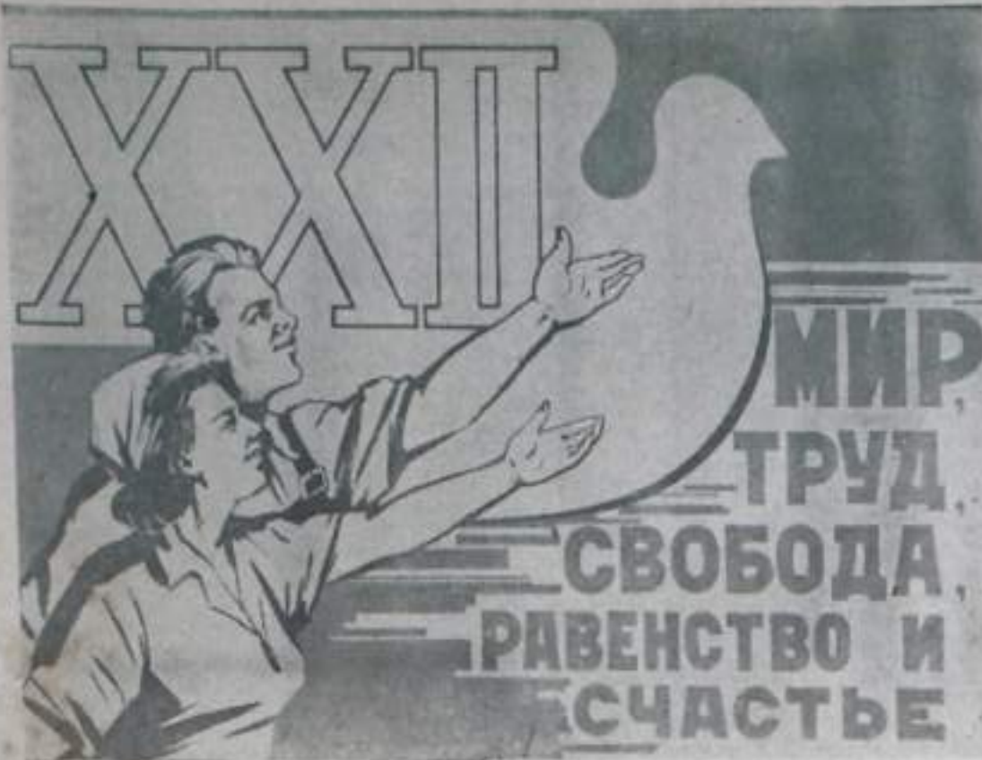
Плакаты художника Б. Антонова.