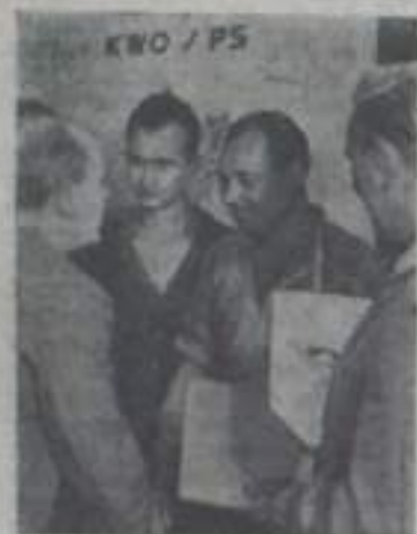
Рабочие, занятые на многочисленных предприятиях Германской Демократической Республики, самоотверженно трудятся на благо своей Родины — первого в истории страны государства рабочих и крестьян. Оберживая производственные победы, много вклад в дальнейшее укрепление народной власти и построение социализма, они приближают день заключения германского мирного договора.

Седьмого октября исполняется двенадцатая годовщина со дня образования Германской Демократической Республики — первого в истории Германии государства рабочих и крестьян. Вместе с трудящимися ГДР этот праздник отмечают народы Советского Союза, всех социалистических стран, все, кому дорого дело мира и прогресса.