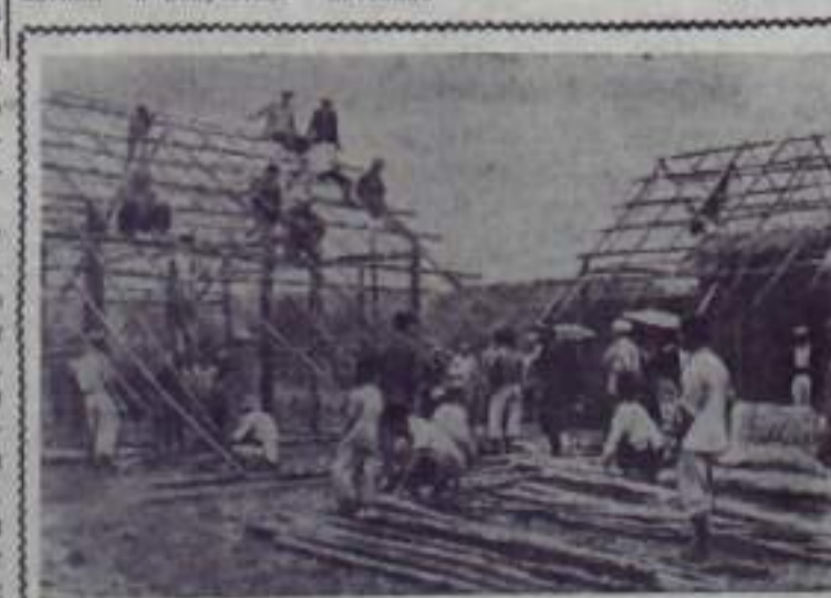
ЛАОС. Строительство начальной школы в провинции Сиенг-Куанг.

В. ШАКУРОВ, старший инспектор госнадзора.