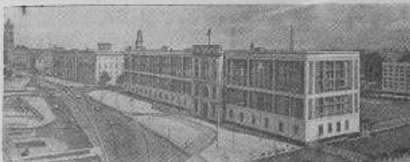
Берлин — столица Германской Демократической Республики. Новое здание Государственного совета ГДР на площади Маркс — Энгельс-плац.

7 октября 1949 года традиция Восточной Германии создали право на земельную реформу социалистическое государство.