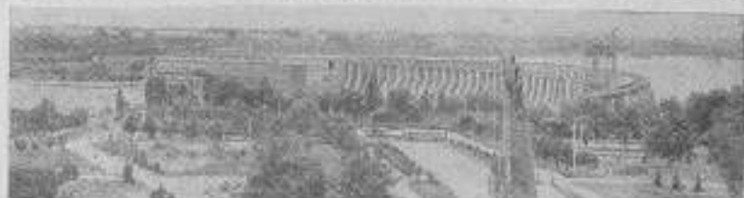
Вид на Днепропетровскую народноэкономическую школу.

Комитетом треста «Кумартау» успешно выполнена и выполнено депутатскими членами по народному контролю работу по выявлению и осуществлению Программы, по проверке фактически выполняемых директив партии и правительства.