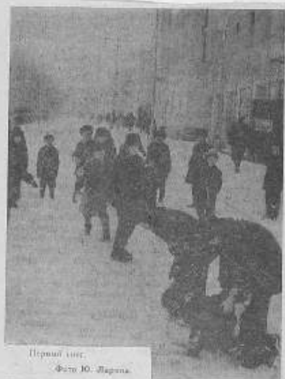
Первый шаг.

Дело подлежит рассмотре- нию в районном суде.