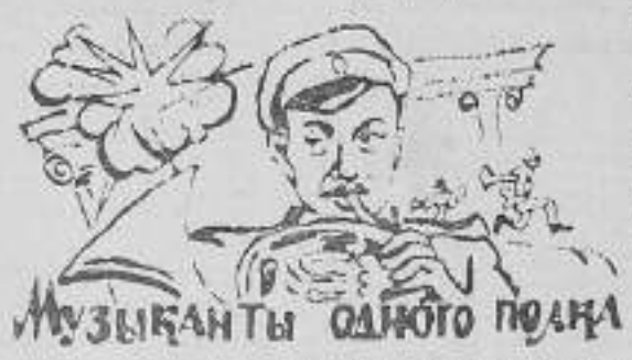
Музыканты одного подка

По приказу командования музыканты разыскивают публику. Названия должны быть, что уже сказано во городе не так, как в ряде белых деревень.