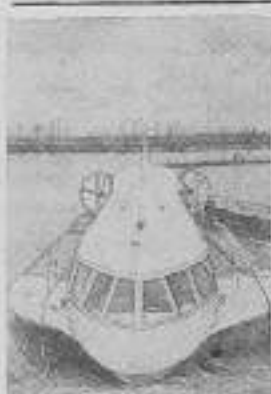
Горный. Сильно быстротечная в своем течении окрестность сохранила следы старой заводи «Нарское Сорочино».