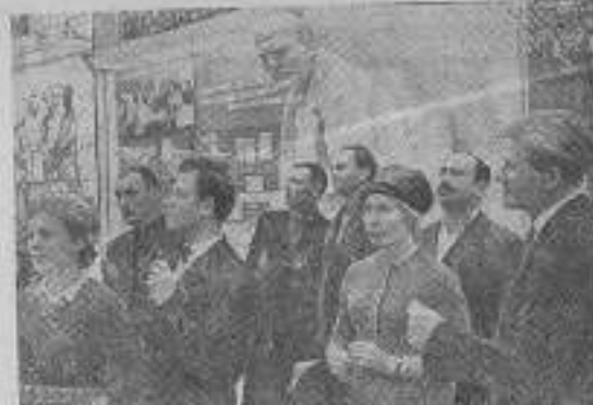
Москва. В Центральном музее В.И. Ленина проводится выставка фотографий. Она рассказывает о том, как претворилась в жизнь идея о жизни. В экспозицию включены также фотографии В.И. Ленина в связи с работой в советском Союзе в годы революции.