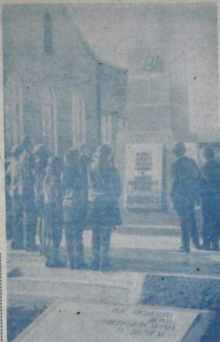
Рядом с Домом культуры в колхозе «Дружба» расположен небольшой сквер. Его границей обрамляют новые деревья. А посередине сквера вместе с памятником обелиск, сооруженный в честь земляков, погибших во время Великой Отечественной войны.

Отрадные бережко чтят память о своих отцах и старших братьях, отделивших жизнь в боях с фашистскими захватчиками.