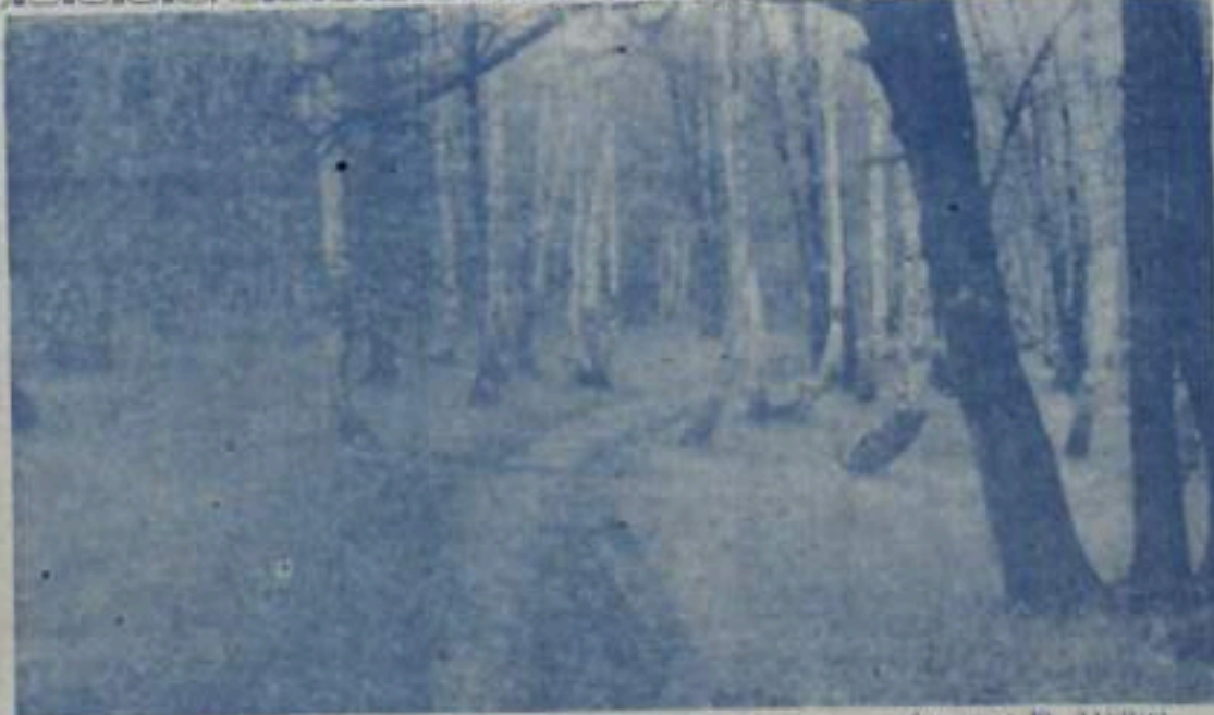
Октябрь уже наступил...