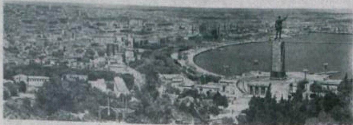
Баку — столица Азербайджанской ССР.