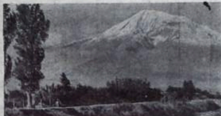
Армянская ССР. В Араратской долине.