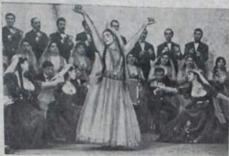
Выступает республиканский ансамбль песни и танца.

Морские нефтепромыслы Азербайджана дают примерно две трети добываемых в республике нефти и газа. Протяженность морских эстакад достигла 300 километров.