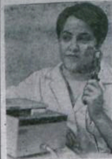
МОСКВА. Конструкторы столичного завода «ЭМА» создали интересную новинку для врачей-стоматологов — прибор АСБ-2. Он применяется для обезболивания при различных заболеваниях зубов: невралгии, острей пульпитах и т. д.