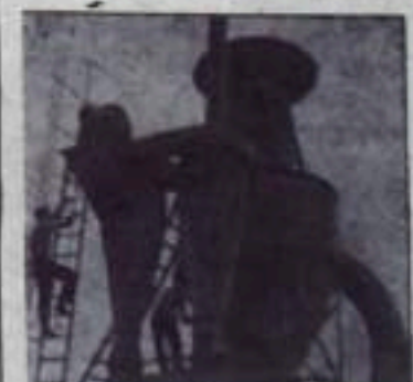
ЛЬВОВСКАЯ ОБЛАСТЬ. Завершается монтаж нового цеха по приготовлению витаминной травяной муки в колхозе «Дружба» Сокольского района.

Передовые колхозы и совхозы до наступления холодов потрудились об улучшении кормовых угодий — пастбищ и сенокосов, провели на значительных площадях мелноразливные работы. Они вовремя заезжали и установили на животноводческих фермах новые машины и механизмы — доильные аппараты, кормораздатчики, автопоилки, гидродвигатели навоза. В этом году 800 ферм было полностью механизировано. (ТАСС).