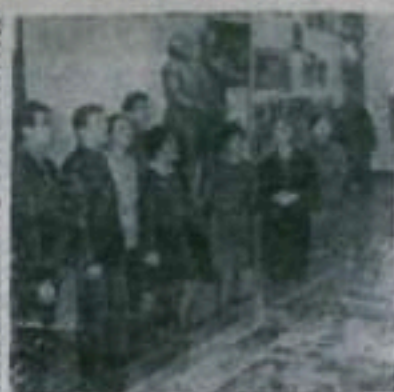
Москва, к 150-летию со дня рождения Фридриха Энгельса, которое исполняется 28 ноября этого года, в музее К. Маркса и Ф. Энгельса создана выставка «Фридрих Энгельс — вождь и учитель международного пролетариата».

Для жителей рабочего поселка Маячный и прилегающих к нему населенных пунктов открыт приемный пункт в здании домоуправления. Часы работы: с 10 до 19 часов, перерыв на обед с 14 до 15 часов. Выходные дни—воскресенье, понедельник.