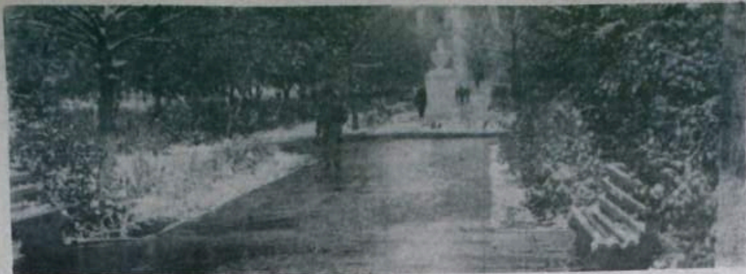
Первый снег.