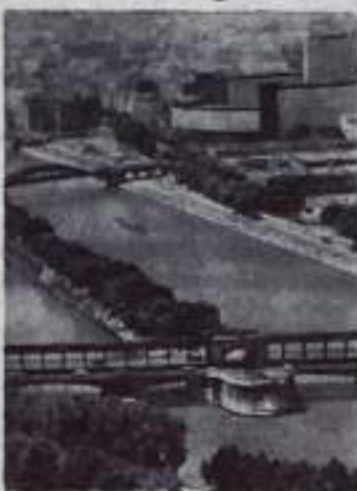
Столица Франции — Париж — один из крупнейших городов мира.