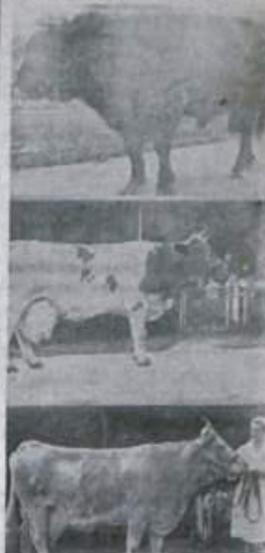
Москва. В павильон крупного рогатого скота Выставки достижений народного хозяйства СССР доставлены из передовых хозяйств страны новые экзоты — лучшие племенные животные.

«ПУТЬ ИЛЬИЧА» 3 стр. 5 октября 1971 года.