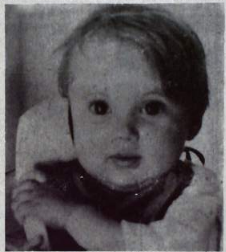
—Папа, ты скоро придешь с работы?

В настоящее время у нас имеются путевки на туристический поезд по маршруту Уфа—Волгоград—Ульяновск—Казань—Ленинград—Уфа. Поезд отправится из г. Уфы 20 ноября и вернется