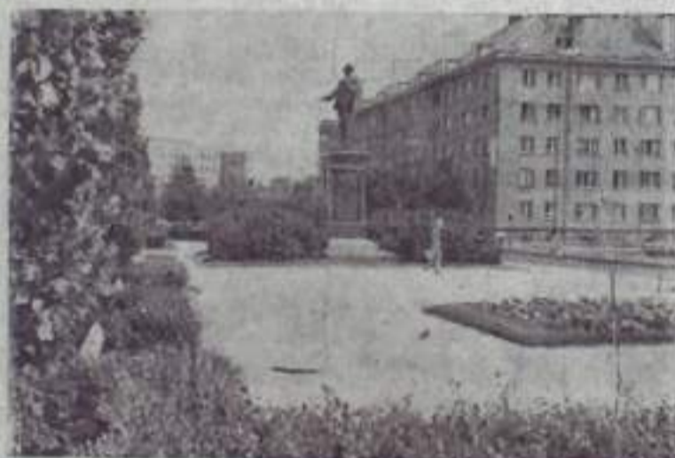
Столица Эстонской ССР

Площадь культурных пастбищ в Эстонии достигла в этом году 150 тысяч гектаров.