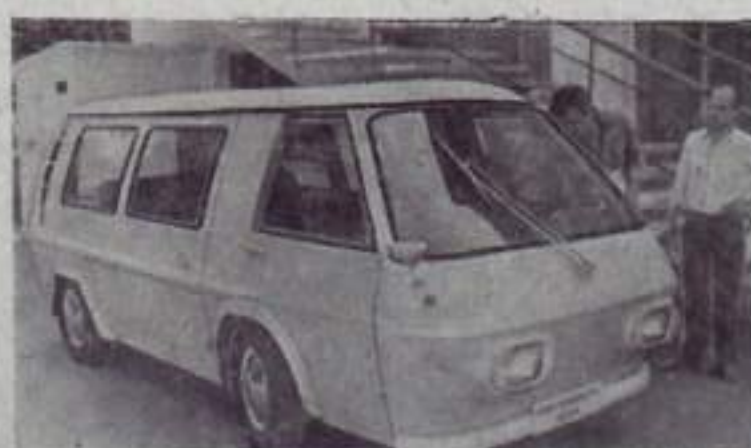
МОСКВА. Внутргородские и пригородные перевозки пассажиров и легких партий грузов — назначение нового советского электромобиля с комбинированной энергосиловой установкой. Грузоподъемность машины — 500 килограммов, скорость — 80 километров в час, запас хода — 300 километров. НА СНИМКЕ: новый электромобиль.