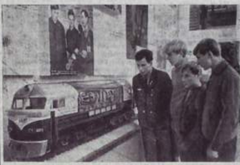
МОСКВА. На ВДНХ СССР открыта Центральная выставка научно-технического творчества молодежи. На ней демонстрируется около 10 тысяч экспонатов. НА СНИМКЕ: посетители осматривают действующую модель газотурбовоза «ГТ-1». Модель дает полное представление о взаимодействии основных узлов и механизмов газотурбовоза. Изготовлена учащимися профтехучилища № 129 (Москва).