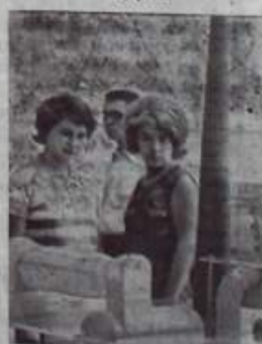
НА СНИМКЕ: в павильоне «Отдыха природы». Посетители у стенды Московского металлургического комбината. Очистные сооружения этого предприятия отличаются простотой конструкции, эффективной работой, они позволяют многократно использовать воду.