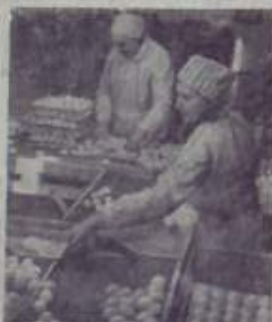
Эстонская ССР. Пятидесятилетний юбилей района — самая крупная в республике. В нынешнем году она славет государству почти 43 миллиона тонн.

Любовь к песням в Эстонии воспитывается с ранних лет, со школы. В четырехстах школьных хорах занимается 21 тысяча ребят. В июне этого года в Таллине состоялся первый Всесоюзный фестиваль самодеятельных хоров. Он был посвящен 50-летию СССР.