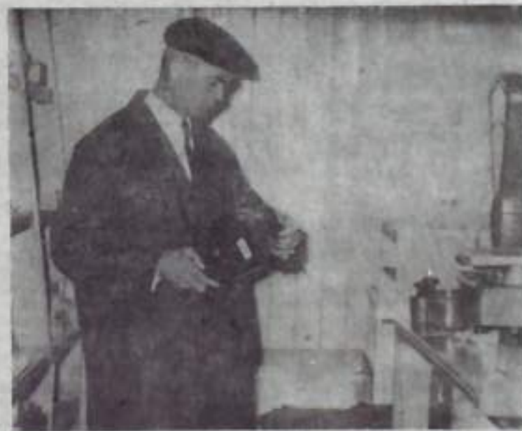
Сложно и кропотлива работа сотрудников уголовного розыска. В любое время дня и ночи им приходится выискивать на месте происшествия и уже там по едва заметным следам распутывать запутанные преступления.