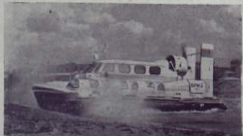
«Брис» — так назвали рационализаторы одного из ленинградских заводов построенный ими на базе серийно выпускаемого советской промышленностью аэросаней оригинальный аппарат на воздушной подушке. Он предназначен для поездок на небольшие расстояния. Воздушная подушка создается двумя блоками центробежных вентиляторов, которые приводятся в действие двигателями от автомобиля «Москвич-107». «Брис» способен перевозить по суше и по воде до десяти пассажиров со скоростью около ста километров в час. НА СНИМКЕ: «Брис» выходит на берег.