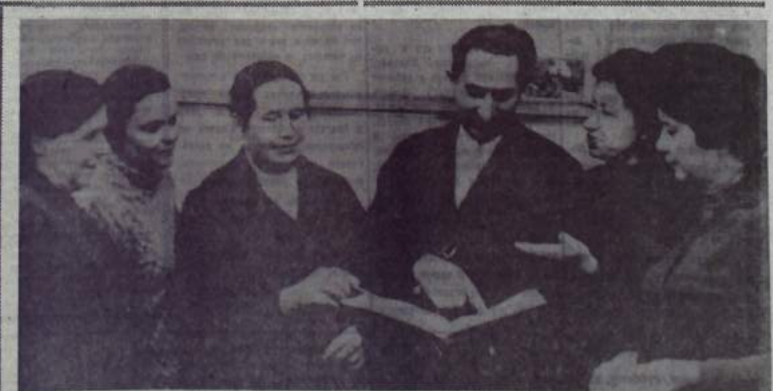
Вместе с преподавателями-предметниками завтра будут принимать поздравления по случаю праздника и воспитатели, оказывающие большую помощь детям.