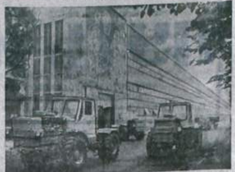
На Харьковском тракторном заводе построен гигантский цех, где расположен главный конвейер по сборке тракторов «Т-150».