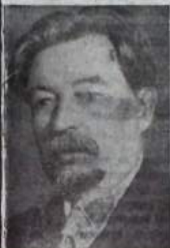
В. Я. ШИШКОВ

3 октября исполняется 100 лет со дня рождения выдающегося советского писателя Вячеслава Яковлевича Шишкова (1873—1945). Многогранная Россия прошлого и нашей Советская Россия — вот главные темы произведений писателя.