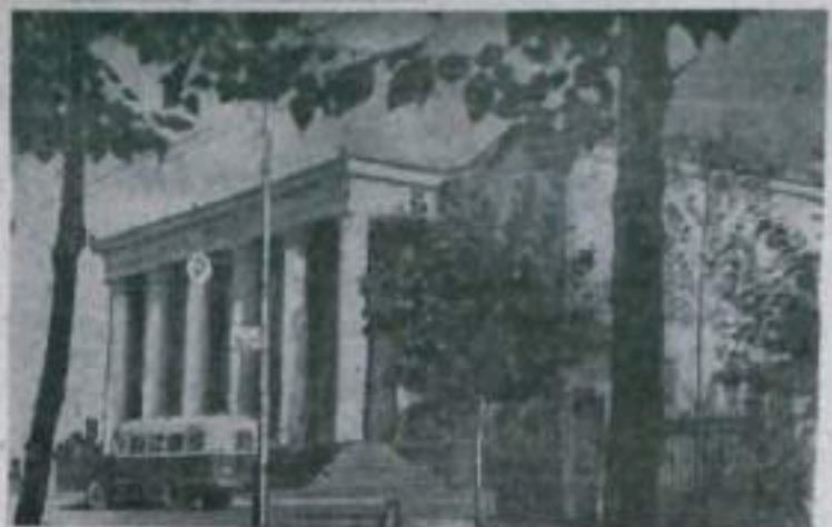
Дворец культуры угольщиков в нашем городе.