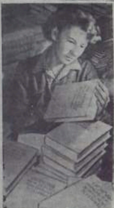
МОСКВА. В полку учебному году в сети партийного просвещения типография «Пролетарий» выпускает книгу «Основы марксистско-ленинской философии». Ее тираж — 100 тысяч экземпляров.

Одновременно агитаторы знакомят строителей с текущими событиями в стране и за рубежом, итогами работы июльского Пленума ЦК КПСС, с докладом и выступлением Н. С. Хрущева по вопросам укрепления мира между народами.