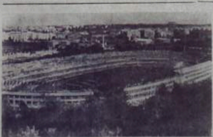
Рим. Общий вид Олимпийского стадиона во время XVII Олимпийских игр.

Во дворе сохранили все дворные постройки, колодец, площадку для игр и 186-летний вяз, под которым стоит беседка — любимое место отдыха семьи Ульяновых. Отсюда туристы проходят на ул. Ульянова к домику, в который в 1869 году из Нижнего Новгорода приехал с семьей Илья Николаевич Ульянов. Это небольшой деревянный двухэтажный дом с палисадником. Семья Ульяновых поселилась во флигеле. Здесь в 1870 году и родился Владимир Ильич.