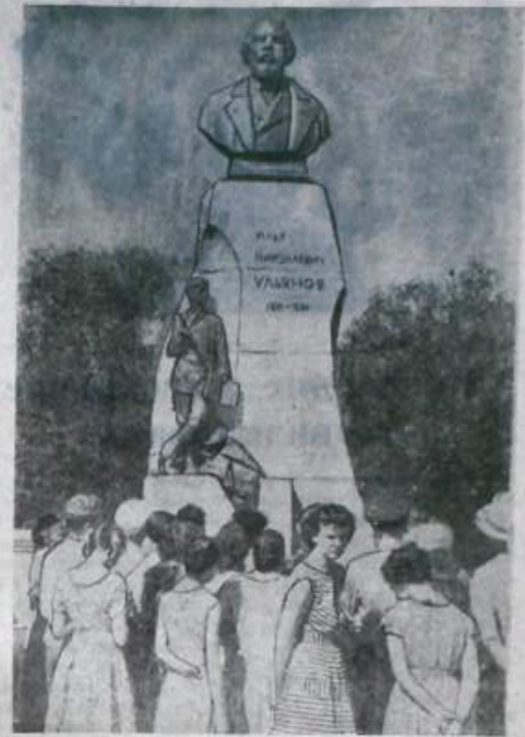
Памятник И. Н. Ульянову в г. Ульяновске.

Вокруг революции и пролетариата изображен в полный рост. В левой руке он держит кошку. Накинутое на плечи пальто цветает ветер. Взгляд вождя устремлен вправо — в будущее человечества. Памятник открыт 22 апреля 1940 года (проект заслуженного деятеля искусств профессора Манизара).