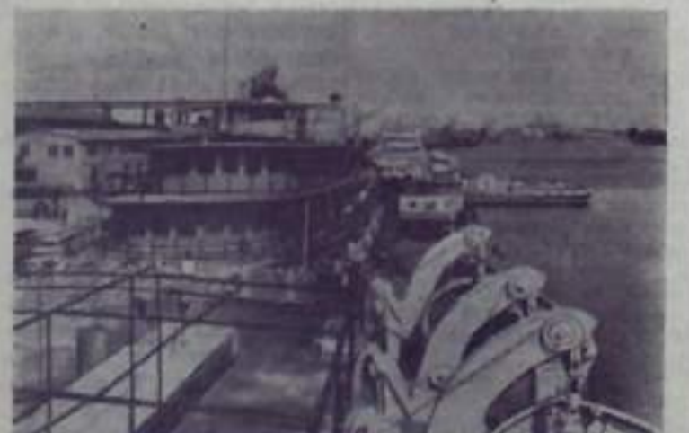
Чехословацкая Социалистическая Республика. На судостроительном заводе в Комарно на Дунае строится пассажирские и товарные речные теплоходы. Многие суда предназначаются для экспорта в Советский Союз. К концу третьей пятилетки — 1965 году — судостроители увеличат выпуск продукции на 200 процентов.