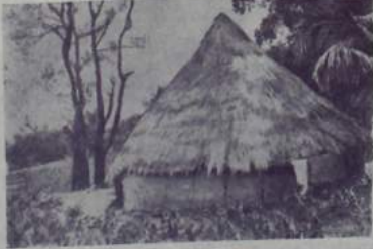
ГВИНЕЙСКАЯ РЕСПУБЛИКА. Типичная хижина местного жителя в селе близ Конакри.