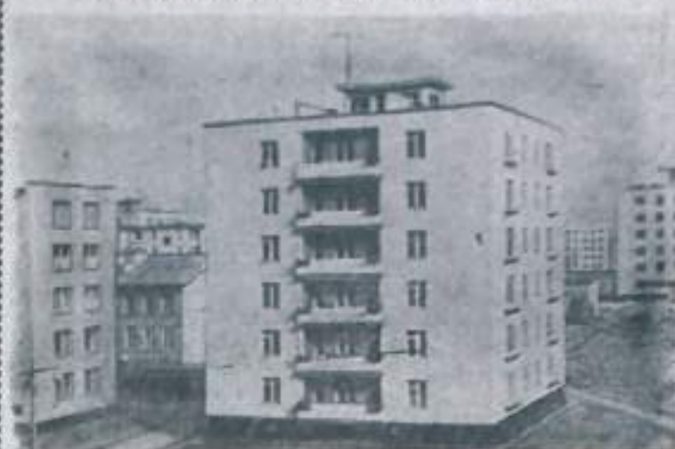
Ленинград. Впервые производство газобетонных деталей в масштабах из них жилых домов в городе были освоены Автозаводским жилищно-строительным комбинатом. В настоящее время этот метод строительства получил широкое распространение. Четыре типа жилых домов разработаны мастерской № 7 «Ленпроект». На снимке: ансамбль домов из газобетона по Южному шоссе. Фото П. Машинцева. Фотохроника ТАСС.