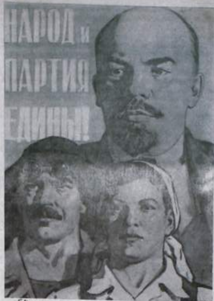
Плакаты художника В. Вазюва.