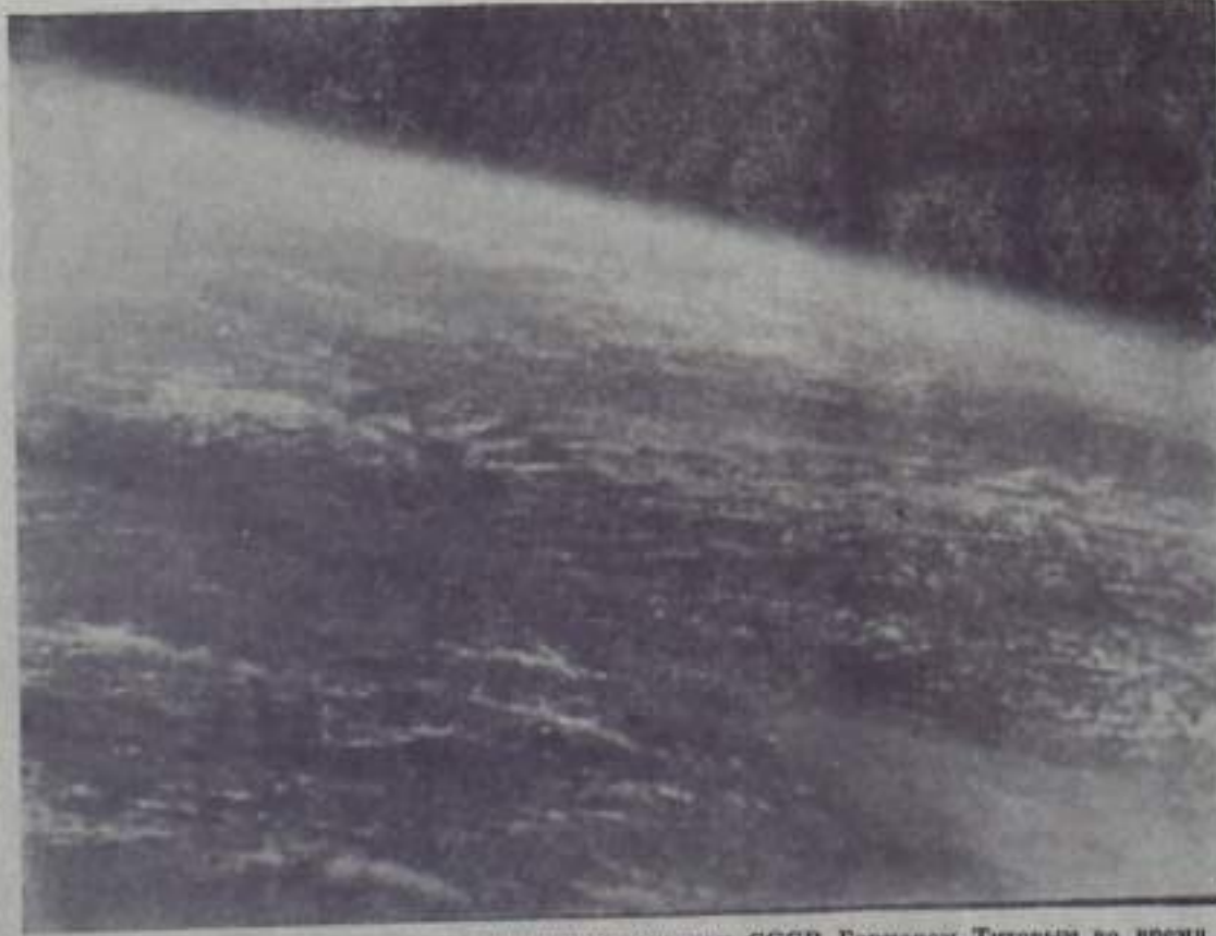
Один из снимков, сделанных летчиком-космонавтом СССР Германом Титовым во время полета на корабле-спутнике «Восток-2». На снимке зачетлены выпуклость нашей планеты и ореол, которым она окружена.

ОТКРЫТА ПОДПИСКА на газеты и журналы социалистических стран: «Болгария», «Венгерские новости», «Германская Демократическая Республика», «Китай», «Народная Румыния», «Новая Албания», «Польша», «Социалистическая Чехословакия» и другие. ПОДПИСКУ МОЖНО ОФОРМИТЬ во всех почтовых отделениях, конторе связи, у почтальонов и общественных распространителей на предприятиях.