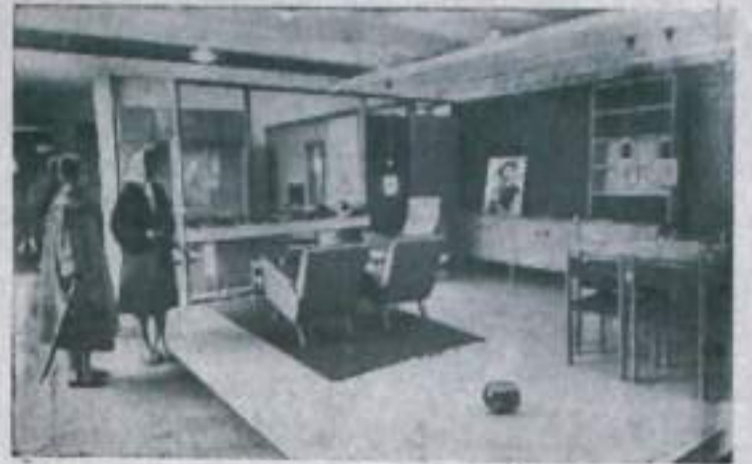
Эстонская ССР. В Таллине открылась республиканская выставка «Мебель и хозяйственные товары». На ней представлены изделия экспериментальной мебельной фабрики «Стандарт», Таллинской фанерно-мебельной фабрики, Гагусского и Парнуского лесоконбинатов, Таллинского художественного комбината и многих других предприятий республики. Выставка дает наглядное представление о том, что будет выпускать деревообрабатывающая промышленность республики в ближайшее время.

Строго соблюдайте правила пожарной безопасности. Заранее отремонтируйте печи и другие отопительные приборы.