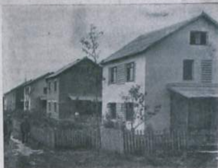
Смоленская область. В колхозе столовая, магазин, детские учреждения «Рассвет» Ельнинского района с помощью преподавателей и студентов Московского архитектурного института разработал генеральный план строительства нового колхозного села. По плану на центральной усадьбе будет построено около трехсот двух- и трехэтажных благоустроенных жилых домов, Дворец культуры.

С большой силой в проекте Программы КПСС говорится о важности всестороннего и гармонического развития человеческой личности. Социализм впервые создал возможности воспитания нового человека, гармонически сочетающего в себе духовное богатство, моральную чистоту и физическое совершенство. Условия для такого развития человека созданы историческими завоеваниями советского народа. Наши люди навсегда освобождены от эксплуатации, от дискриминации по признакам пола, происхождения, национальности, расы, их не страшит безработица и нищета.