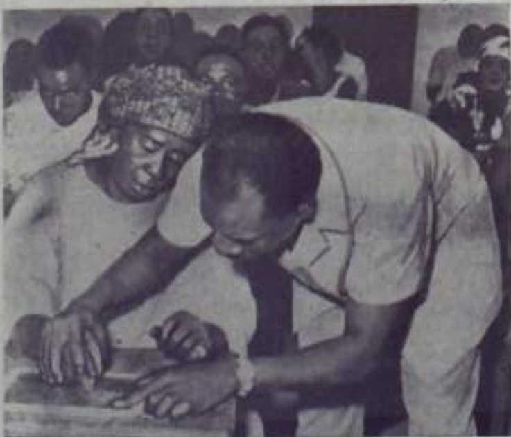
В Мали при колхозном режиме 92 процента населения было неграмотно. Сейчас правительство страны способствует движению за ликвидацию неграмотности.

Дело подлежит рассмотрению в нарсуде г. Кумертау, БАССР.