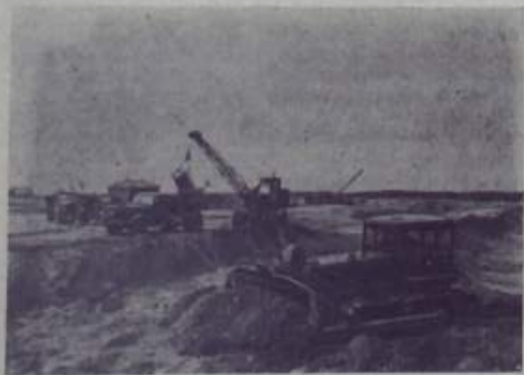
Калининская область. В Калининском районе сооружается одна из крупнейших в мире тепловая электростанция мощностью в 2.800.000 киловатт.