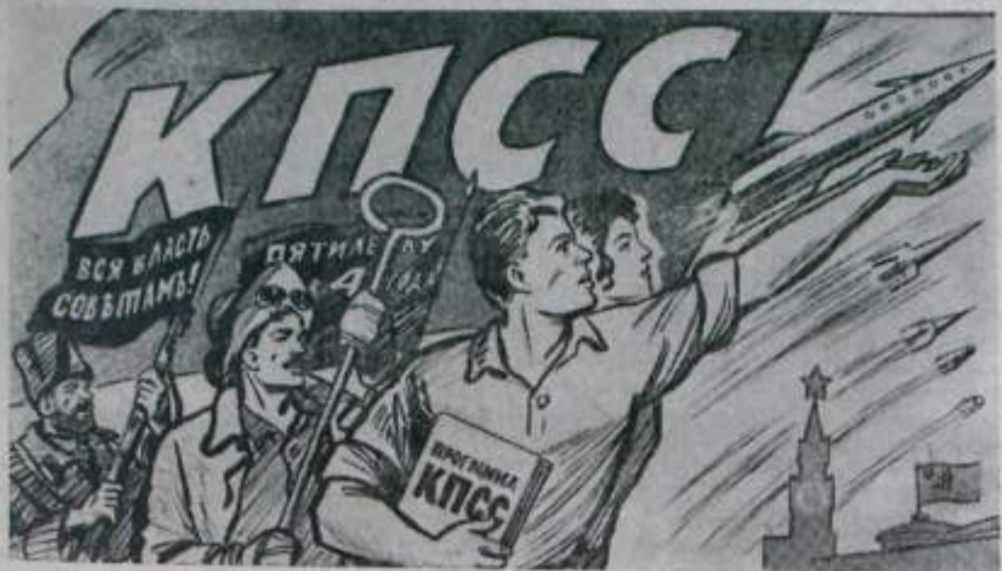
Рисунок В. Жарикова.

№ 107 (1228) СРЕДА, 6 сентября 1961 года Цена 2 коп.