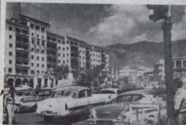
Снимки, сделанные корреспондентом Польского Центрального Фотоагентства, показывают здания в центре Каракаса и шалаша у своих хижин, сделанных из пальмовых листьев.

Венесуэла — страна контрастов. Здесь в предельной близости уживаются богатство и бедность, роскошь и нищета. В центре Каракаса — небоскребы, в которых размещаются нефтяные компании, банки и многоэтажные жилые дома со всеми удобствами для богатых. На окраинах и за чертой столицы — жалкие лачуги, в которых ютятся бедняки. Многие из них работают на нефтепромыслах, другие добывают хлеб тяжелым трудом на полях.