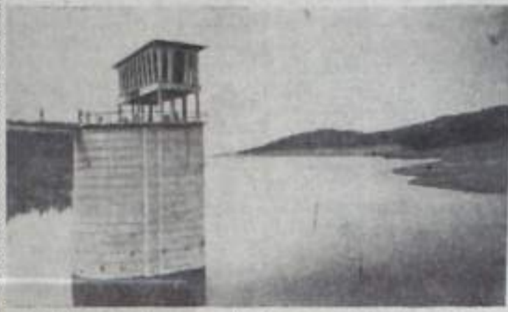
В Народной Республике Болгарии за последние годы создано свыше двух тысяч больших, средних и малых искусственных водохранилищ. Крупные электростанции в районах существующих водохранилищ дают ныне стране электроэнергии в 20 раз больше, чем до войны. На снимке: водохранилище «Батак».