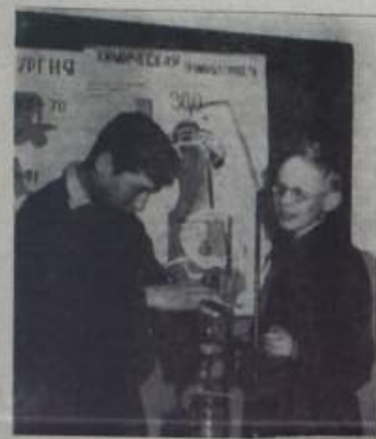
Юные техники станции охотно занимаются в кружке моделированием в средней школе № 1.

На снимке: новая школа в рабочем поселке Ермозово.