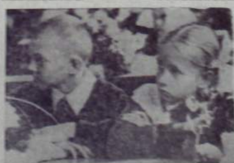
Вопросы по учебнику.