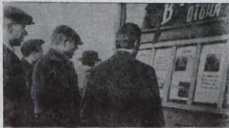
У витрины городской сатирической газеты «В породный отвал».

Об этом говорит снимок, помещенный в стенгазете «В породный отвал». Правда, на снимке что-то не видно изобилия, мустов золотистой породными, багровыми сортами малины, крыжовника. После — в засылающей ботве картофеля. Еще в апреле строители треста «Кумертаустрой» заложили фундамент под телемачту, начали кирпичную кладку и ушли. Подпись под снимком во второй колонке гласит: