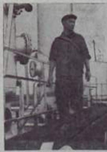
Куйбышевская область. Коллектив первого промысла управления «Ставропольнефть» борется за звание передовички коммунистического труда. Став на трудовую вахту в честь XXII съез-

ЮЖНО-САХАЛИНСК. На острове Итуруп вступила в строй вторая очередь рыбодобывочного завода. Теперь это — самое крупное предприятие по производству рыбных запасов на Дальнем Востоке. Всего в Сахалинской области сейчас выращивается в искусственных условиях около 200 миллионов мальшков.