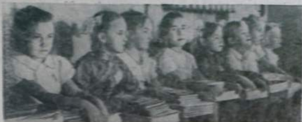
Воспитанки детского сада №6 города Ставкэ (Кабардино-Балкарская АССР).

Из центра Горняк: Государственный орган Советов Союза.