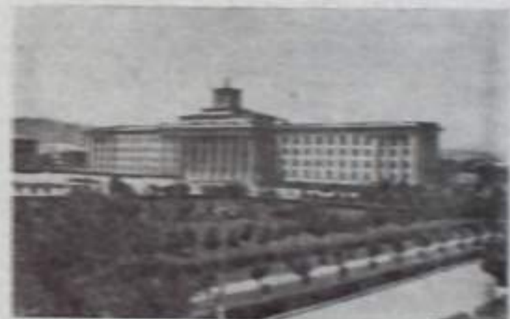
НАЛЬЧИК. Дом Советов на проспекте имени Ленина.