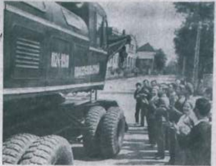
ОДЕССА. Стремлясь достойно встретить XXII съезд КПСС, комсомольцы завода подъемных кранов из сэкономленных материалов изготовили 12-тонный подъемный кран. Молодые производственники передали его ударной комсомольской стройке — строителям Грушевского горнообогатительного комбината в городе Марганец Днепропетровской области. НА СНИМКЕ: кран отправляют на стройку.