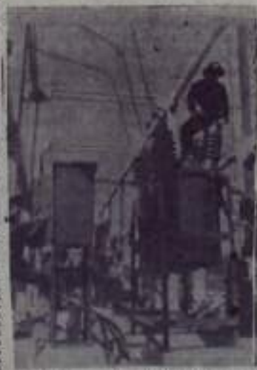
Монтаж оборудования на электростанции в Кам Фи.

*Только за 1961 год в ДРВ вступили в строй 16 новых промышленных предприятий.