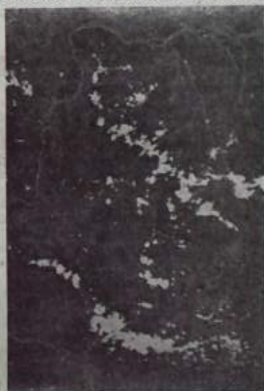
Снимок сделан летчиком-космонавтом И. Р. Поповичем с борта космического корабля «Восток-4». Белыми извилистыми лентами выглядят реки в высоты космического полета.