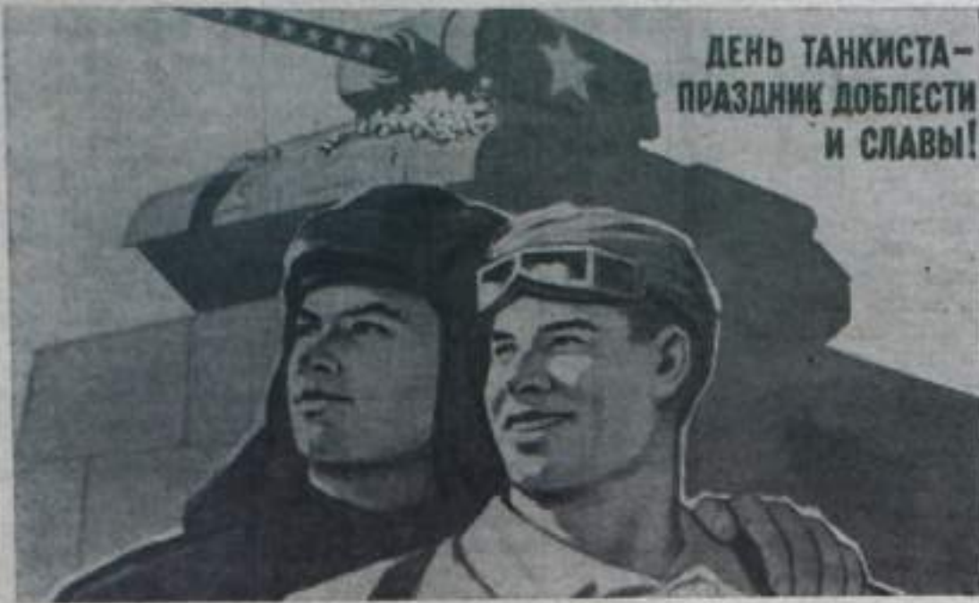
ДЕНЬ ТАНКИСТА — ПРАЗДНИК ДОБЛЕСТИ И СЛАВЫ!