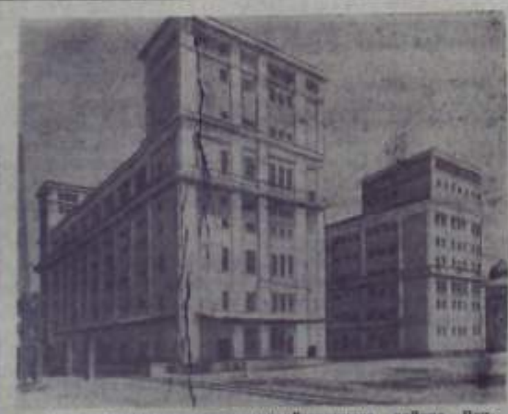
В центре крупного сельскохозяйственного района Венгерской Народной Республики Момонмажароваре завершено строительство нового шестизатяжного зернохранилища. Его вместимость 1.300 вагонов зерна. Проведение и засыпка зерна производится автоматически. Зернохранилище полностью готово к приему нового урожая.

Ускорились темпы жилищного строительства. За полгода государственные строительные предприятия построили квартир в полтора раза больше, чем за первое полугодие 1961 года.