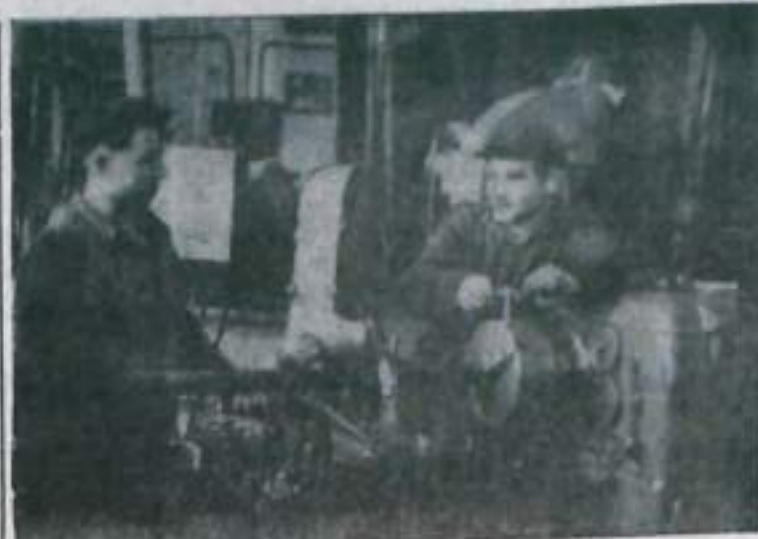
Хорошее трудовое содружество установилось между токарями и ремонтниками депо погрузочно-транспортного управления комбината «Башкируголь».

В мальчишеском детдоме коллектив воспитателей в основу своей воспитательной работы положил чуткое, внимательное отношение к детям. Дети любят воспитателей, послушны им, выполняют