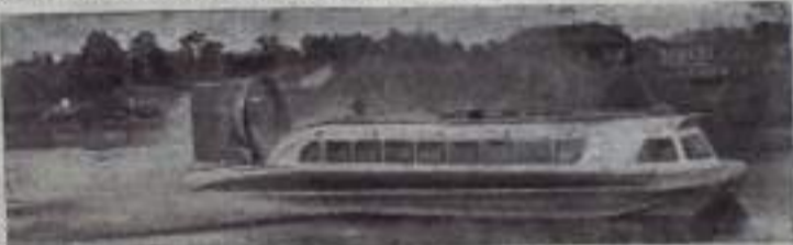
Начались испытания на воде крупнейшего в мире судна на воздушной подушке. Этот парящий корабль, сооруженный экспериментально-исследовательским заводом Ленинградского института водного транспорта, будет курсировать на речках любой глубины. Он сможет легко преодолевать пороги и мел, опираясь на поток нагнетаемого под днище воздуха, и будет развивать скорость до 60 километров в час.

В конструкторском бюро, руководимом М. А. Милем, создан огромный вертолет «МИ-6», который способен перевозить на многие сотни километров большие грузы и приземлиться в самых недоступных местах. В семействе вертокрылатых появились также две новые универсальные машины — «В-8» и «В-9».