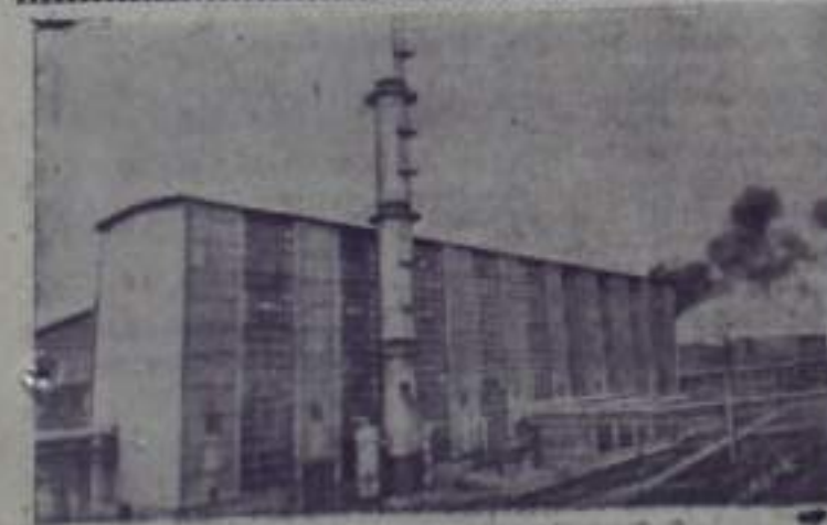
НА СНИМКЕ: один из участков комплекса цехов полиптилена.