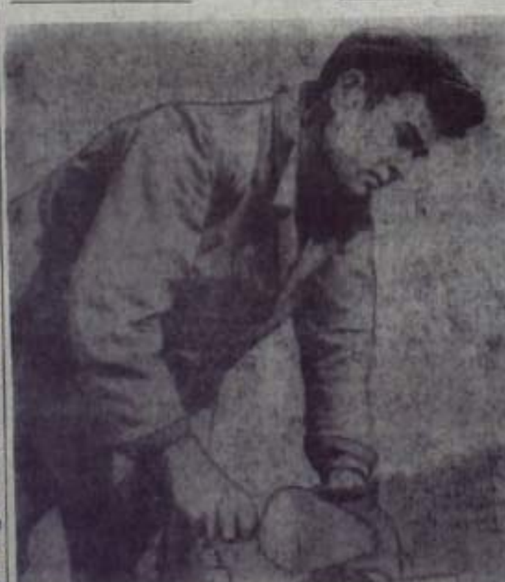
С каждым годом хорошеет и благоустраивается наш город. Чище и опрятнее становятся улицы, строятся новые дома. И главная заслуга в этом — строителей.

Долг каждого взрослого жителя, пионера — принять самое активное участие в осеннем озеленении города.