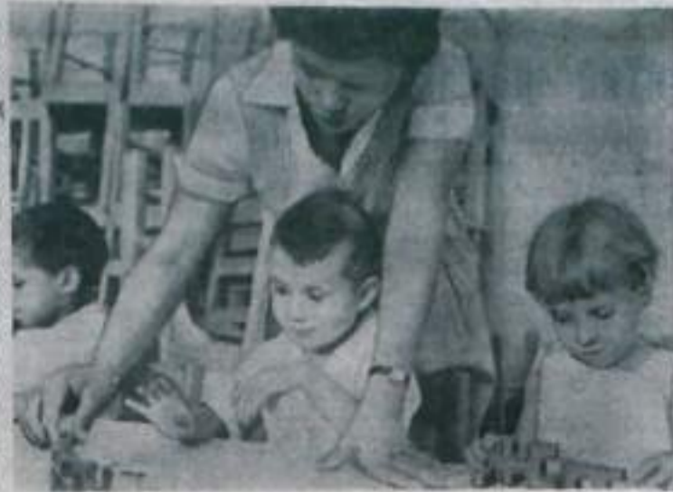
Вниманием и заботой окружил кубинский народ свое молодое поколение. Для малышей созданы детские сады и ясли, где они находятся под наблюдением воспитателей, пока их матери заняты на работе.

На снимке: в одном из детских садов Гаваны.