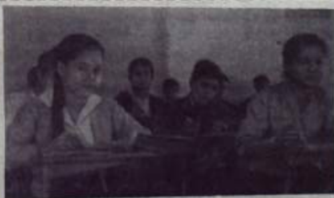
Лаос. Будущие учителя на занятиях.

Следующая игра на первенство республики состоится завтра. Команда «Шахтер» на своем поле примет футболистов Серафимовки.