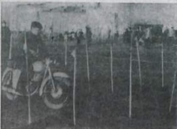
На снимке: мотофигурист выполняет упражнение «Зигзаг».