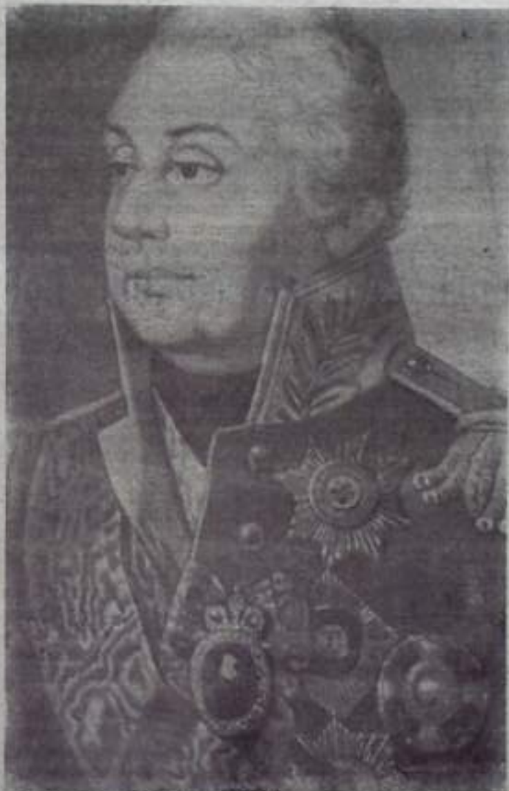
Великий русский полководец Михаил Илларионович Кутузов (1745—1813 гг.).