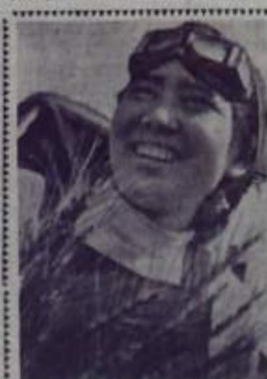
Целинный край. Познавший «Беларусь» уверенно ведет жат-

Кончилось дело, многие вернулись на отпусков полные сил и желания работать, учиться, культурно отдыхать. Все прошедшее становится дном и вечером. Теперь уже не каждому захочется поехать к реке или на пруд. Вечерами и в выходные дни трудящиеся пойдут в клубы, во Дворец культуры, в кинотеатр, в библиотеки. Нужно будет так организовать в них работу, чтобы посетив, например, несколько раз университет культуры, слушатели не «охладели», не почувствовали штампа. А для этого нужно объединить силы учреждений культуры, помогать друг другу, ибо для и день искать все новые и новые творческие резервы, все более интересные формы работы.