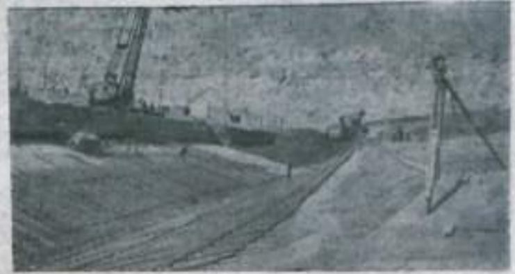
САРАТОВСКАЯ ОБЛАСТЬ. Десятки тысяч кубических метров бетона уложены в фундамент будущего здания Саратовской ГЭС. В настоящее время строители возводят железобетонные плиты водобоя, толщина их 2,5 метра.