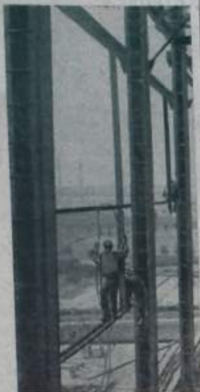
Оренбургская область. В Орске вступила в строй четвертая очередь ТЭЦ. Мощность станции увеличена на одну треть. Сейчас здесь сооружаются котлы высокого давления, где будут установлены дополнительные котлы высокого давления. Работы ведутся быстрыми темпами.

(1961—1965), который будет иметь решающее значение для индустриализации страны. В одном строю с братскими странами мировой социалистической системы народная Болгария выступает за проведение в жизнь ленинских принципов мирного сосуществования государств с различным общественным строем, за укрепление мира во всем мире. С каждым годом крепнет и развивается нерушимая дружба болгарского и советского народов. Яркой ее демонстрацией явился визит в Болгарию советской партийно-правительственной делегации во главе с товарищем Н. С. Хрущевым.