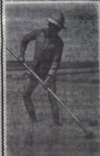
Индонезия. Крестьянин на рисовом поле. В стране получают по три урожая риса в год.

Райкомам, горкомам КПСС, исполкомам районных и городских Советов, Министерству производства и заготовки сельскохозяйственных продуктов, комбинату «Башлес», управлению строительства и ремонта автомобильных дорог к 25 октября 1962 года необходимо представить обкому КПСС и Совету Министров отчет об итогах проведения месячника леса и сада.