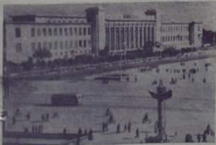
ПЕКИН. Здание национальных музеев китайской истории и революции на площади Тяньаньмынь.