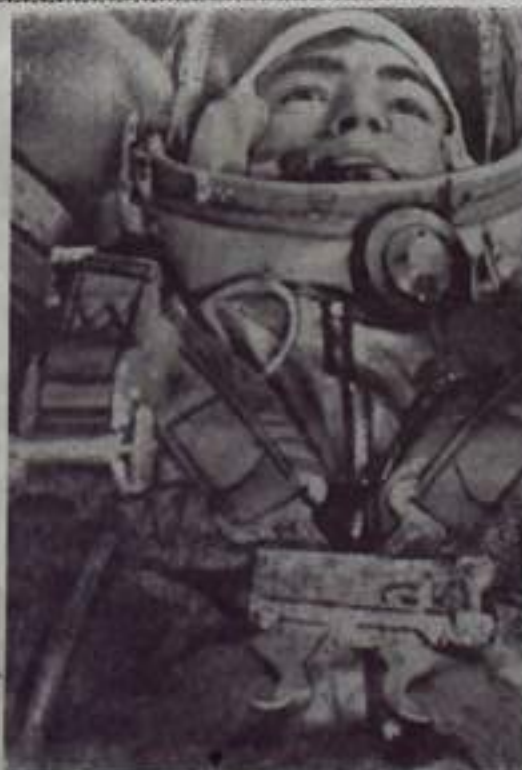
Летчик-космонавт А. Г. Николаев во время космического полета. Съемка произведена фотоаппаратом, который был установлен в кабине корабля «Восток-3».