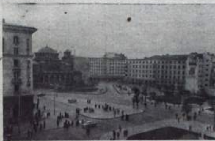
Площадь имени Ленина в Софии.