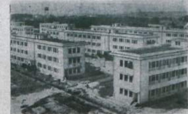
Новые корпуса студенческих общежитий.

зом жизни стран социалистического лагеря. Воле одной из них особенно многолюдно — там были вывешены фотоиллюстрации о победах Советского Союза в строительстве коммунизма и освоении Вселенной. На стенах знакомые лица советских космонавтов.