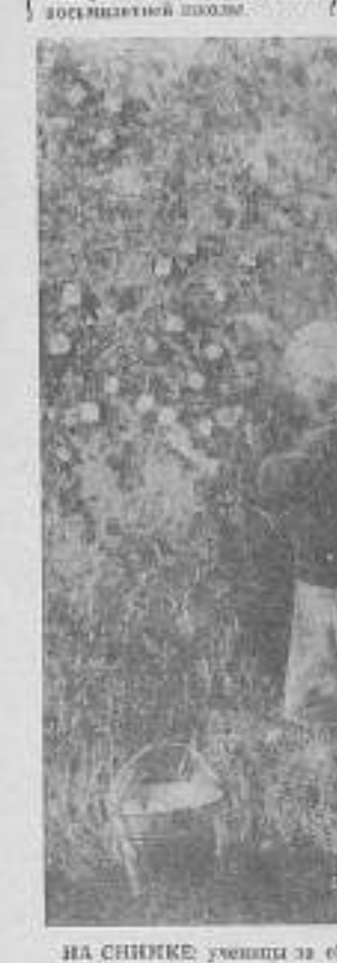
НА СНИМКЕ: ученица за сбором яблок.

В саду коллектив «Дружба» который занимается 17 гектарами, выработкой хороших яблок абрикосов.