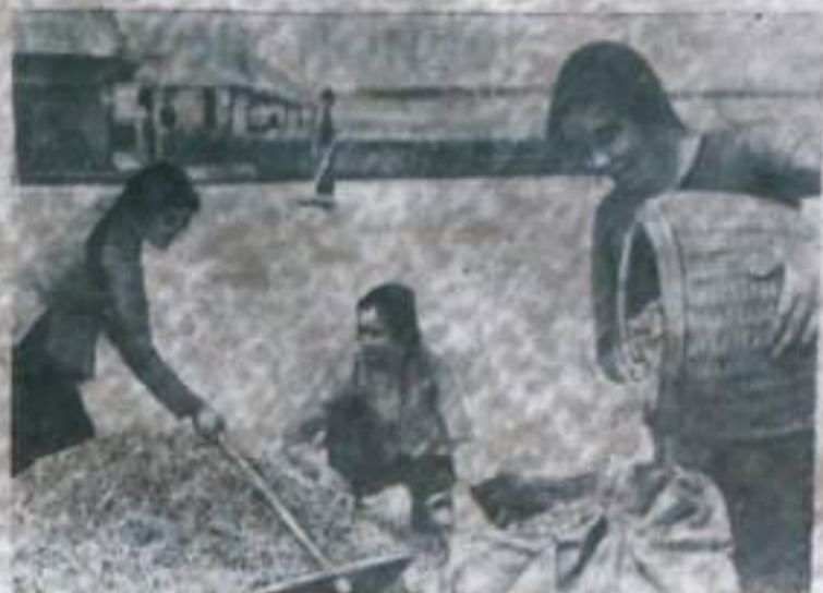
Демократическая Республика Вьетнам. Члены сельскохозяйственного кооператива в деревне Бич Сан (провинция Хабак) почти на 30 гектарах вырастили хороший урожай арахиса. Государству уже продано 55 тонн земляного ореха.