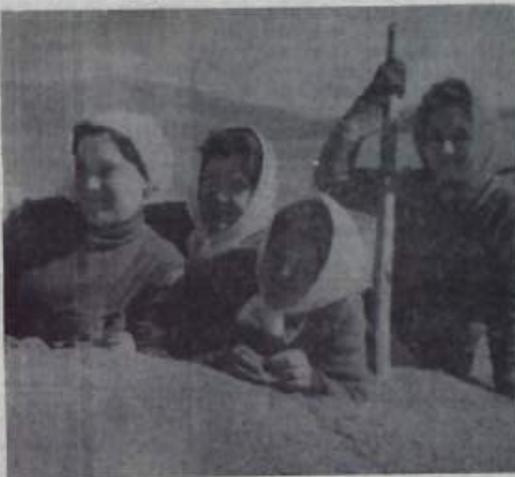
НА СНИМКЕ: студентки Башгосуниверситета, принимавшие участие на уборке урожая.