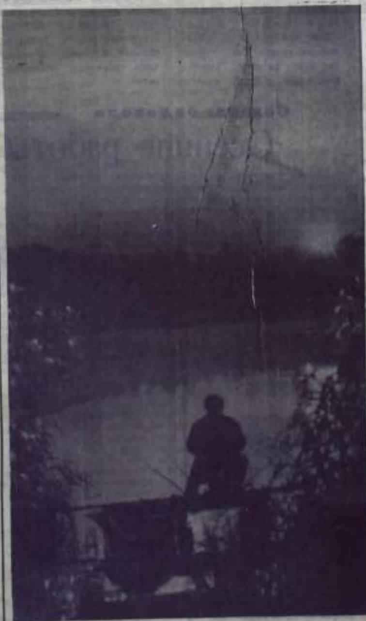
Рыбачье утро.