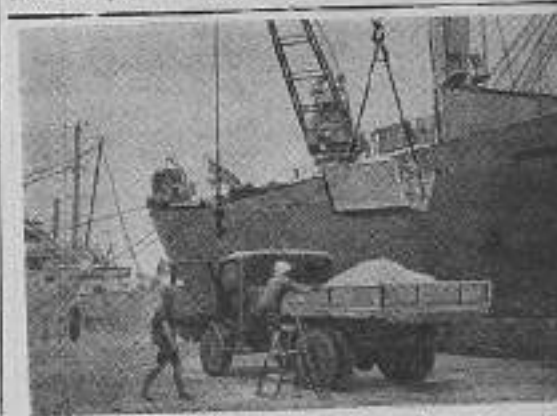
Демократическая Республика Вьетнам. Советский корабль «Металлург Курано» выгружает в Харьков удобрения и металл.