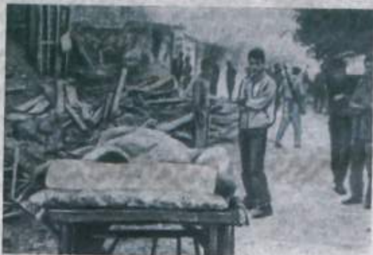
ТУРЦИЯ. В Восточной Анатолии в районе Эрзурума произошло сильное землетрясение, крупнейшее за последние 23 года. В пострадавшем районе все время продолжаются подземные толчки. Полностью разрушенный город Варто вновь подвергся землетрясению. НА СНИМКЕ: на расчистке улиц в Варто.