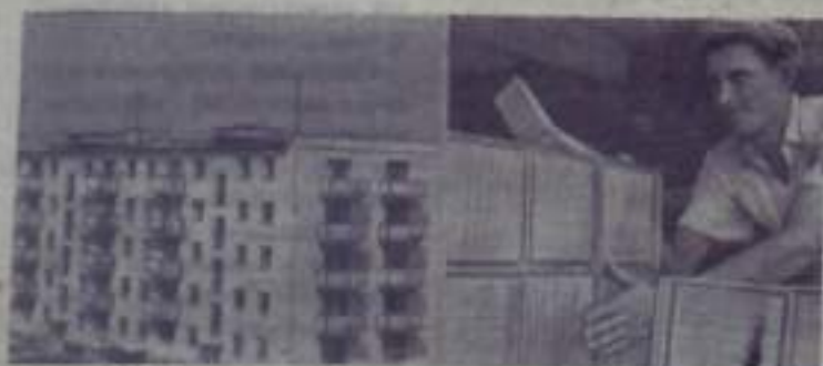
Челябинская область. В селе Брененкуль Сосновского района сооружается центральная усадьба молочно-пашенного совхоза «Митрофановский».

старший инженер-землеустроитель сельхозуправления.