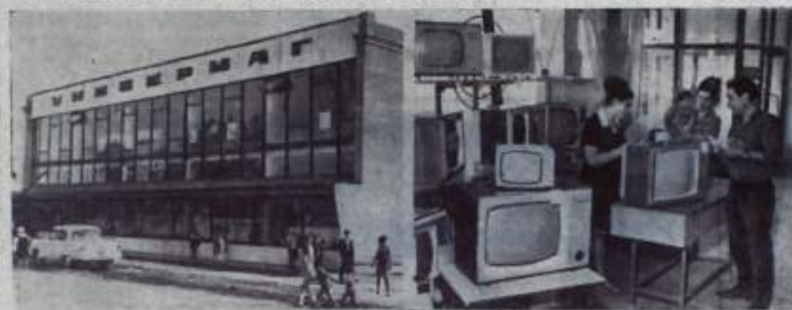
С каждым годом на селе расширяется торговая сеть потребительской кооперации. В Адыгейской автономной области, например, за последние пять лет дано в эксплуатацию 100 новых торговых объектов, ежегодный товарооборот их составляет 80 миллионов рублей.