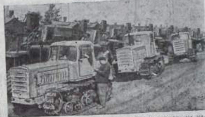
Доставка тракторов, комбайнов и другой сельскохозяйственной техники и механизмов отправляет ежедневно Кочетавская областная база «Казсельхозтехника» в колхозы и совхозы области. Все эти машины сразу же идут на поля. На снимке: новые трактора Павлодарского тракторного завода отправляются в союзхоз имени 40-летия Казахстана.