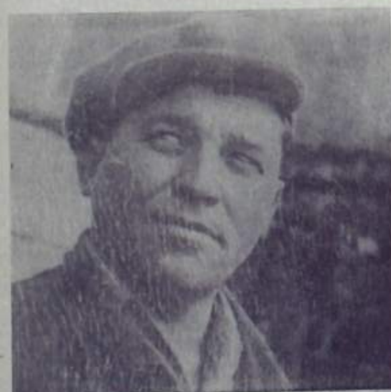
Достоинно несут предельную вахту энергетика Кумертауской ГЭС. В авангарде соревнования идет цех теплового контроля и автоматики. От его четкой работы зависят также показатели, как бесперебойное снабжение потребителей электрической энергией и паром, надежность работы котлов и турбин.

Коллектив цеха решил выполнить годовое социалистическое обязательство к 5 декабря.