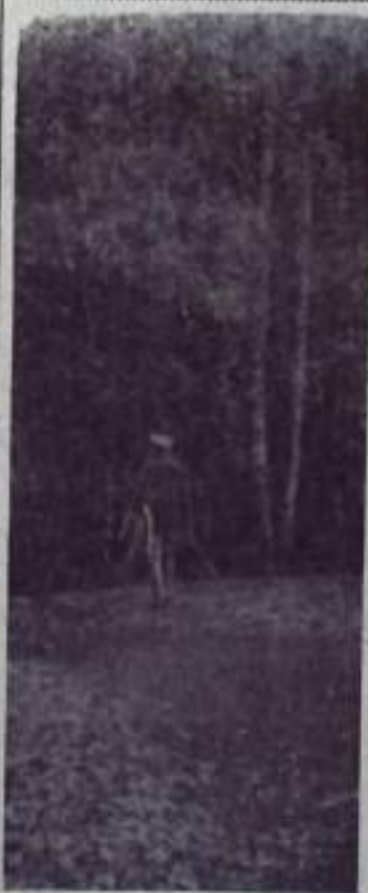
Осень.