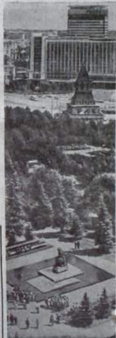
Редактор Н. И. ЛАВРОВ.

Кинотеатр «Горький» 26-27 сентября — «Судьба режиссера» 28-30 сентября — «Пылкие девушки», «Месть гайдучков» (демонстрируются однократно).