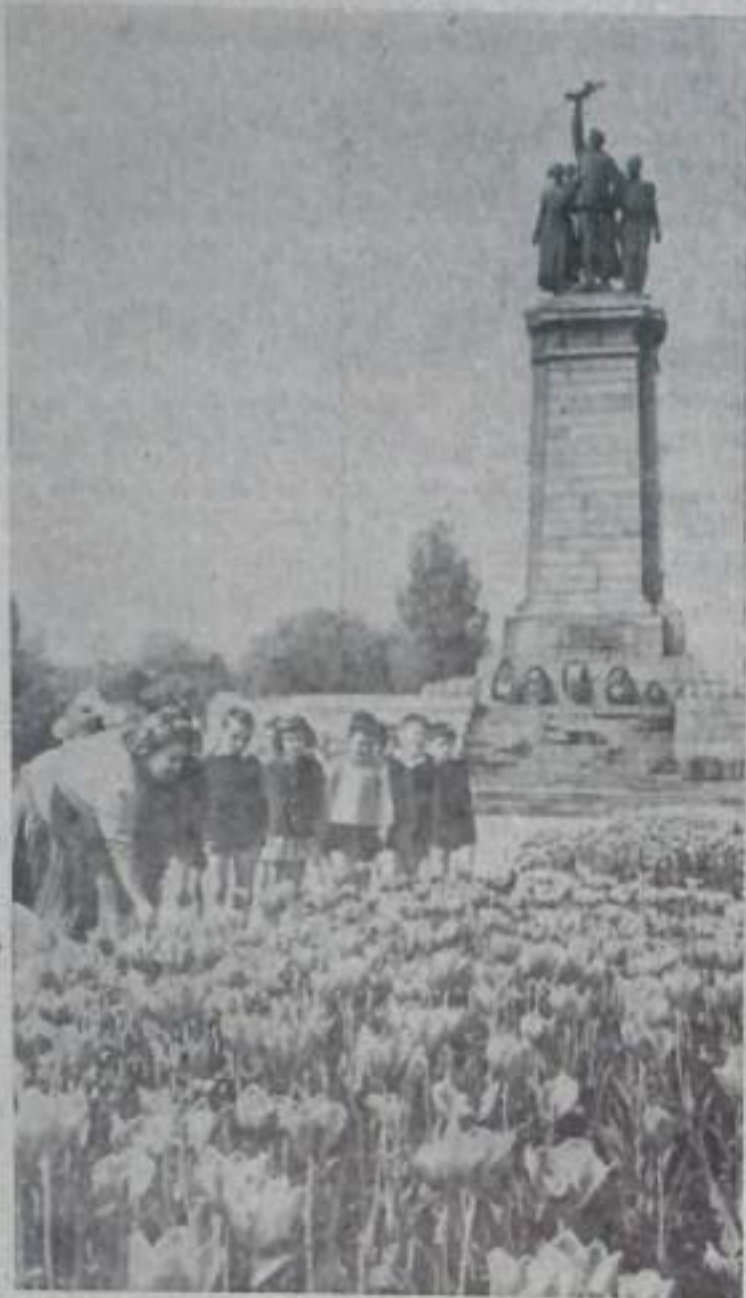
Монумент в честь Советской Армии-освободительницы, установленный в Софии — столице Народной Республики Болгарии.

9 сентября — 26-я годовщина свержения фашистской диктатуры в Болгарии (1944 г). Национальный праздник болгарского народа — День свободы