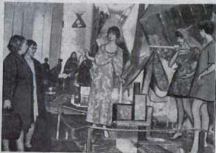
Москва. Международная выставка «Химия-70».

На снимке: посетители знакомятся с применением химических