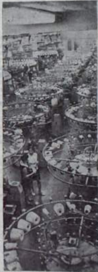
Кемеровская область. Беловская трикотажная фабрика — молодое предприятие Кузбасса.