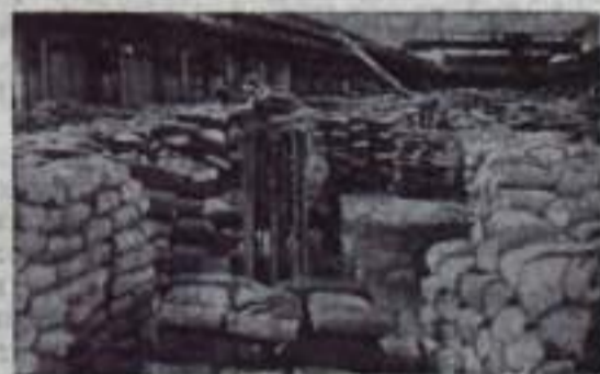
НА СНИМКЕ: общий вид склада карбонида.

Свой вклад в осуществление этого внесут и новгородские химинки. К концу пятилетия на химическом комбинате войдет в строй агрегат по производству аммиака, мощность которого будет в 2,5 раза больше, чем у действующих сейчас установок. Начнут работать цехи переработки аммиака, сложных удобрений, аммиачной селитры. Таким образом Новгородский химический комбинат увеличит поставку удобрений сельскому хозяйству более чем в 3 раза.