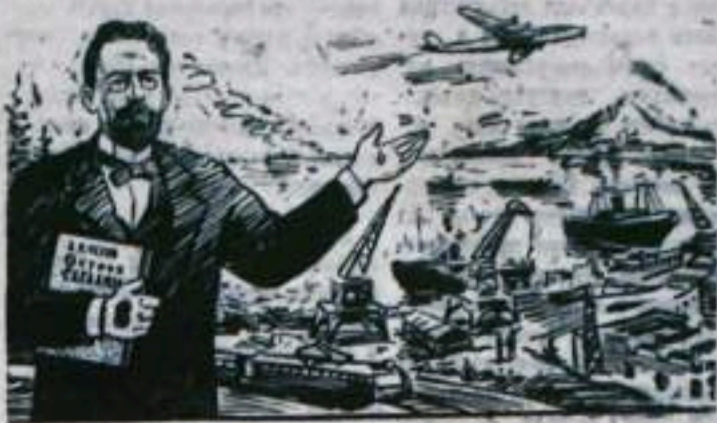
Рис. В. Жаринова,

...какая полная, умная и смелая жизнь осветит эти берега". (А. П. ЧЕХОВ).