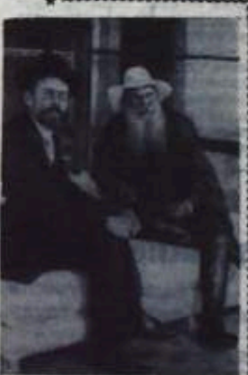
А. П. Чехов и Л. Н. Толстой (справа. 1902—1904 г. г.)

«Пришло время, надвигается на всех нас грозда, готовится здоревал, сильная буря, которая идет, уже башма, и скоро содет с нашего общества лень, равнодушие, предубеждение к труду, сияющую скуку».