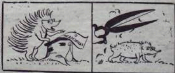
Выступление и... «наказание».

ка. Работник с кадрами студент не может не понимать, что само положение обязывает его прекратить пачкать свой облик.