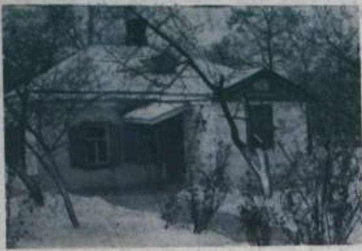
Дом в Таганроге, где родился А. П. Чехов. ныне дом-музей А. П. Чехова.