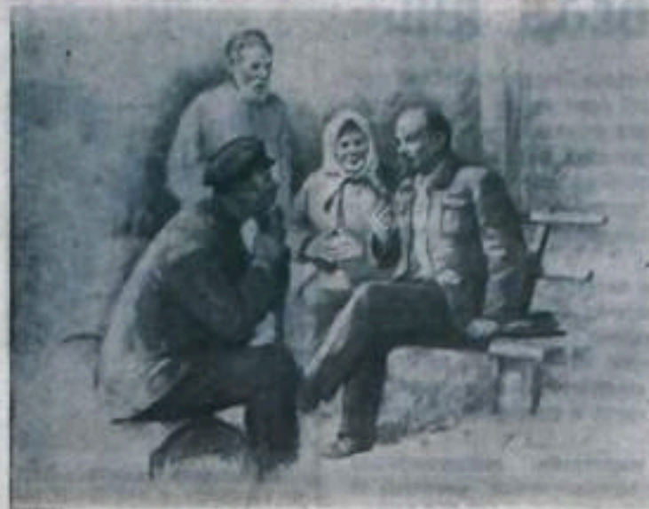
В. И. Ленин беседует с крестьянами в Горках.

Сильно взволнованные таким приемом, мы горячо поблагодарили Владимира Ильича и вышли. А еще через день явились в Отдел народного образования, и тут уж с нами разговаривали совсем по-другому. Прошло еще несколько дней. За это короткое время для нашей студии подобрали на Рижском проспекте (ныне проспект Огородников) отличный особняк с хорошим садом. Путилевцы сами приняли деятельное участие в