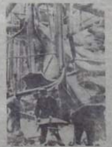
ФЕДЕРАТИВНАЯ РЕСПУБЛИКА ГЕРМАНИИ. На металлургическом предприятии «Бенд-Фелленштейн» в Дортмунде производится стальной прокат, в результате которого много рабочих, занятых в этом процессе, было уволено и ранено.

На снимке: рабочие пострадавшие под облолками металлургического оборудования.