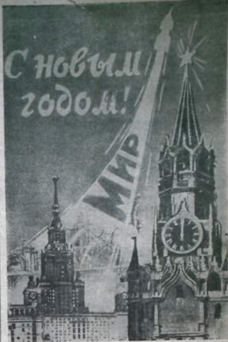
Фотоплакат Б. Антонова.

В новом году к новым победам, дорогие товарищи! А. ЧЕРЕПЕНИН, секретарь горкома КПСС.