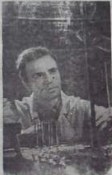
стабильные высокие урожаи на юге страны.

Предлагаемый метод повышения жаростойкости культурных растений позволит получать