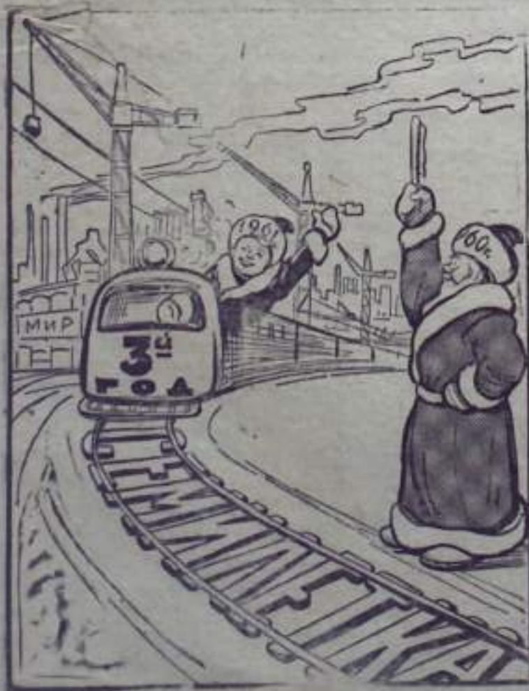
Рис. И. Жарникова.