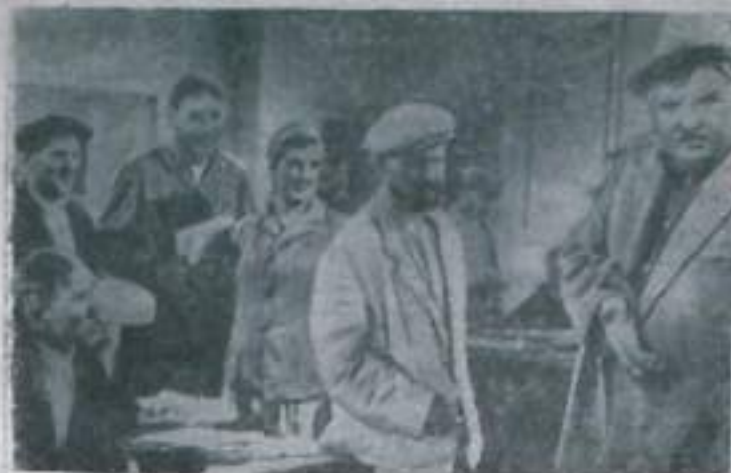
Кадр из нового кинофильма «Тужал бедас» производства студии «Ленфильм». Кинокартина поставлена режиссером Юрием Фридом по сценарию Г. Макашова. Главное действующее лицо фильма — председатель колхоза Федор Денисов.

Вечером: в 3, 5, 7, 9 часов — «Наследники» (III-я серия «Июльнини»).