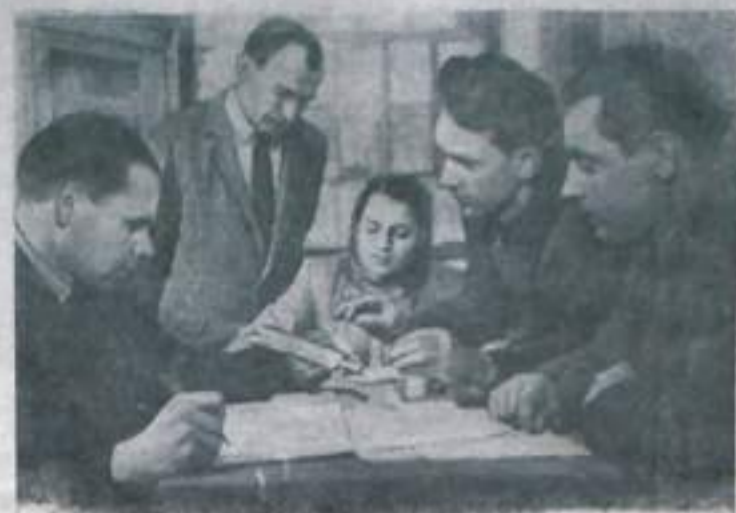
НИКОЛАЕВСКАЯ ОБЛАСТЬ. По инициативе Кривоозерского райкома комсомола в районном центре открыт консультационный пункт пяти сельскохозяйственных техникумов Николаевской, Одесской и Киевской областей. Более 200 юношей и девушек, едва успешно окончив, получили возможность приобрести среднее специальное образование без отрыва от производства. В районном комсомоле, где расположен консультационный пункт, работает особенно многолюдно и оживленно в дни консультаций, когда сюда приезжают преподаватели техникумов и связываются знакомки.