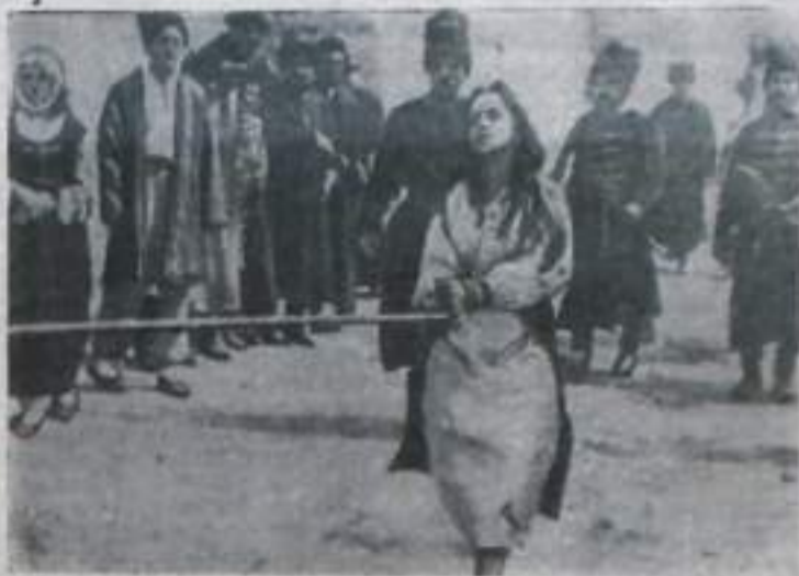
Кадр из нового фильма «Олеся Довбуш», поставленного режиссером Виктором Ивановым по сценарию Любомира Дмитренко на Киевской киностудии имени А. П. Довженко.

Фильм рассказывает о борьбе с панами отряда гуцулов, возглавляемого смелым атаманом Олесей Довбушем.