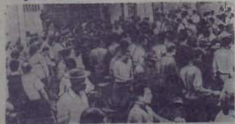
Бригада. Сотни тысяч рабочих металлургической промышленности обманали забастовку, парализовавшую все металлургические предприятия в городе Сан-Паулу. Бастующие требовали увеличения заработной платы.

На снимке: бастующие у ворот завода.