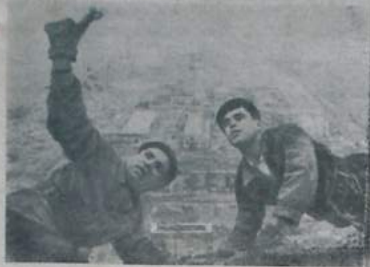
УЗБЕКСКАЯ ССР. Недалеко от Ташкента, в поселке Азан-Гарин, строится крупный цементный завод. Сюда прибыли молодые патристы со всех концов страны. Коллектив стройки обрелась во втором квартале 1961 года, на шесть месяцев раньше срока, сдать первую очередь завода. Работы ведутся по значительным опережением графика.