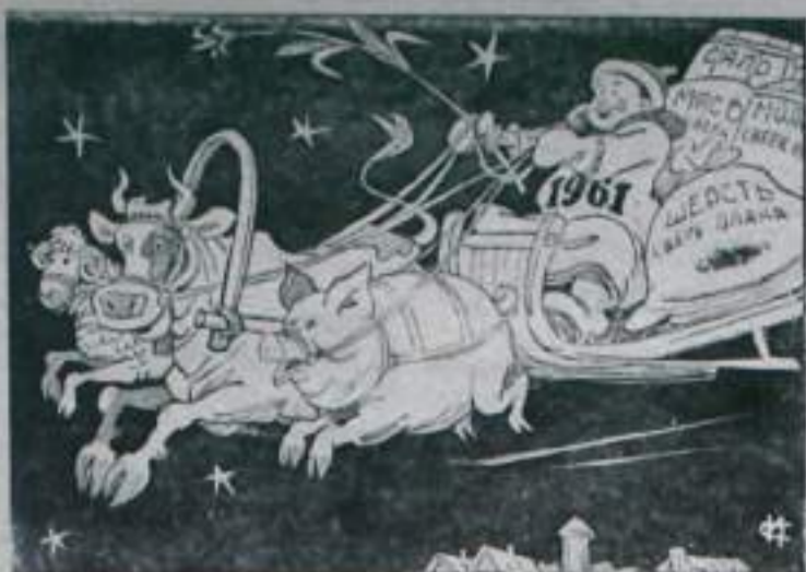
Рис. И. Сычева.

На всей большой земле! Н. КАМИНСКИЙ, завуч, средней школы № 10.