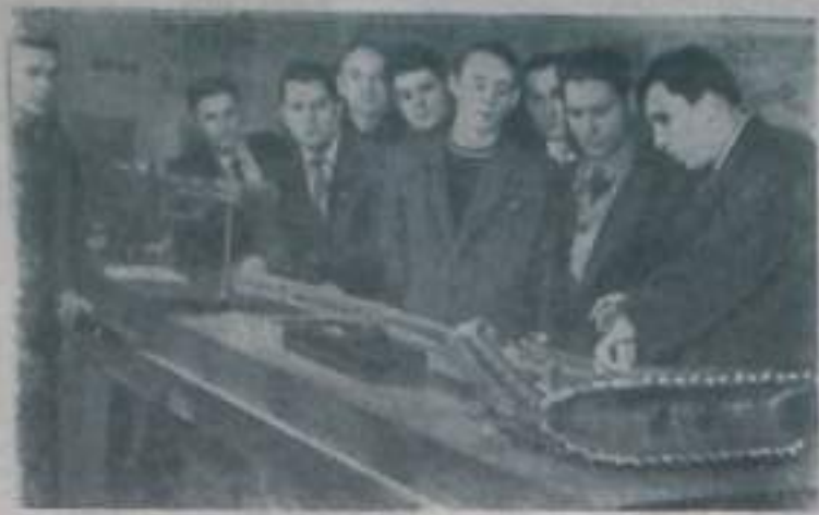
РОСТОВСКАЯ ОБЛАСТЬ. По велению в городском центре открыт университет «Технический прогресс». Многие ученые и специалисты извлекают большие уроки от работы. На территории, желавших повысить уровень своей технической культуры, уже образовался постоянный состав слушателей университета. Среди них — электрослесари шахты «Ижданская»