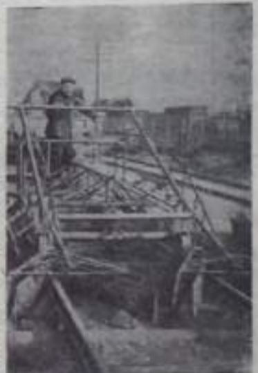
около миллиона рублей экономии в год.