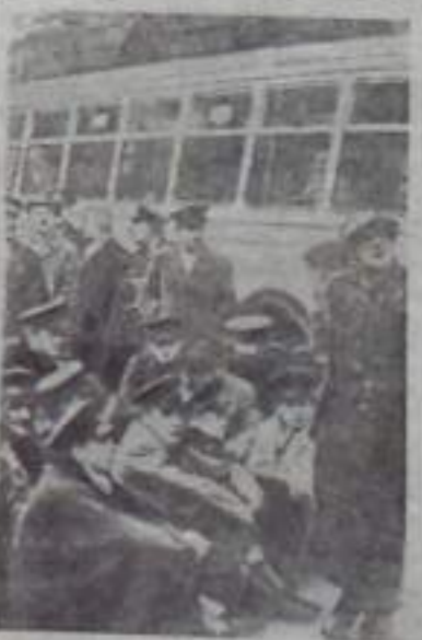
Бельгия охвачена всеобщей забастовкой. Не работают заводы. Не ходит городской транспорт, на улицах не видно автомашин.

*В адрес Союза студентов штата Сан-Пауло в Бразилии поступило более 120 заявлений от студентов и рабочих, желающих бороться в качестве добровольцев на Кубе в случае «агрессии Соединенных Штатов».