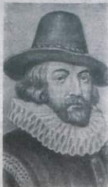
Франсис Бэкон — выдающийся английский философ-материалист.

Франсис Бэкон (1561—1626) — английский философ-материалист. Его философия направлена против господствовавшей при феодализме схоластики и богословия; она пролагала путь развитию опытных наук, необходимых для прогресса новых производительных сил. Бэкон убежден в могуществе человеческого разума, в возможности научного познания материального мира, в практическом значении знания для общественного благосостояния. В главном своем сочинении «Новый Органон»