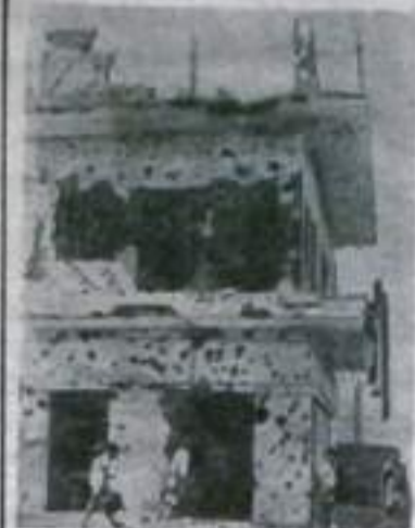
АДЕН Народная Республика Южного Тимора свободна, но эти разрушенные дома напоминают о недавних жестоких боях рабочих патриотов против британских колониальных войск.