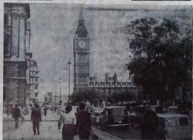
Лондон (Англия). Здание парламента.