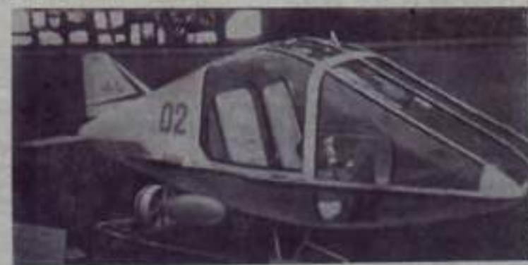
МОСКВА Эта двухместная подводная лодка «МАН-3» — экспонат Выставии достижений народного хозяйства СССР. Лодка, сконструированная и построенная в студенческом конструкторском бюро Московского авиационного института имени Серго Орджоникидзе, предназначается для научно-исследовательских работ. Она может быть также использована и любителями подводного спорта. Глубина погружения — 50 метров, скорость под водой 7 километров в час. Выпущенная летом она успешно прошла морские испытания. Фото Н. Кулешова.

для гашения радиомех. Простота устройства, небольшой вес и размеры, малое потребление электроэнергии — вот главные достоинства этой стиральной машины, созданной на Сафоновском заводе пластических масс. Новинка показывается в павильоне «Химическая промышленность» ВДНХ СССР. (Пресс-центр ВДНХ СССР — ТАСС).