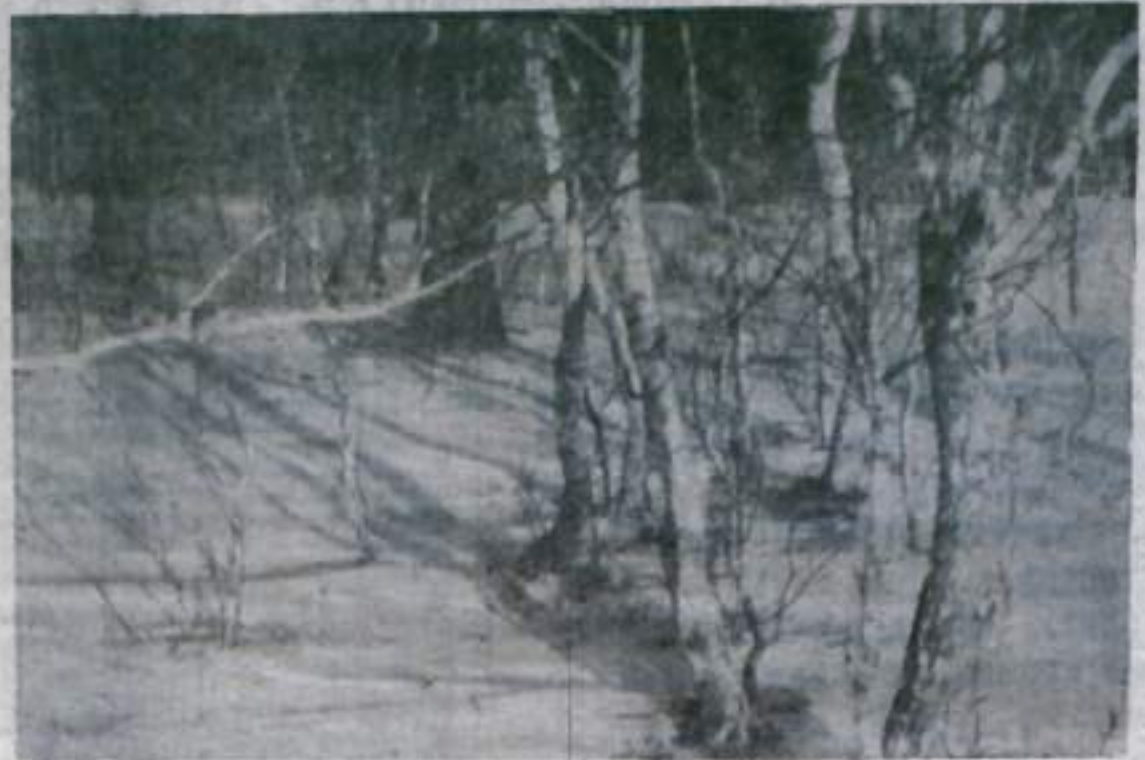
В зимний солнечный день.

и неравноправия наций. Эта конституционная хартия законодательно закрепила федеративный принцип государственного устройства Советской республики, подчеркнув, что Советская российская республика учреждается на основе свободного союза свободных наций. «Декларация», выражавшая настоящие интересы трудящихся, была единодушно утверждена первым после победы Октября съездом Советов — III Всероссийским съездом Советов рабочих, солдатских и крестьянских депутатов. Принятием «Декларации» верховный орган диктатуры пролетариата закрепил создание советского строя и заложил основы Советской Конституции. Программа социалистических преобразований, провозглашенная в ленинской «Декларации», стала законом. «Теперь мы, на расчищенном от исторического мусора пути будем строить мощное, светлое здание социалистического общества», — сказал В. И. Ленин, подводя итоги работы III съезда Советов. Ныне наше государство, отмечающее полувековой юбилей, идет широкой дорогой строительства коммунизма.