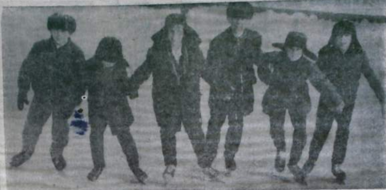
В дни зимних каникул.