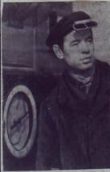
Донецкая область. Стальвары Мадеевского металлургического завода имени Кирова — активные участники во всесоюзном соревновании за производство в минувшем году 100 миллионов тонн стали за почетное