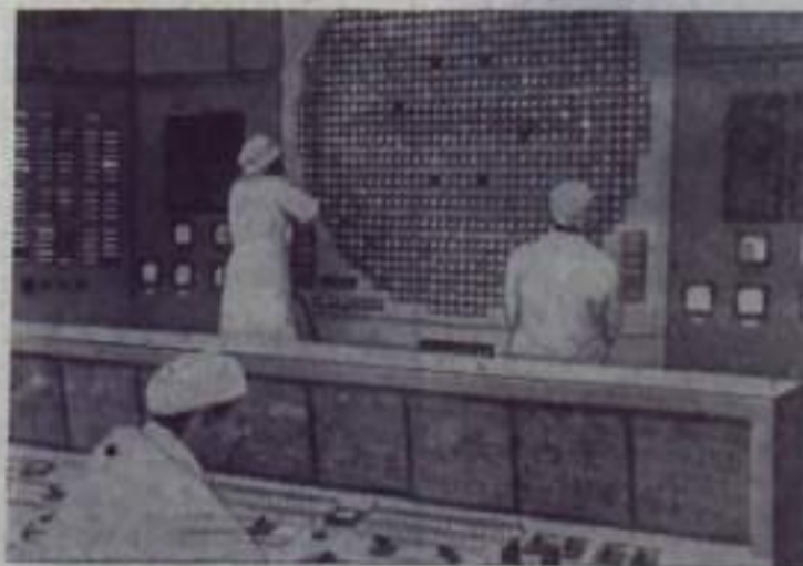
СВЕРДЛОВСКАЯ ОБЛАСТЬ. На Белоярской атомной электростанции имени И. В. Курчатова закончено сооружение второго энергоблока мощностью 200 тысяч киловатт. Состоялся физический пуск нового реактора. НА СНИМКЕ: у блочного щита управления нового реактора.

Владивосток, 16 января. (ТАСС). Сегодня в Приморское управление гидрометеослужбы пришла радиограмма с борта экспедиционного судна «Академик Ширшов». Капитан Евгений Иванов и начальник рейса Григорий Хлоев сообщают, что советский исследовательский корабль только что миновал