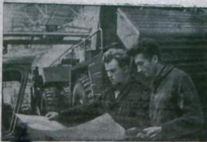
В Белорусском ордена Трудового Красного Знамени автомобильном заводе идет сборка 40-тонных самосвалов «Белаз-548А». Они предназначены для новостроек у берегов Волги, для Ингулецкого горнообогатительного комбината и других предприятий страны.

И. НАДТОЧИЯ, главный зоотехник райсельхозуправления.