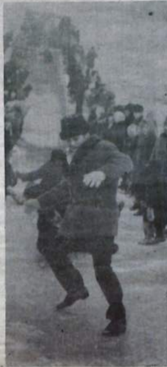
С горки катаются не только дети.