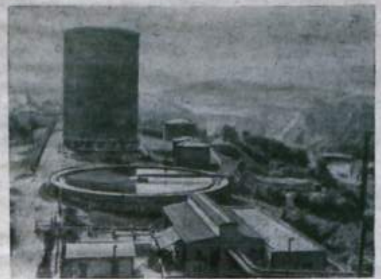
ВЕНГРИЯ. Галгольдер емкостью 150000 кубометров сооружается на металлургическом комбинате в Озде. Контейнер доставлен сюда из Остравы (ЧССР), монтаж ведется венгерскими и чехословацкими специалистами.