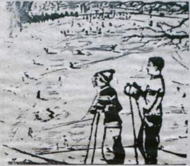
Хорошо по морозу на лыжах скользнуть, Хорошо молодым, очарованным быть! Рис. Ф. ТРОФИМОВА.

На этой странице мы продолжаем рассказ о трудовых буднях молодежи, о ее досуге, о том, что думают и чем живут юноши и девушки нашего города и района. Тебе слово, юность!