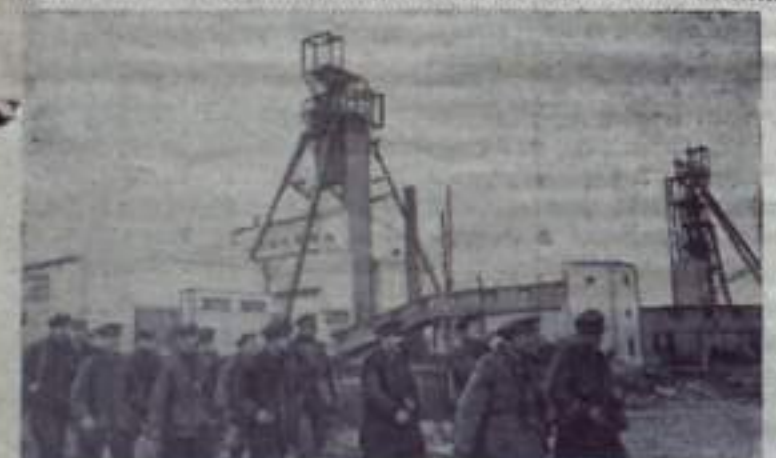
Недалеко от города Первомайска Луганской области завершено строительство крупнейшей в Донбассе шахты «Мария-Глубокая». Первая очередь мощного угольного предприятия будет давать в сутки три тысячи тонн топлива. Шахта оснащена новейшей горнодобывающей техникой.