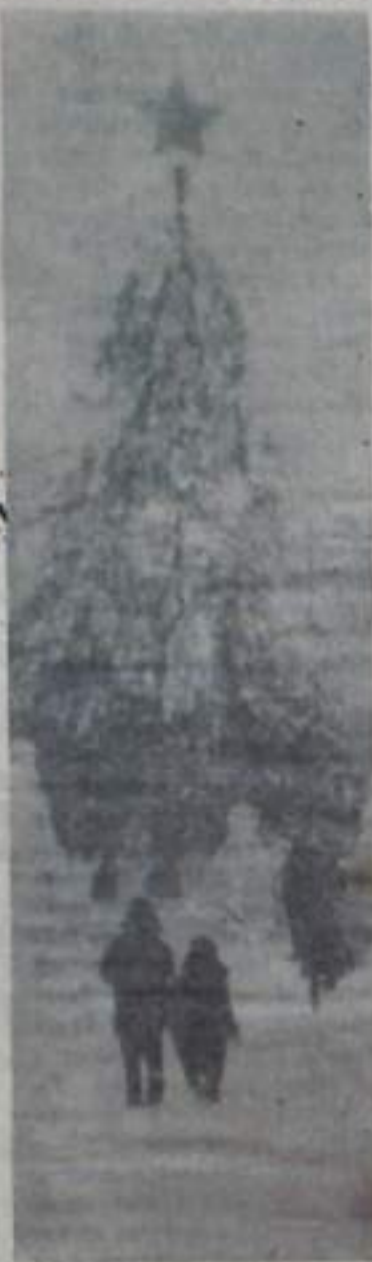
У новогодней елки.