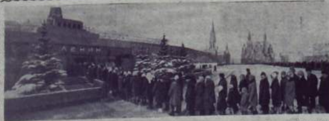
Москва, январь 1968 года. Нескончаемый живой поток движется по Красной площади... Ежедневно тысячи людей — москвичей, приезжих из разных районов нашей страны и зарубежных гостей приходит сюда к Мавзолею В. И. Ленина, чтобы почтить память великого вождя, основателя первого в мире социалистического государства.