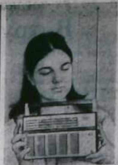
Ленинград. «Спорт-3» — так называется новый портативный транзисторный радиоприемник, разработанный во Всесоюзном научно-исследовательском институте радиовещательного приема и акустики (ИРПА) имени А. С. Попова.

Новый приемник снабжен телескопической антенной, весит 1200 граммов и питается от 4-х батареек типа «343», емкости которых достаточно на 100 часов работы. Начался его серийный выпуск.