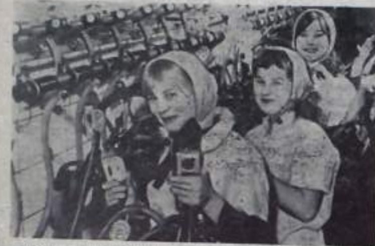
Молодые животноводы народного имени в Зверьбаже-Штокскулене (ГДР). От каждой из обслуживаемых молодежной бригадой 200 коров за год получено по 5200 килограммов молока.

По инициативе производственного кооператива области Хайду-Бихар, подарившего своей школе телевизор, кооперативы, предприятия учреждения республики стали выделять средства для этой цели.