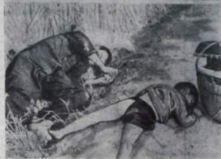
женные интервентами; старик и ребенок—жертвы Сонгми.