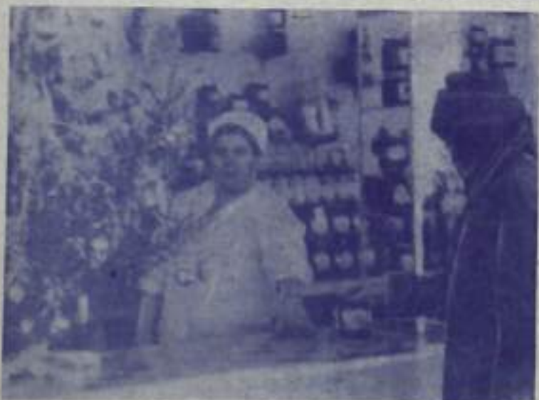
В эти дни магазины города встречают покупателей в новогодней обстановке.