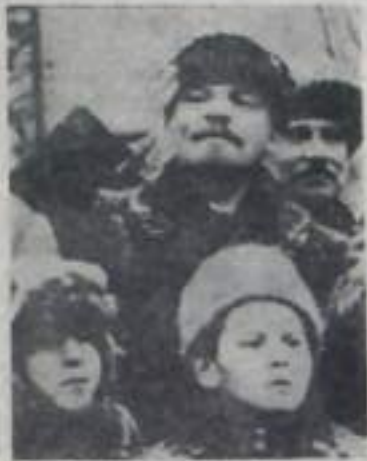
В. И. Ленин на Красной площади во время празднования 2-й годовщины Великой Октябрьской социалистической революции. Москва, 7 ноября 1919 года. (Верхний снимок).