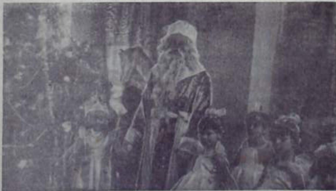
Радостью встретили детвора каникулы Нового года. Он пришел веселый, с добрым Дедом Морозом, с веселой Снегурочкой, с подарками. Дети беззаботно резвились у сияющих разноцветными огнями красочных елок. Всюду звен-