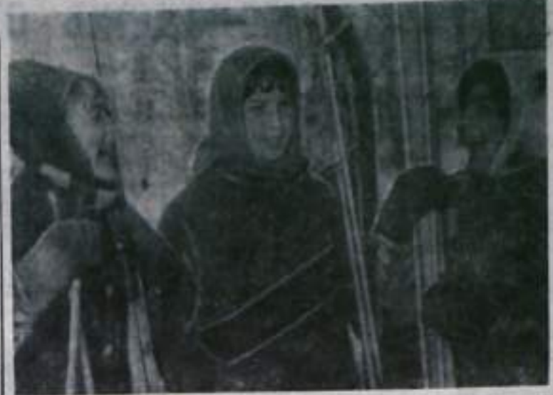
В воскресный день.

Идет, торопится мальчишка, Нелегко у мальчишки груз: Округло светится под мышкой Скрипящий свежестью арбуз. Идет устало через площадь, Пусть тяжело ему... Но вдруг Отполированная ноша Скользит и падает из рук. И мальчик плачет над арбузом, Ему становится ясней, Что было легче с этим грузом. Без груза стало тяжелей. Порой не знаешь, что за ношу Несешь обузу из обуз. «Подумаешь, возьму да брошу...» А вдруг окажется — Арбуз?..