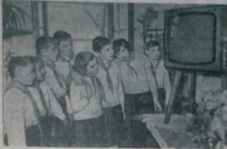
На снимках: это 100-й телевизор, подаренный венгерским школьникам. Его купила для ребят сельской школы области Чонград редакция газеты «Непсари» — центрального органа профсоюзов.

«Каждой школе — телевизор!» — так называется движение, развернувшееся в Венгерской Народной Республике.