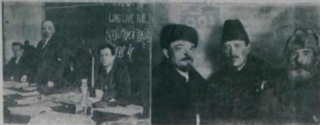
В. И. Ленин в президиуме I конгресса Коминтерна в Кремле. Слева направо: Г. Эберлейн, В. И. Ленин и Ф. Платтен. Москва, 2—6 марта 1919 года.