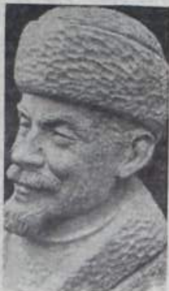
На снимке — портрет В. И. Ленина, выполненный в бронзе Фрэнком Сингером.

Недавно Сингер закончил свою последнюю работу. Это — В. И. Ленин, реконструкция из бронзы. В скульптуре Сингер старается передать портрет основателя Советского государства и маршала, завершив его к 100-летию со дня рождения вождя.