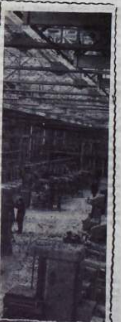
УЛЬЯНОВСКАЯ ОБЛАСТЬ. Корпус вспомогательных цехов вступил в строй на сооружении в Мелекессе завода кузовной арматуры. Предприятие будет спутником автомобильного гиганта в Голытты. В новом корпусе работают цехи и участки, выпускающие технологический инструмент в основном. НА СНИМКЕ: общий вид инструментального цеха.

А. ШВЕЦОВ, председатель МК профсоюза ПТУ.