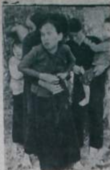
ЮЖНЫЙ ВЬЕТНАМ. Утром 16 марта 1968 года рота «С» 1-й батальона 11-й американской пехотной бригады высадилась с вертолетов в окрестностях южновьетнамской общины Сонгми.

Солдаты, одетые в военную форму США, расстреляли около 500 мирных жителей, не пощадили ни детей, ни женщин, ни стариков. Только немногим удалось избежать смерти. После кровавой расправы, американские оккупанты дотла сожгли деревню. День 16 марта 1968 года навсегда вошел в историю, как день позора американской армии. Деревня Сонгми постигла страшная участь Лидице, Орадура, Хатыни. Вест о трагедии в Сонгми заставила содрогнуться весь мир, вызвав гневный протест всего прогрессивного человечества против преступления американской армии.