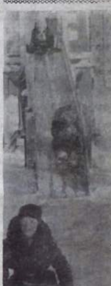
У нас во дворе.