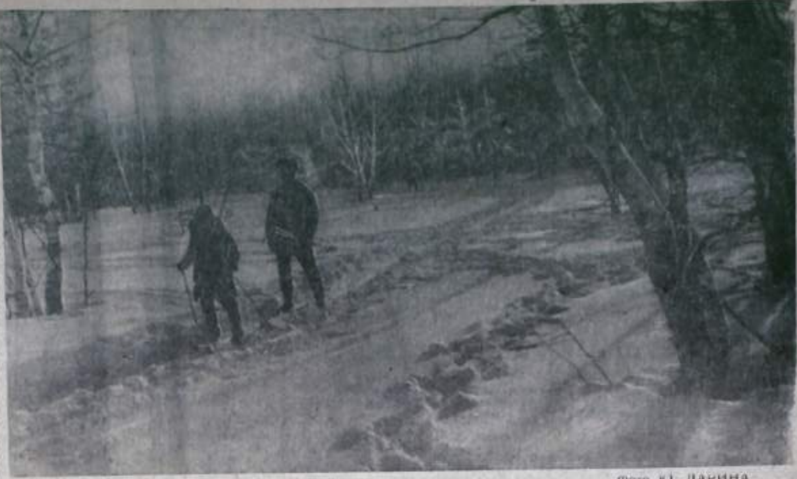
Возвращение с лыжной прогулки.

По числу изданий ленинских работ и их тиражу Аргентина занимает первое место в Латинской Америке (не считая Кубы). (ТАСС)