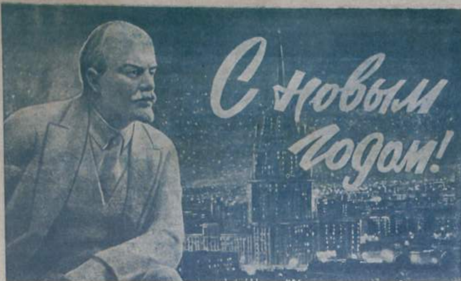
Плакат издательства «Московская правда».

Снежная десница, Бело-вьюжный клей Льется на ресницы Смуглых тополей. Мчится вихрем тройка, Синяя вуаль. Эй, ямщик, стой-ка, Иль коней не жаль? Пусть метель не злится, Полная угроза: Мчатся в колеснице Добрый Дед Мороз. Новый Год в ракете Облетает мир, Календарным светом Блещет из квартир. Старый год уходит С сединой в усах, Реет в хороводе Лунная коса. В ворохе событий Рвется из груди: «Здравствуй, Год-строитель! Доброго пути!»