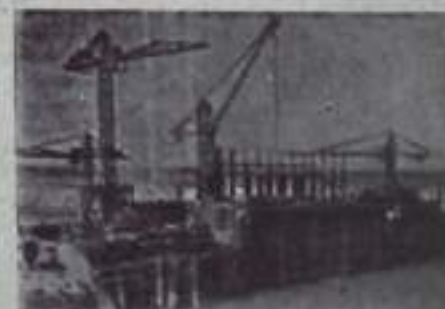
Красноярский край. Сореница в честь XXIV съезда КПСС, коллектив «Хантайтэ-строй» пересмотрел свои обязательства и решил завершить строительство Усть-Хантайской гидроэлектростанции на год раньше срока.