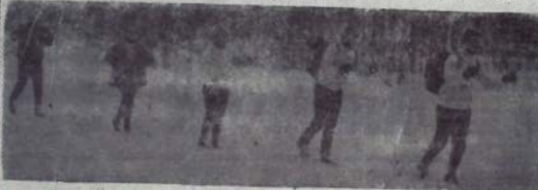
На трассе звездно-лыжной эстафеты маневрируют.