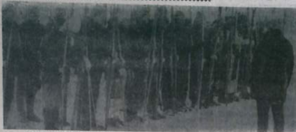
Участники спартакиады перед открытием соревнования.