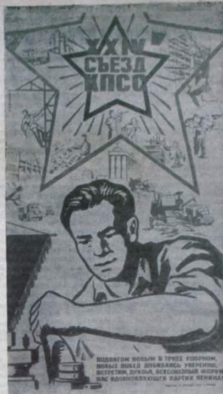
Плакат художника М. Соловьева, выпущенный издательством «Агитплакат» к XXIV съезду КПСС.

С Новым годом, с новым счастьем, дорогие товарищи!