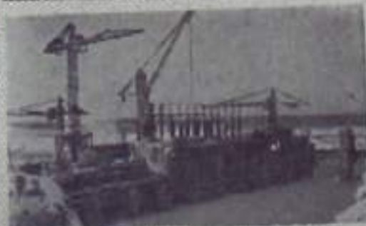
КРАСНОЯРСКИЙ КРАЙ. Соревнуясь в честь XXIV съезда КПСС, коллектив «Хантайгэстроя» пересмотрел свои обязательства и решил завершить строительство Усть-Хантайской гидроэлектростанции на год раньше срока.

Обязательства обсуждены и приняты на собрании партийно-хозяйственного актива города 22 января 1971 г.