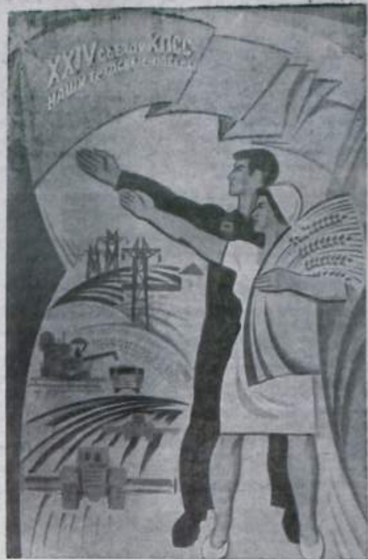
Плакат художника В. Механтьева. (Издательство «Изобразительное искусство»).