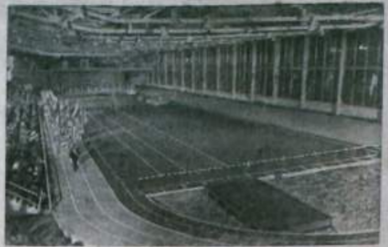
МОСКВА. Распахнулись двери нового легкоатлетического стадиона в Сокольниках. По всем своим качествам новый манеж можно считать лучшим в Европе.